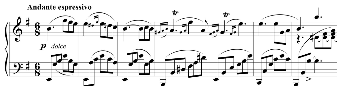
Ejemplo 11. Adalid: El lamento , balada para piano op. 9.