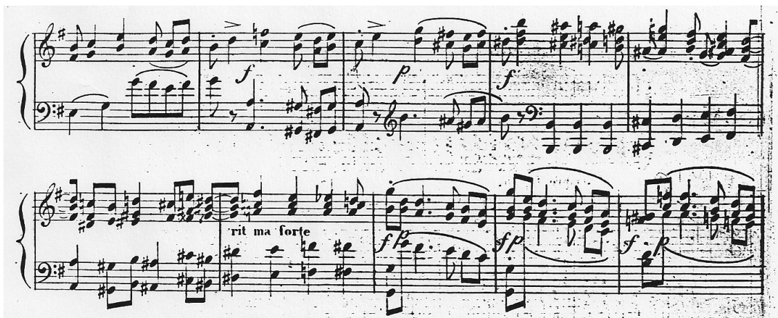
Ejemplo 7. Masarnau: Fantasia op. 21, cc. 30-39.

característico del estilo de Masarnau: la armonía es romántica; la textura densa, de carácter contrapuntístico; hay abundantes indicaciones dinámicas; y muchos elementos de virtuosismo pianístico. Podríamos relacionar fácilmente este estilo con el de Cramer o Moscheles. Sin embargo, en la mayor parte de sus obras posteriores evita el virtuosismo, en un proceso consciente de depuración: «¿Qué importa que el ignorante estime en menos al nuevo pianista, porque no le hace oír tantas notas como el anterior?» 50 . Esto no quiere decir que su lenguaje se simplifique; aunque el grado de dificultad de sus obras sea muy variado, así como su grado de complejidad y su calidad, el piano de Masarnau mantiene una armonía romántica y una textura densa, enraizada en el contrapunto (ej. 7).