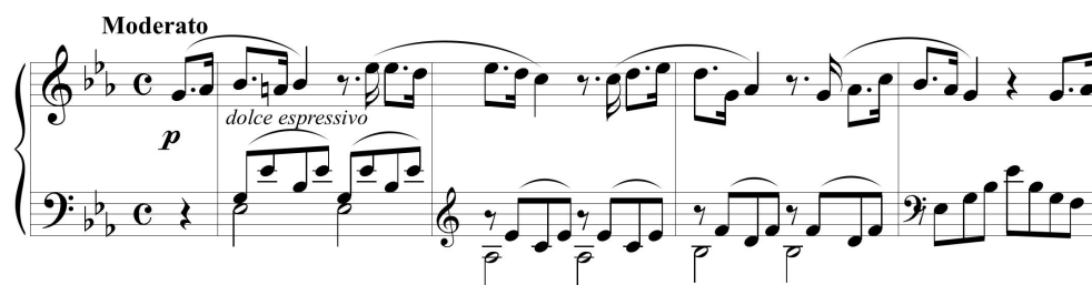
Ejemplo 1. Variaciones brillantes para piano forte sobre un motivo favorito de la Norma , cc. 20-23

forte sobre un motivo favorito de la Norma (ej. 1); la Fantasia para piano forte sobre motivos de la Lucía o las dos Fantasías para piano sobre motivos del Nabucodonosor para piano a cuatro manos, incluidas en la colección Instrucción y Recreo en 1846.