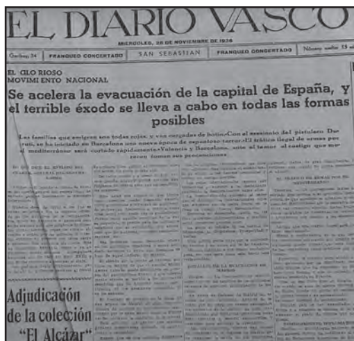
Titular de El Diario Vasco del 25 de noviembre de 1936

y a mí nos pareció muy divertido. Desde Deba subimos a un camión que nos llevó hasta Bilbao. Allí nos acogió un amigo médico de mi padre, ideológicamente afín, que ayudó a varias familias de San Sebastián. El dinero no servía de mucho; había cola para comprar hasta el pan y se acababa todo muy rápido. Los bombardeos no cesaban; sonaba la sirena y mi madre nos llevaba al refugio a mi hermana y a mí hasta que pasaba. Ante el avance de los sublevados, las autoridades gubernamentales promovieron el abandono de ciudades en la línea de combate y también la marcha de niños y niñas que se exiliarían lejos de sus familias. Mi hermana y yo fuimos dos de esas niñas.