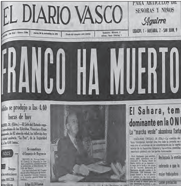
Titular de El Diario Vasco del 20 de noviembre de 1975

La vida de Franco, de 82 años, enfermo de parkinson y con problemas circulatorios, se acercaba a su final y concluyó, tras larga agonía, el 20 de noviembre.