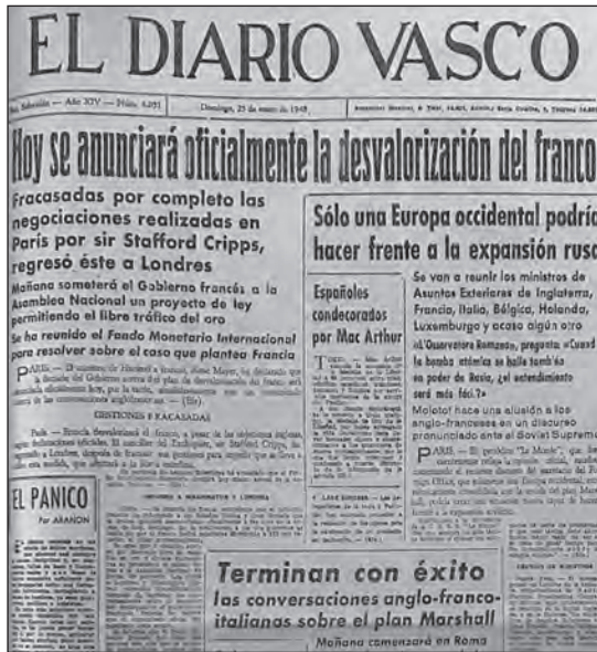
Titular de El Diario Vasco del 25 de enero de 1948

estrenado marido y yo estábamos llenos de ilusión, de fe y de confianza. Nada podía salir mal. No había espacio para la desesperanza ni para el silencio ni para la nada ni para el fracaso colectivo. Si todo eso estaba ahí, nosotros éramos inmunes a esa realidad del franquismo.