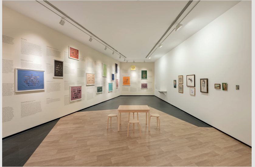
Figuras 1, 2 y 3. Vista general de la exposición «El origen de las formas» de Cristina Garrido