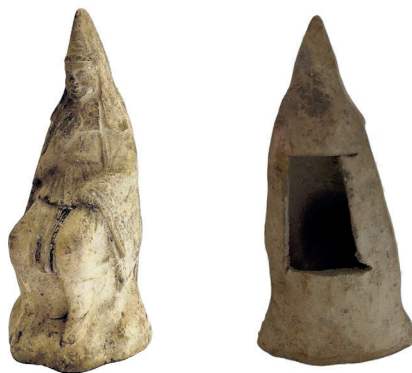
Figura 4. Terracotta de Atis sedente, s. IV a. C. Posiblemente procedente de Macedonia. Museum für Kunst und Gewerbe, Hamburg (inv. Nro. 1917.979).

El amplio compendio reunido por Maarten J. Vermaseren en torno a los monumentos que representan a la figura de Atis, así como su análisis iconográfico en el Lexicon Iconographicum Mythologiae Classicae , dan cuenta de lo extendido que estaba su culto en todo el mediterráneo 65 , aunque quizá los yacimientos más ricos en imaginería frigia se sitúan en Roma y Ostia Antica . Desde pequeñas figuritas de terracota hasta relieves monumentales y bultos redondos, su modelo iconográfico parece establecerse en Grecia, en el s. IV a. C., en donde aparece vestido ya con gorro frigio, túnica corta y anaxarydes (Fig. 4). Su representación se asimilará, en ocasiones, a la de Eros, Dionisos, Harpócrates, Mitra, etc., debido a los diversos procesos sincréticos que sufre su figura en época helenística. En ocasiones representado como un niño, un efebo o un joven adulto, sus atributos habituales serán el pedum o báculo de pastor, la siringa, los címbalos y el tímpano, así como también diversos elementos de la naturaleza, como rocas –que recuerdan su nacimiento y a su paredra, la diosa Cibeles–, frutas, animales, plantas y, por supuesto, el pino. En algunos casos, Atis se representa apoyado o reclinado sobre su tronco, sintetizando dos momentos del mito: su emasculación a los pies del pino y su asimilación al mismo en los rituales.