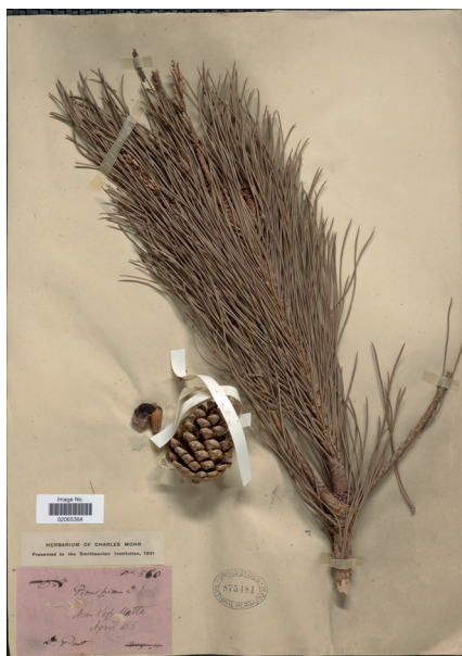
Figura 3. Rama y fruto del pinus pinea . Smithsonian National Museum of Natural History.

En ocasiones, la literatura antigua confunde el pino con otras coníferas similares, pero el cultivo por sus preciados piñones lo sitúan en una posición privilegiada 46 . Múltiples fuentes mencionan al pino de forma subsidiaria, es decir, aluden a su utilidad en cuanto a la preparación del terreno de labranza y como soporte para correcta sujeción de las vides 47 , el establecimiento de lindes 48 , su empleo en la construcción naviera 49 , su uso en la gastronomía 50 ; etc. Algunos testimonios dan cuenta de los peligros de la deforestación por catástrofes naturales y por la acción humana (pues los bosques eran explotados para la obtención de combustible, material de construcción, navíos y armas) 51 , aunque también se relata la voraz acción del ganado, el cual arrasaba con todos aquellos arbustos y brotes tiernos que encontrara a su paso, entre los que se incluye el pino 52 .