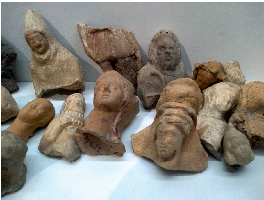
Figura 1. Exvotos con la imagen de Atis, s. III a. C. Museo Palatino, Roma.

La naturaleza orgiástica del culto, caracterizada por prácticas expiatorias como la castración y bautismos de sangre (criobolios y taurobolios) a los que se sometían los sacerdotes y sus iniciados ( kybeboi, galli, metragyrtes, etc ) causó cierta conmoción en la sociedad romana, por lo que su culto fue transformado en numerosas ocasiones con el fin de controlar y adaptar las celebraciones a las prácticas y costumbres locales 15 . No obstante, algunos historiadores asumen que en realidad se trataría de un intento de las elites por apropiarse de una devoción que ya estaba presente en los bajos estratos sociales, ejerciendo, de esta forma, una vigilancia restrictiva del culto e identificándose con una divinidad protectora y garante de Roma. Futuros procesos legislativos terminarían por establecer las celebraciones públicas de Cibeles y, junto