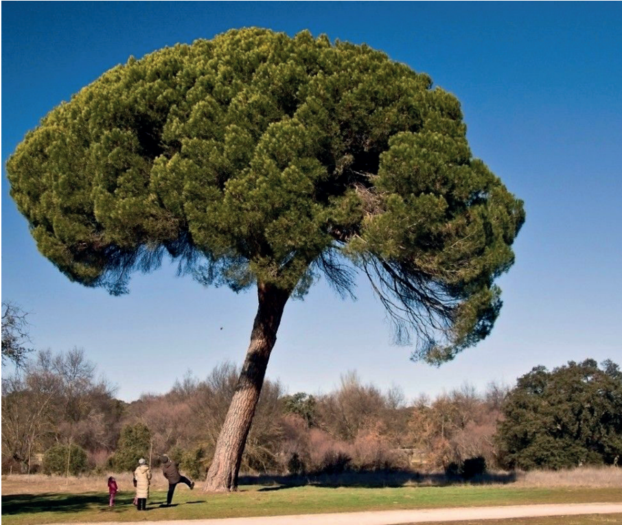
Figura 2. Pino piñonero en Boadilla del Monte, Madrid, enero 2009.

prehistórica, al igual que en yacimientos griegos, etruscos, romanos, etc. 44 . Se han querido ver representaciones del pino en los llamados árbol de la vida asirios, árboles sagrados caracterizados por sus largos troncos y amplias ramas, generalmente entendidos como palmeras, ya que sus frutos, los dátiles, se asemejan en su iconografía a la piña 45 .