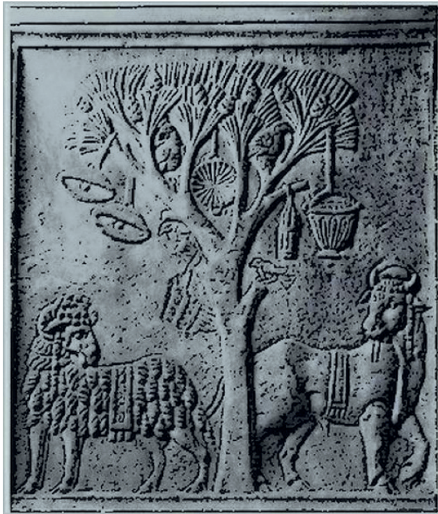
Figura 6. Frontal de altar procedente de Vía Appia, Roma, 295 d. C. Museo Villa Albani inv. 215.208.

El motivo del pino resulta omnipresente en los monumentos asociados a los llamados cultos frigios, incluso un exvoto en bulto redondo del mismo de casi 1m de altura con una serpiente enroscada en su tronco se halló en el santuario de Ostia Antica (s. II d. C.) 71 . Sin embargo, es a partir de finales del siglo III d.C. cuando el propio pino sustituirá la imagen antropomórfica de Atis. Un gran número de aras votivas halladas en Roma y alrededores conservan la figura de la conífera junto a instrumentos musicales, el báculo de pastor, el gorró frigio y diversos animales, atributos habituales de la divinidad. En todos los casos, el pino se erige como eje de la composición, con un largo tronco que culmina en una copa en forma de abanico coronada por piñas 72 . Así, Atis deviene en el propio pino: éste se convierte en un símbolo del dios (Fig. 6).