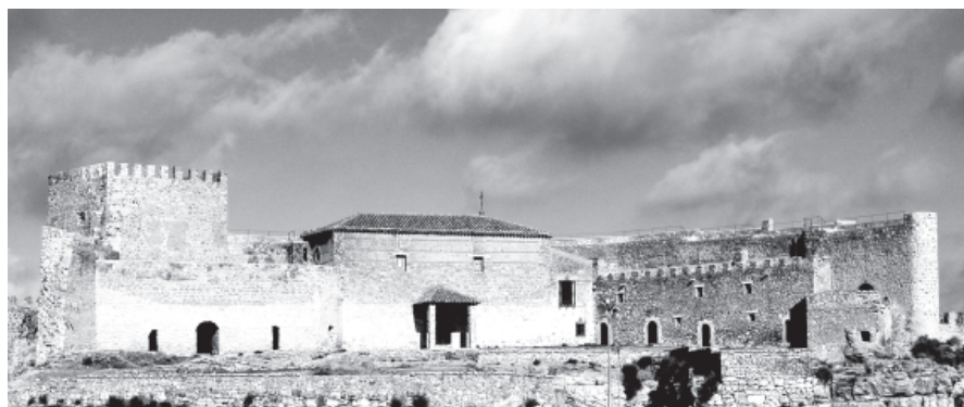
Figura 5. Castillo y Santuario de Peñarroya (Argamasilla de Alba).

Es una fortaleza medieval reedificada en época moderna, que domina un desfiladero por el que discurre el río Guadiana.