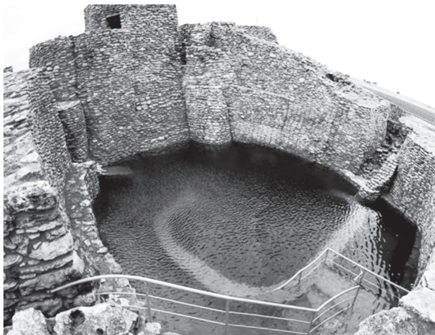
Figura 2. La Motilla del Azuer (Daimiel) es la mejor muestra de los primeros pozos de la Península Ibérica. Hubieron de ser fortificados para proteger el agua de su interior; que era un recurso estratégico y muy codiciado en aquel periodo de prolongada sequía.

Sobre éste último tipo de problema no hay más solución que la aplicación urgente de medidas de conservación por parte de la Administración competente. A la solu-