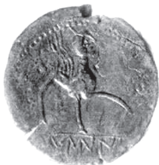
Figura 3. Esfinge o grifo marchante a derechas que caracteriza las monedas procedentes de la ceca de Leuni/Labini, identificada con Lamini(um) Alhambra. Esta imagen es un motivo orientalizante, legado de la influencia cartaginesa en la zona. Esta bestia fabulosa protegía a la dinastía que la invocaba.

Ambos museos, los togados restaurados en 2009 que se pueden visitar en la Plaza Mayor, el castillo islámico o la necrópolis rupestre visigoda de Las Eras de 67 tum-