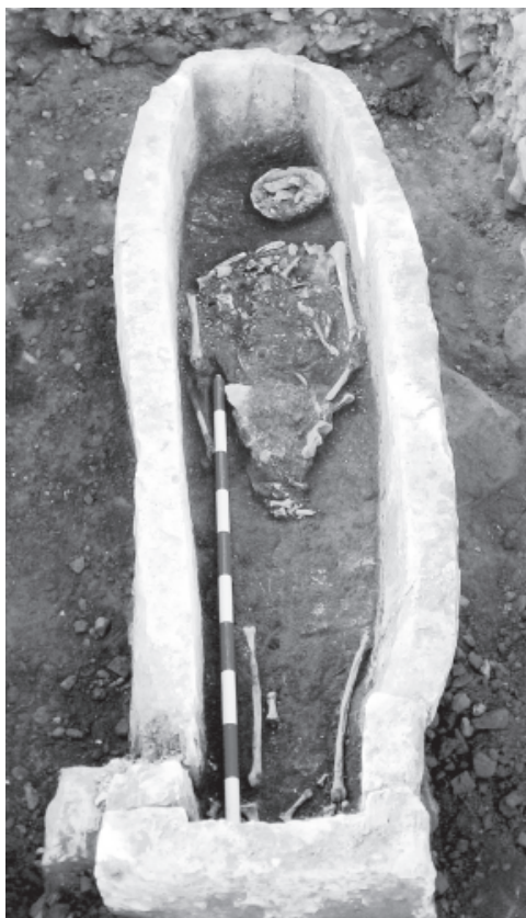
Figura 4. Tumba visigoda del Santuario de la Virgen de la Sierra (Villarrubia de los Ojos).

En el lugar se ubica una necrópolis rural con más tumbas medievales, aún pendientes de investigación. La necrópolis de la Virgen de la Sierra puede estar relacionada directamente con un vicus (aldea) enclavado junto a la misma en el lugar de Jétar (Xetar o Gétor), al que se accedía desde el Camino de Veladores.