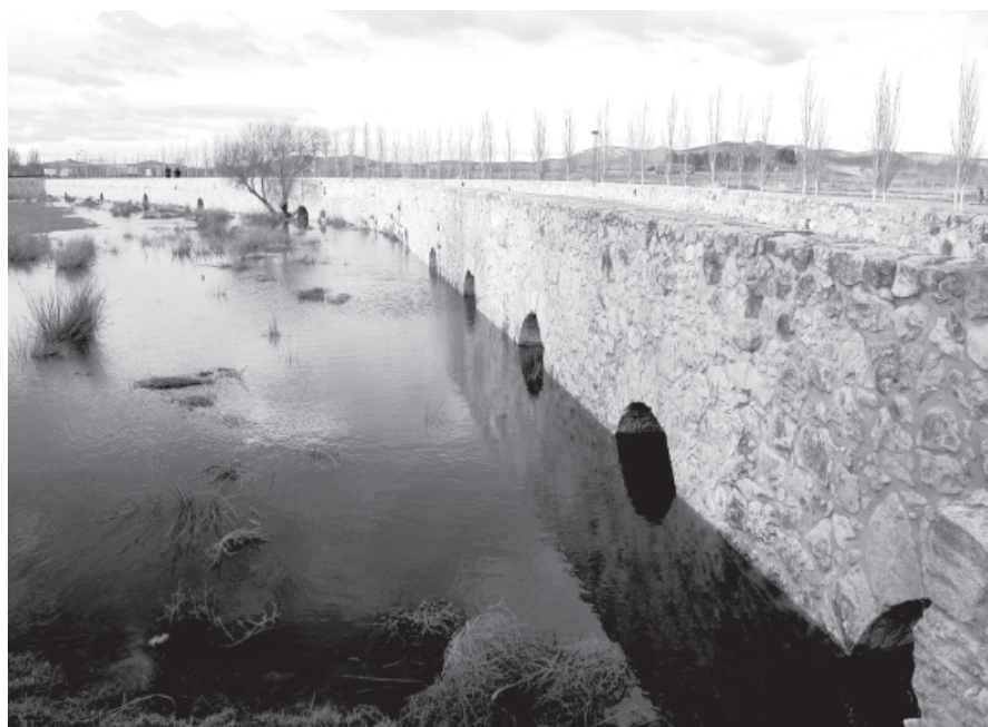
Figura 6. Puente de Villarta de San Juan.

No obstante, la mayor parte del caudal se dirige hacia el tramo meridional , que por eso es más corto –150 m– y cuenta, en proporción a su longitud, con un mayor número de ojos: 25. Éstos son, precisamente, los que tienen una separación más uniforme entre sí y los que se encuentran más juntos unos de otros.