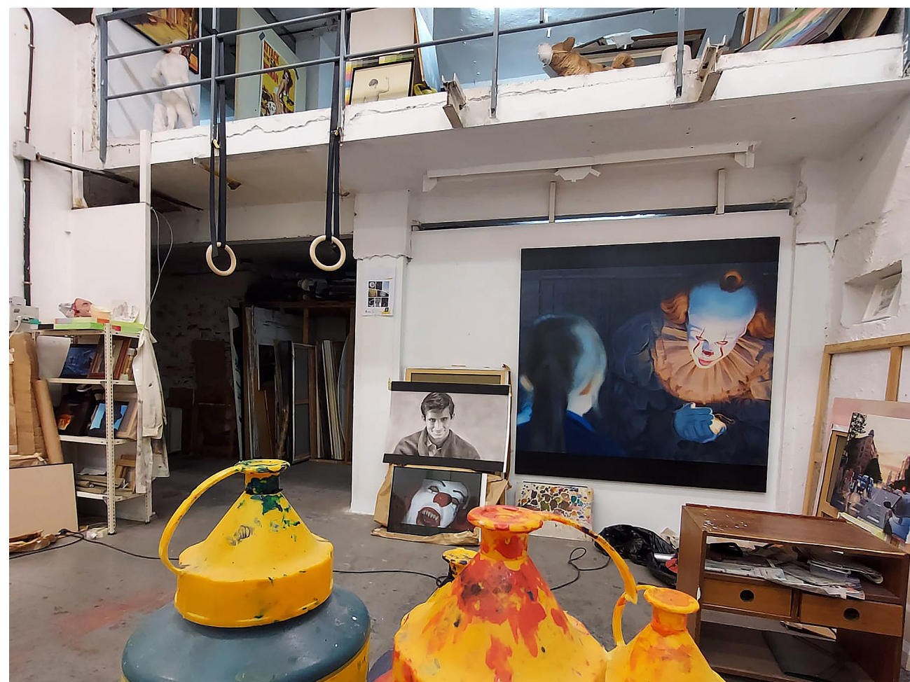
Vista del estudio de Fernando Alonso desde su parte inferior