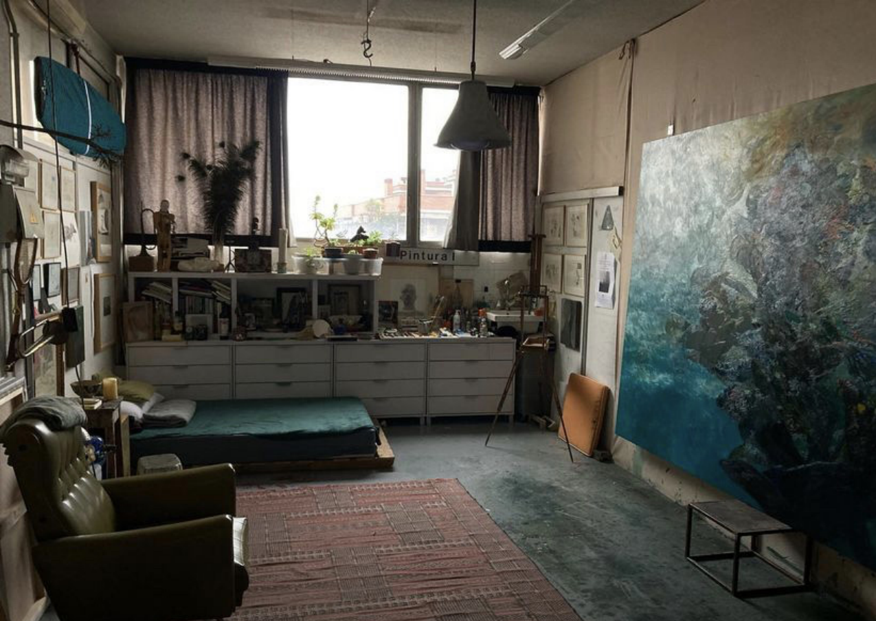
GUILLERMO OYAGÜEZ MONTERO

Mi estudio no es grande, no creo llegue a 20 metros cuadrados, aún así pinto en él cuadros de 200x300 cm, el techo si es alto, 3 metros, mi estudio es el lugar donde me quedo cuando no hay otra opción, cuando no puedo estar donde ocurren todas las cosas, en la mayor de las inspiraciones, la calle, el paisaje.