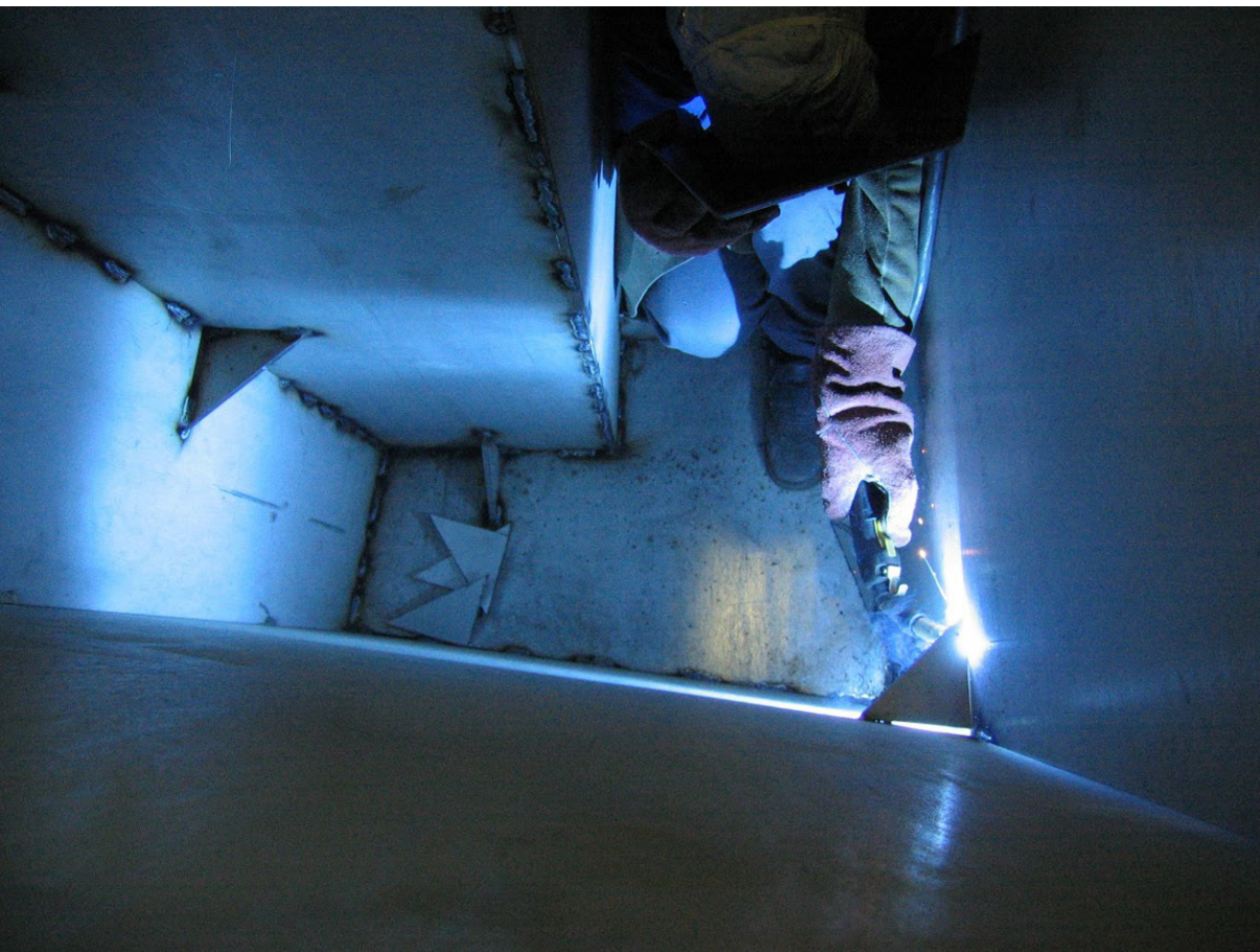
Óscar Alvariño trabajando en una de sus esculturas