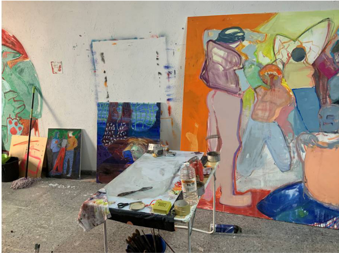
Taller de Irene Anguita Cuadra