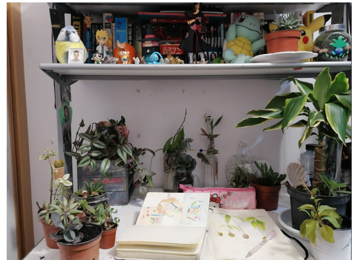
Mesa de trabajo de Teresa Pecker