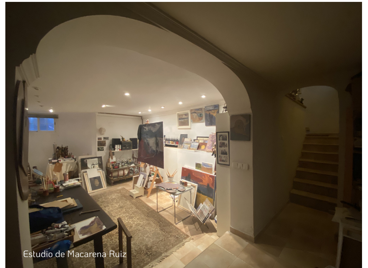
Estudio de Macarena Ruiz