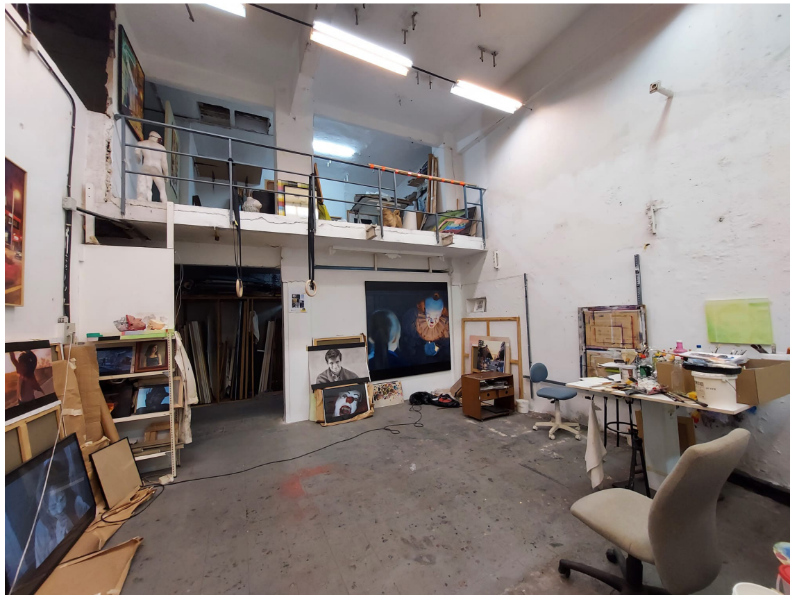
Vista del estudio de Fernando Alonso desde su parte inferior