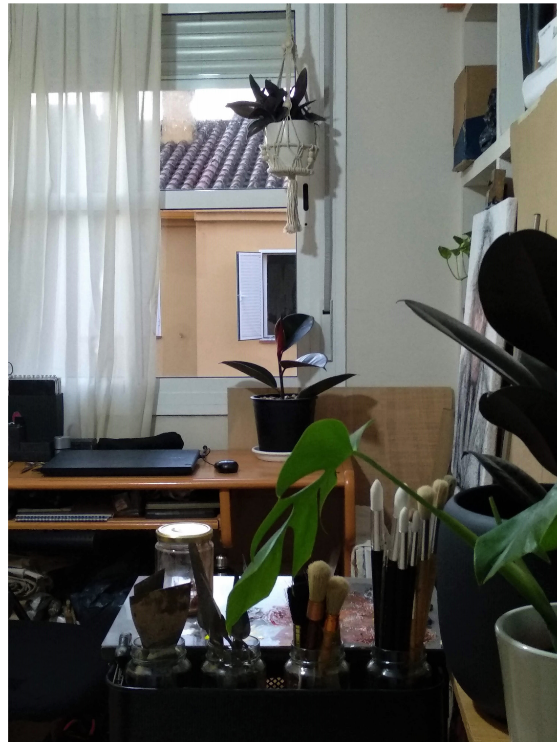
Estudio de Rafael Guerrero Peralta