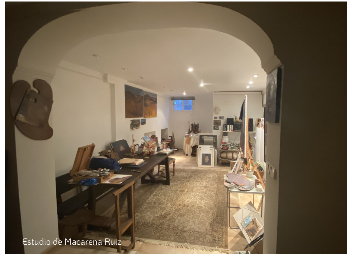
Estudio de Macarena Ruiz