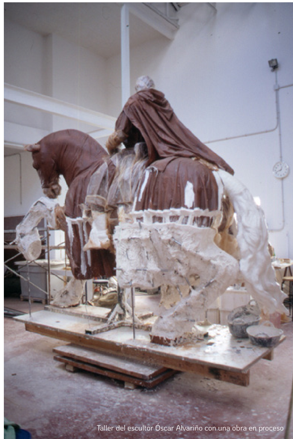
Taller del escultor Óscar Alvariño con una obra en proceso