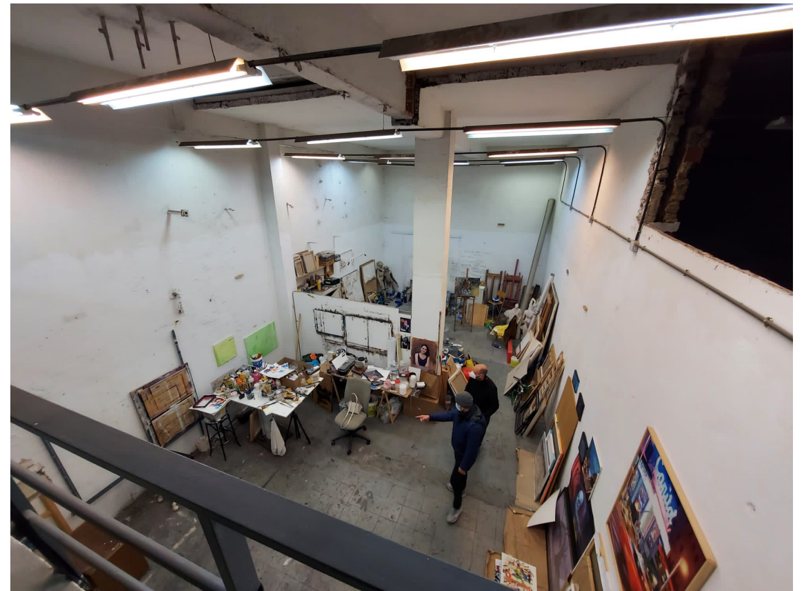
Vista del estudio de Fernando Alonso desde su parte superior