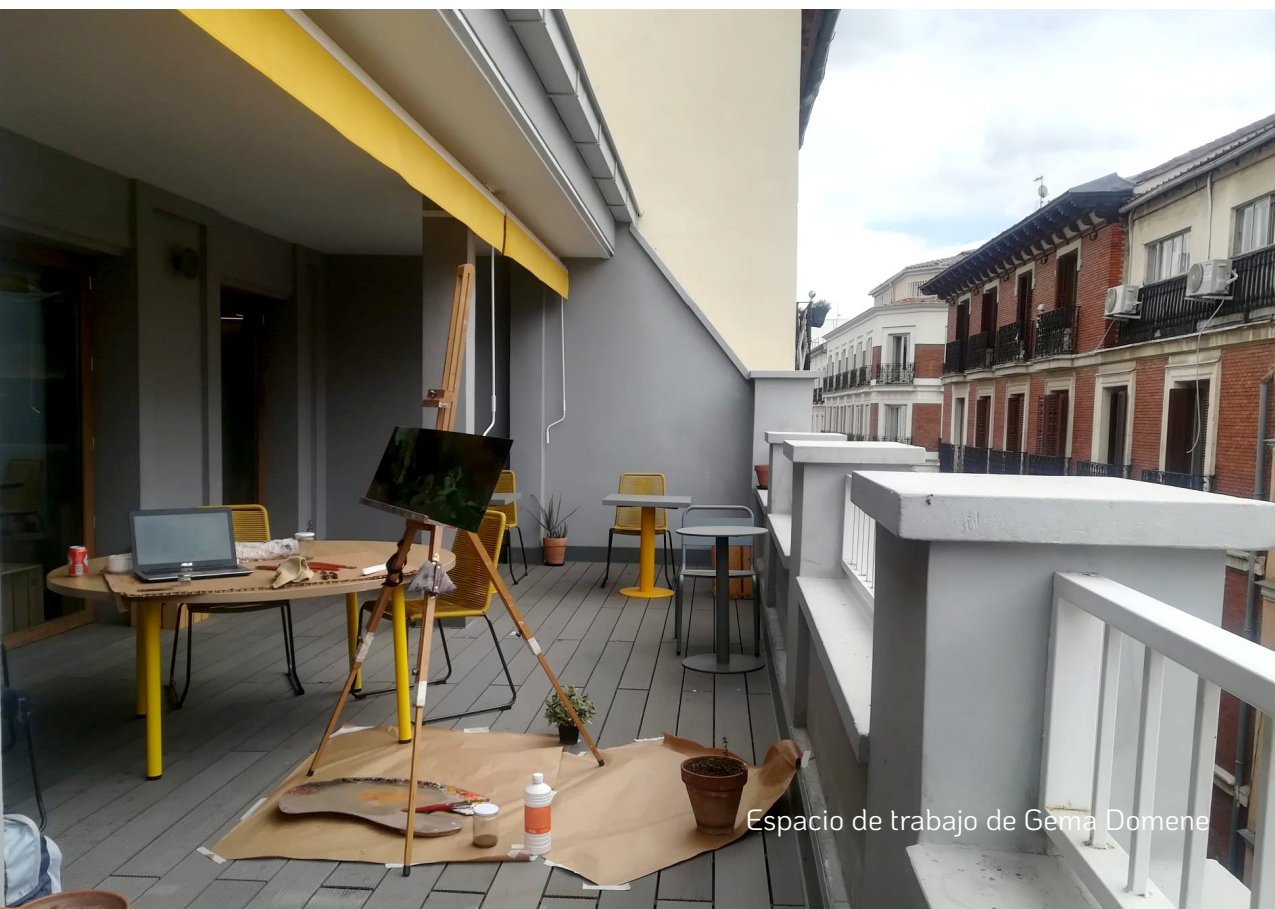
Espacio de trabajo de Gema Domene