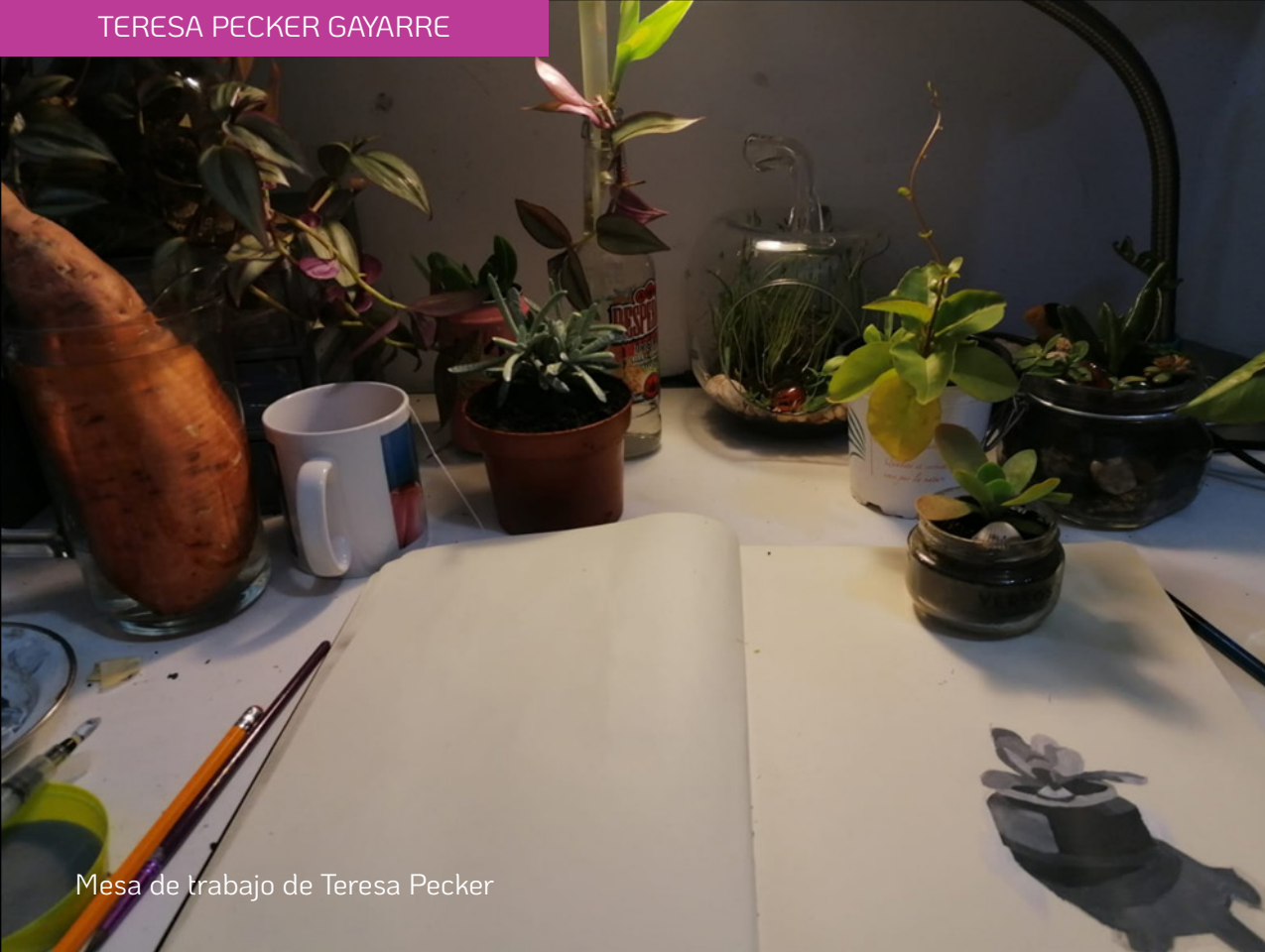
Mesa de trabajo de Teresa Pecker