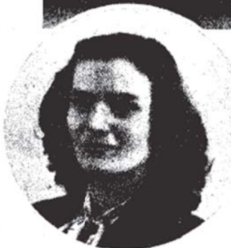
La señorita Carmen Laforet, que acaba de ser galardonada con el premio literario "Eugenio Nadal", de la revista "Destino", por su novela "Nada".