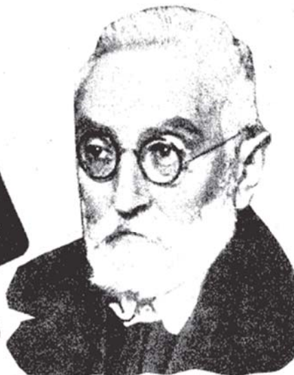
Miguel de Unamuno.