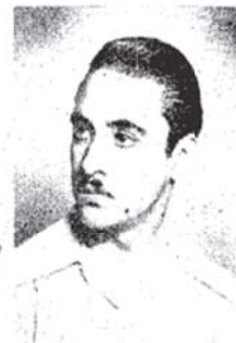
Gonzalo Fernández de la Mora.