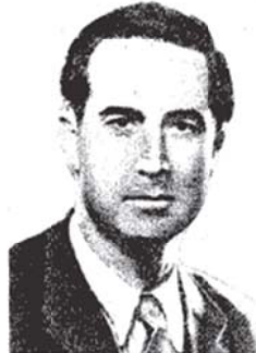
Juan Antonio de Zunzunegui.