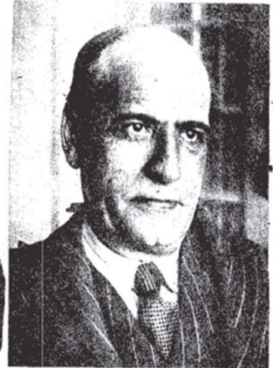
José Ortega y Gasset.