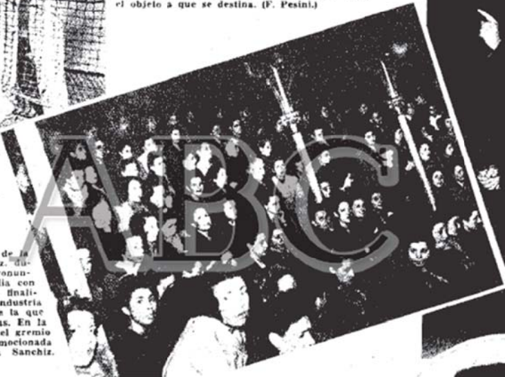
MADRID.—El artífice y orfebre de la palabra, Federico García Sanchiz, durante la maravillosa charla pronunciada en el teatro de la Comedia con tan rotundo éxito como noble finalidad: la de hacer resurgir una industria de rancio abolengo español y de la que viven miles de familias artesanas. En la galería del teatro, las obreras del gremio de Sombrerería escuchan con emocionada atención la charla de García Sanchiz.