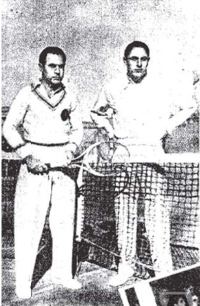
VALENCIA.—Romanoni y Bartoli, los celebres tenistas internacionales, que han hecho una magnífica demostración de su juego en esta ciudad.