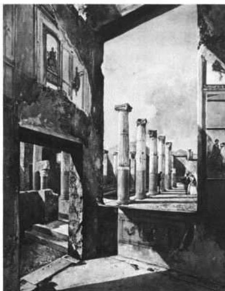
La Casa de los capiteles colorados en Pompeya (nº 60)

Es cierto, en efecto, que la mayoría de sus relativamente escasos cuadros al óleo fueron pintados en el taller, a partir de pequeños apuntes a la acuarela tomados en el campo. Gigante, sin embargo, prefiere trabajar al aire libre, pintando el paisaje "dal vero", con el fin de captar así de modo directo e instantáneo la impresión fugaz que en él suscita el motivo temático, según la variable circunstancia de la luz y los valores atmosféricos. Para ello le es de gran utilidad la técnica de la acuarela en pequeñas o medianas hojas de papel fácilmente transportables y manipulables. Por lo demás, buscando hacer más intensos y dramáticos los efectos del esquema lumínico en las suaves apariencias de la acuarela,