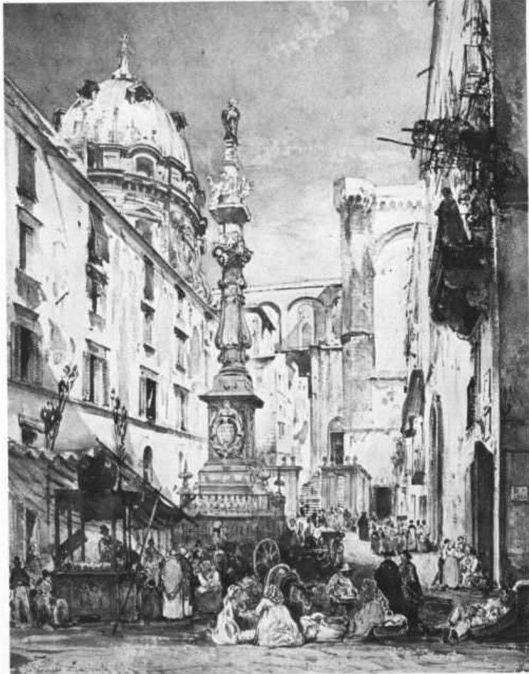
La aguja de San Genaro (nº 51)