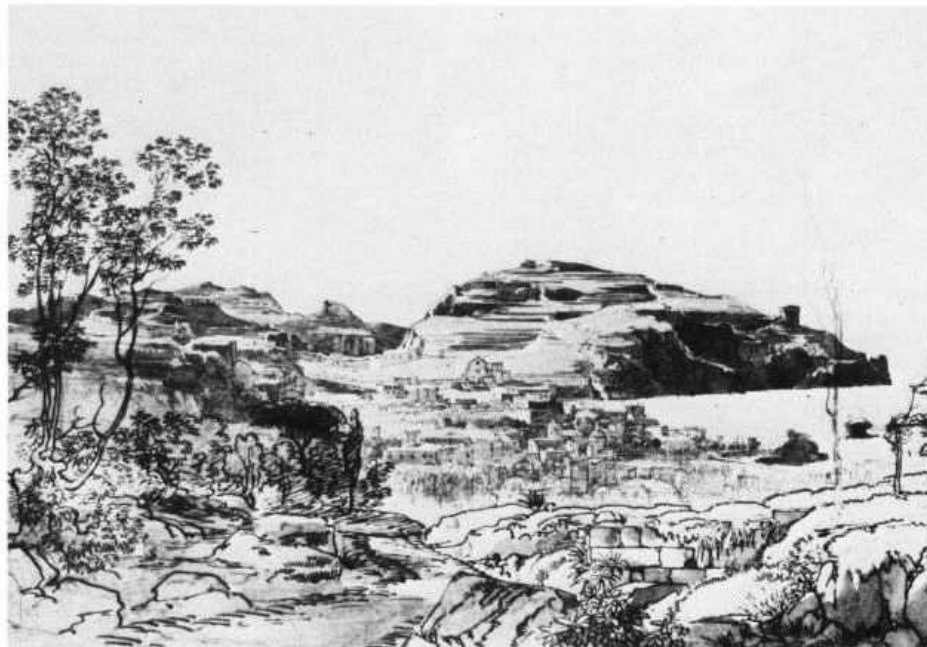
Vista de Ischia (n° 46)