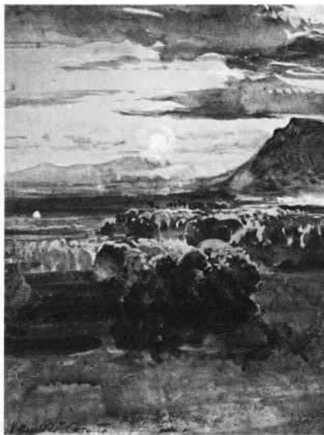
Campiña de Caserta (n.º 71)

Innecesario es decir que estas investigaciones atmosféricas y cromáticas de su último estilo cristalizan el más valioso aporte de Giacinto Gigante, hasta situarlo de pleno derecho en un puesto de avanzada en las vanguardias artísticas del segundo tercio del siglo XIX. Con semejantes resultados Gigante se encamina por la misma senda y en la misma línea de innovaciones técnicas y temáticas que algu-