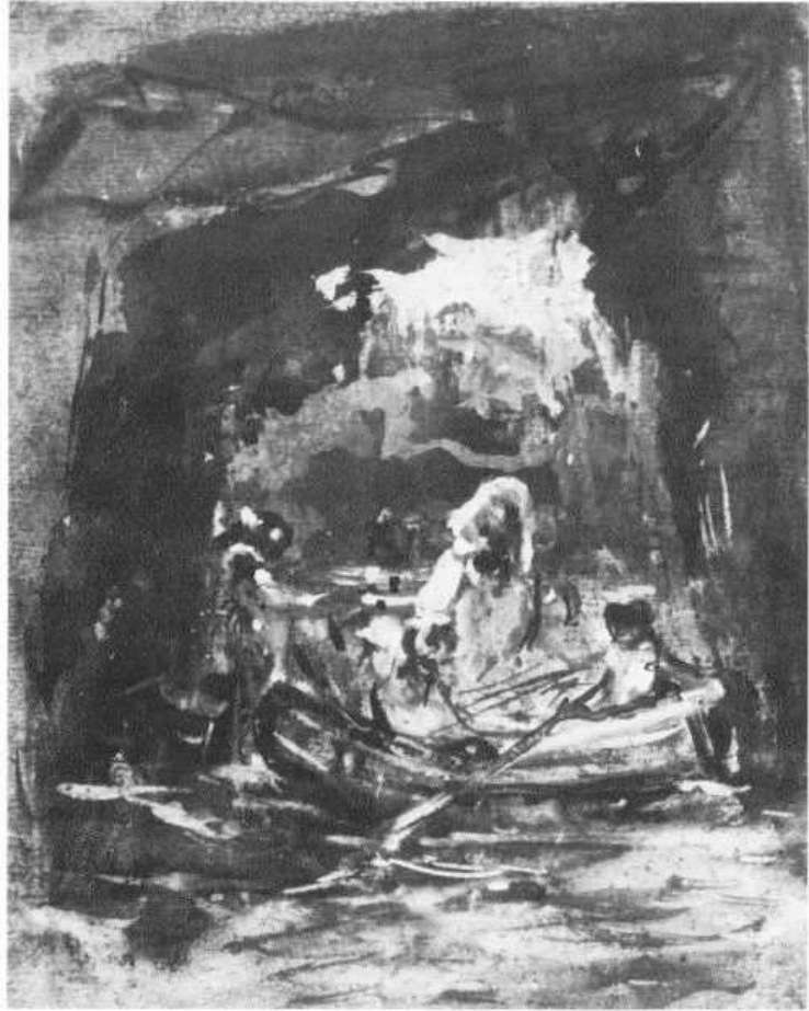
Barca bajo las rocas (nº 87)