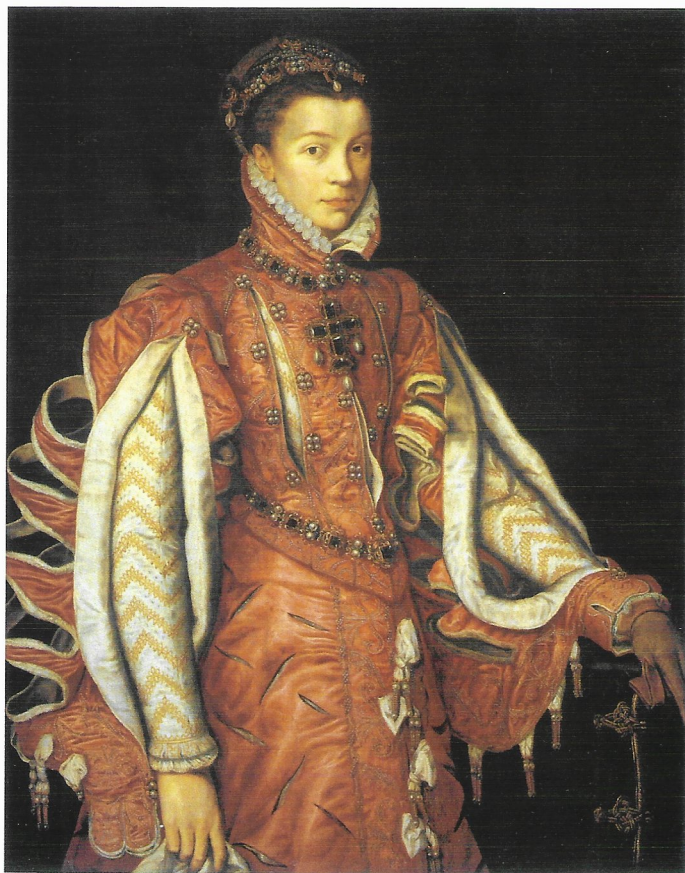
Fig. 2. Antonio Moro, Isabel de Valois , c.1560, Colección Várez Fisa.

Con el mismo vestido aparece también representada de espaldas en otro cuadro titulado Banquete de los monarcas realizado años después de su muerte, en 1596, por un seguidor de Alonso Sánchez Coello.