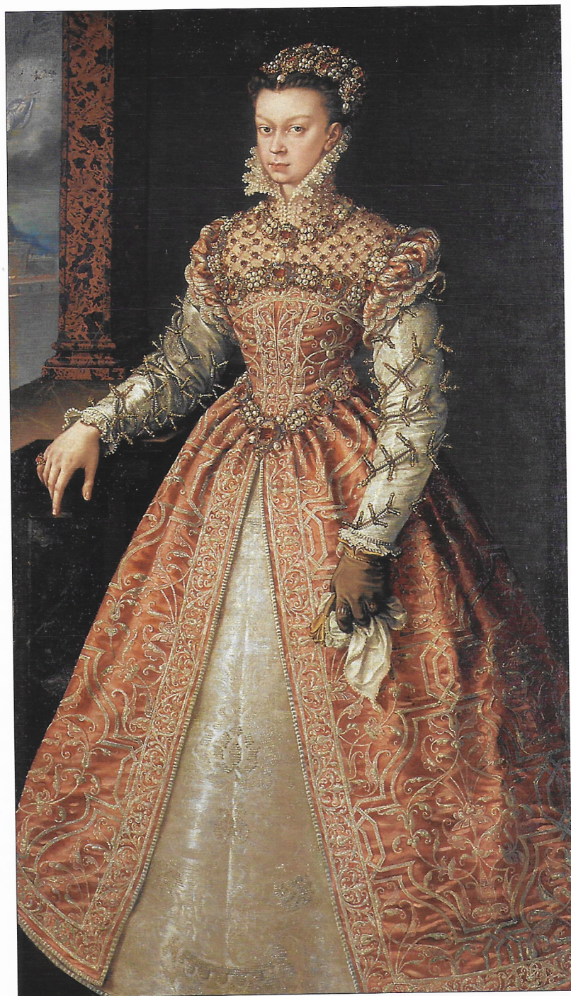
Fig. 1. Alonso Sánchez Coello, Isabel de Valois , Kunsthistorisches Museum, Viena.