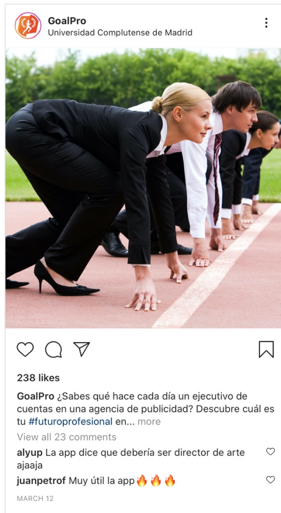
Figura 1. Adaptación del contenido de la app a Instagram. Elaboración propia.

ofreciendo consejos a los estudiantes sobre cómo especializarse en el perfil profesional que ha recomendado la app y sobre hacia dónde evoluciona ese perfil profesional concreto, abordando aspectos como las tareas diarias de ese perfil, las condiciones laborales o las perspectivas de desarrollo de la carrera profesional.