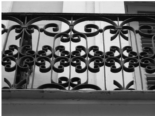
Figura 14 Edificio de vivienda colectiva en la C/ Villalar 4-6 de Madrid, 1876. Arquitecto Marqués de Cubas