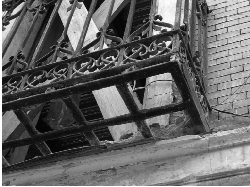
Figura 3 Edificio de vivienda colectiva en la C/ Factor 3 de Madrid