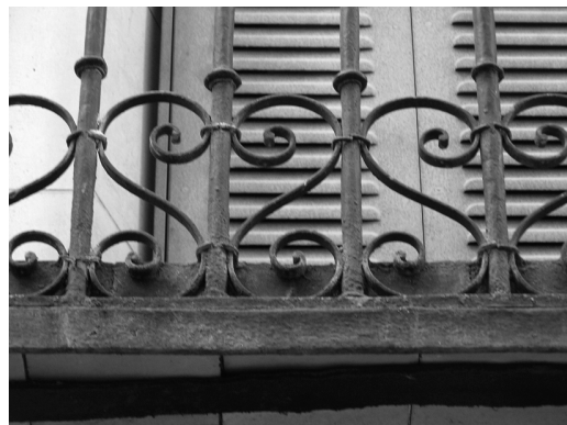
Figura 8 Edificio de vivienda colectiva en la C/ Unión 1 de Madrid, 1836