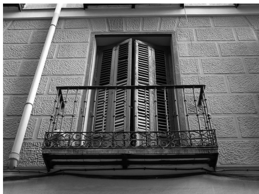
Figura 9 Edificio de vivienda colectiva en la C/ Santa Clara 3 de Madrid, 1836