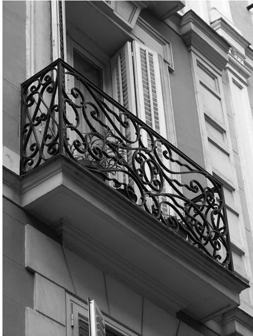
Figura 13 Edificio de vivienda colectiva en la C/ Recoletos 3 de Madrid, 1863