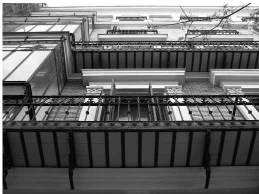
Figura 7 Edificio de vivienda colectiva en la C/ Salustiano Olozaga 4 de Madrid, 1897. Arquitecto Aníbal Álvarez Amorós

En la década de los 20 se introduce en los balcones una faja horizontal a la manera de zócalo, que o