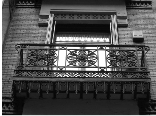
Figura 5 Edificio de vivienda colectiva en la C/ Juan de Mena 21 de Madrid, 1888. Arquitecto Marañón Gómez Acebo