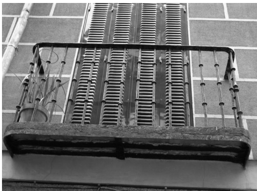
Figura 1 Edificio de vivienda colectiva en la C/ Olmo 29 de Madrid, 1799

Los extremos de la pletina superior se pueden encontrar abiertos o rajados para una mejor sujeción, empotrados en los muros y fijados con mortero. La colada de plomo sólo se utiliza para el aplomado de las verjas de cerramiento, pero no como sistema de