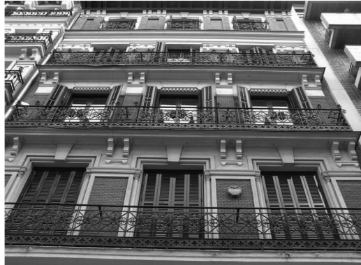
Figura 15 Edificio de vivienda colectiva en la C/ Bárbara de Braganza 2 de Madrid, 1890

En los años 80, según el orden de la calle, vemos como en un mismo edificio aparece el balcón corrido en todas las plantas que dan a una calle principal, exceptuando la entreplanta y la última, y el balcón aislado en la calle de segundo orden. El balcón corrido puede estar formado por distintos tramos que apoyan en pilastras de fábrica enfoscada. Y la decoración predominante no va a ser el embarrotado sino la sucesión o superposición de grandes formas circulares o romboidales, que forman parte de una subestructura reticular de los paños (figura 5). También se utilizan mucho piezas de fundición superpuestas y remachadas al embarrotado o a la geometría de las barras que configuran un dibujo previo (figura 5). En este momento es habitual que los zócalos estén formados por la superposición de chapas caladas, recortadas y decoradas mediante cincelado, curvado, etc. (figura 15).