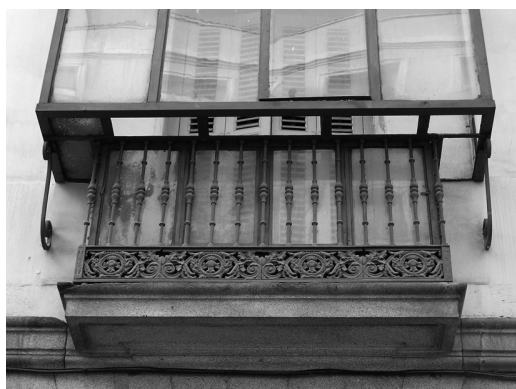
Figura 10 Edificio de vivienda colectiva en la Cuesta de Santo Domingo 3 de Madrid, 1852. Arquitecto Wenceslao Gaviña

bien puede estar constituido por piezas insertadas entre barrote y barrote o bien puede tener entidad propia apoyando sobre esta los barrotes de sección circular o cuadrada. La primera decoración descrita está sujeta por alambres (figura 8) o abrazaderas, e incluso puede existir un zócalo, superpuesto a los barrotes, sujeto con abrazaderas (figura 9).