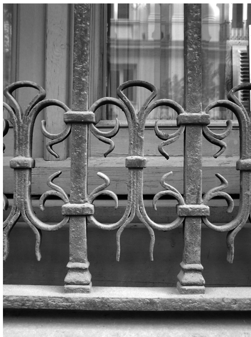
Figura 11 Edificio de vivienda colectiva en la C/ Salustiano Olozaga 8 de Madrid, 1876. Arquitecto José Segundo de Lema

Se puede decir que, como tónica general en el Madrid fernandino, a la estructura de balcón se le añaden motivos a modo de zócalo, y a partir de los años 40,