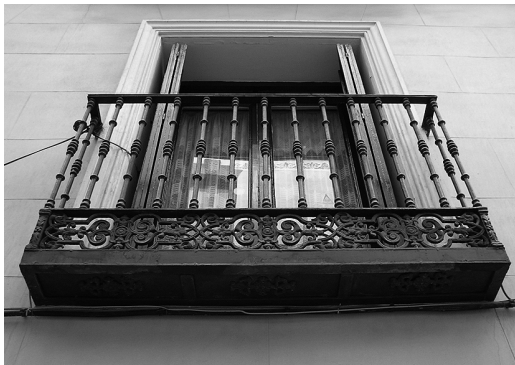
Figura 4 Edificio de vivienda colectiva en la C/ Factor 2 de Madrid

machada una decoración floral en la parte central de la misma (figura 4). Generalmente este sistema se encuentra cuando sólo hay tres subdivisiones de la base de apoyo del solado.