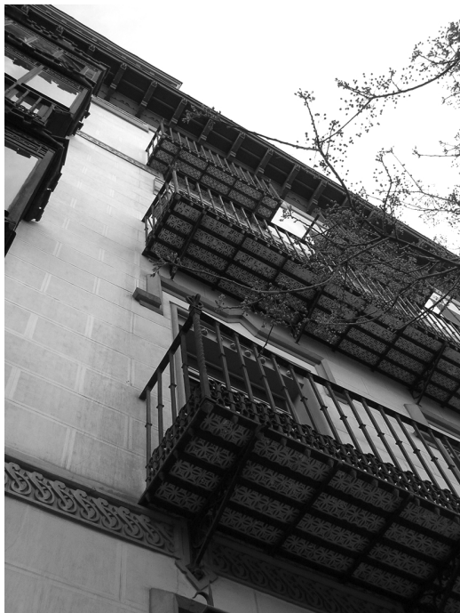
Figura 6 Edificio de vivienda colectiva en la C/ Salustiano Olozaga 8 de Madrid, 1876. Arquitecto José Segundo de Lema

machada a la pletina que se encuentra bajo el pasamanos (figura 15).