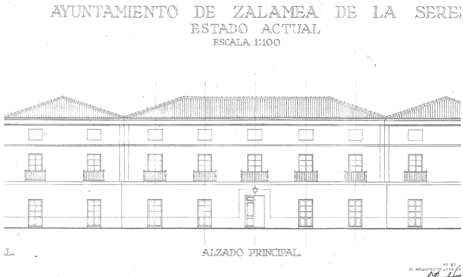
Figura 2. Plano de “Estado Actual”. Alzado principal del Ayuntamiento de Zalamea de la Serena (Badajoz)