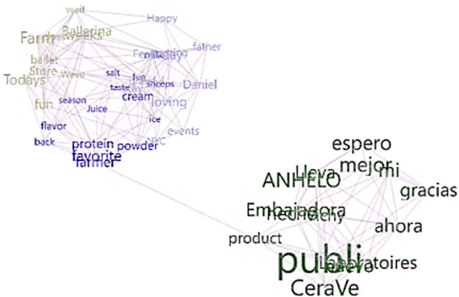
Imagen 2. Mapa 3D del discurso de Ballerina Farm y Roro. Cuanto más grande sea el concepto, más se ha empleado; cuanto más verde, mejor interacción ha generado.

ballet espero product powder Today's stay sheeps CeraVe grateful fun class Juice mi taste Ballerina events Vichy season Daniel NYC Store salt weeks publi day loving Laboratoires nuevo protein Farm ice flavor father amazing Happy favorite gracias back ANHELO Lleva cream ahora Ive wait milk farmer Embajadora hecho Weve Feeling mejor