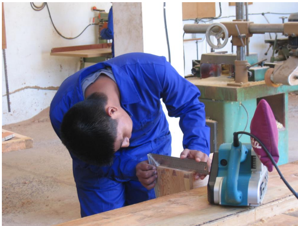
Fotografía 3. Actividad formativa de capacitación ocupacional.