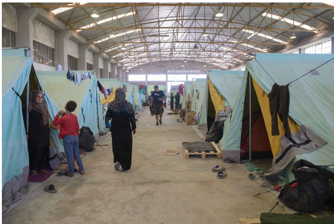
Fotografía 1. Acogida de refugiados en el puerto de El Pireo (Atenas)

Por último, queremos resaltar que, al contrario también de lo que pensamos, sólo un 10% de las personas refugiadas llega a países desarrollados. El 90% restante, la inmensa mayoría, permanecen como desplazados internos en otras zonas de sus propios países o huyen hasta países vecinos con características socio-políticas similares. De hecho, actualmente, Líbano, Jordania y Turquía son los que están acogiendo a la mayoría de los que huyen de los conflictos existentes a su alrededor.