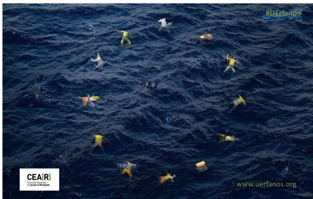
Fotografía 2. Logo de la Campaña Uerfanos de CEAR

Como vemos, existe un marco regulador internacional y estatal, y una serie de obligaciones y responsabilidades asumidas por los Estados. Queremos reafirmar en esta aproximación la idea que no se trata sólo de una cuestión humanitaria (aunque existan claras dimensiones humanitarias), que podría catalogarse como altruista, voluntaria, moralmente necesaria, o que le corresponde en exclusiva a la sociedad civil, sino de un derecho reconocido, desarrollado, de obligado cumplimiento, responsabilidad de los Estados y con mecanismos claros de aplicación.