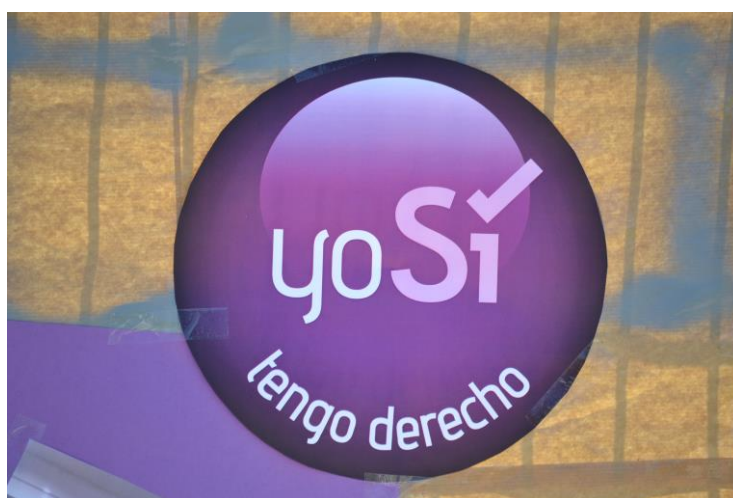
Fotografía 4. Justicia frente a piedad

En el ámbito del empleo esto supone tanto asegurar la garantía de acceso al trabajo y poder ganarse dignamente la vida como la transformación del contexto y la estructura del mercado laboral. La acogida de personas refugiadas debe suponer la introducción de la lucha contra el racismo, la xenofobia y la discriminación por origen en las políticas de gestión de las empresas y de la administración pública. Asimismo, el empoderamiento de las personas refugiadas en lo laboral y no sólo su adaptación al mercado y empleabilidad debe ser un objetivo de la acción socioeducativa. La sindicación, la incorporación a las asociaciones profesionales, la creación de redes u organizaciones, el asociacionismo de comerciantes, la presencia en puestos directivos del tejido asociativo empresarial y sindical y muchos otros aspectos deberían entrar también en la sensibilidad de los agentes sociales y sus objetivos a conseguir.