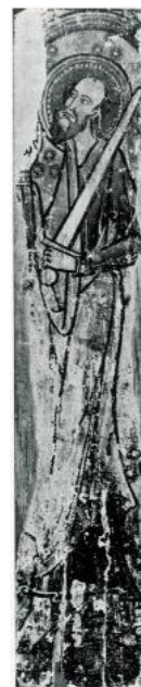
San Pablo. San Salvador de Bibils (Huesca). Siglo XII. San Pablo. Frontal de altar procedente de San Vicente de Ávila. Siglo XII.