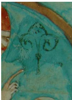
Detalle del dibujo sobre la cabeza de San Pablo

La primer carta de San Pablo a los Corintios trata también el tema de los diferentes carismas que otorga la presencia del Espíritu Santo y como todos ellos han de servir a un fin común ya que en un solo Espíritu fuimos bautizados para un solo cuerpo, ya Judíos, ya griegos, ya esclavos, ya libres; y todos hemos bebido del mismo Espíritu 20 .