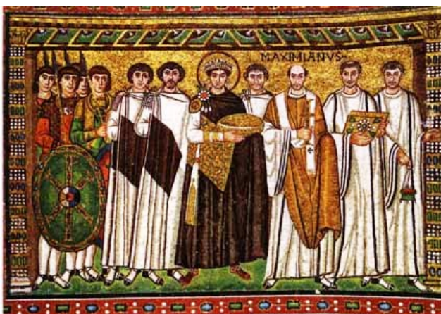
Detalle del mosaico de Justiniano y Teodora. San Vital de Rávena (547)

Por un lado, encontramos una cierta similitud formal con la decoración interior de los escudos, como se puede apreciar en estos dos ejemplos tardíos de iconografía romana como son San Vital de Rávena (547) o la Villa de la Olmeda en Palencia (Siglo IV d.C.) .