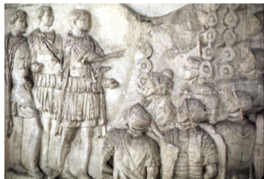
Detalles de la Columna Trajana. 118-113 d. C. Foro Romano.