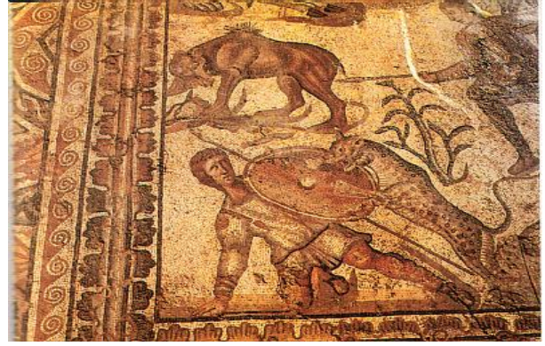
Detalle del mosaico de la cacería. Villa romana de La Olmeda. Siglo IV d.C.

Sin duda la mayor similitud la encontramos en los estandartes de las legiones romanas, símbolo distintivo y de prestigio con gran valor en el ámbito militar romano, pues su pérdida en la batalla suponía la deshonra de quienes la defendían. Valgan como ejemplo estos detalles de la Columna Trajana.