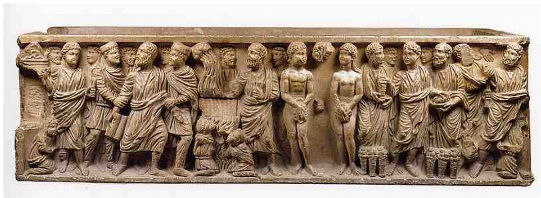
Sarcófago de San Justo de la Vega. Siglo IV. Museo Arqueológico Nacional

También encontramos cierto parecido con las fíbulas que recogen la túnica del soldado que prende a San Pedro por su izquierda en el sarcófago paleocristiano de San Justo de la Vega (S. IV Museo Arqueológico Nacional). El broche aparece rematado por tres bolitas que recuerdan notablemente a las decoraciones aquí presentadas.