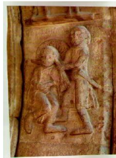
Decapitación de San Pablo. Arquivolta de la portada. Monasterio de Sta. María de Ripoll.

Tras su conversión hacia el año 35 en el camino de Jerusalén a Damasco, Pablo, el pequeño , comienza una larga y fructífera labor de predicación que le lleva por tierras de Damasco, Jerusalén, Chipre, Antioquía, Anatolia, Tesalia, Atenas y Éfeso hasta llegar finalmente a Roma donde, según Tertuliano, padece martirio junto a San Pedro, aunque por ser ciudadano romano obtuvo el privilegio de ser decapitado en lugar de sufrir la crucifixión.