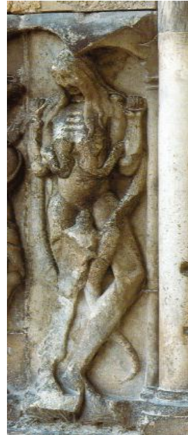
Lujuria. Portada sur de Saint-Pierre de Moissac

La primer carta de San Pablo a los Corintios trata también el tema de los diferentes carismas que otorga la presencia del Espíritu Santo y como todos ellos han de servir a un fin común ya que en un solo Espíritu fuimos bautizados para un solo cuerpo, ya Judíos, ya griegos, ya esclavos, ya libres; y todos hemos bebido del mismo Espíritu 20 .