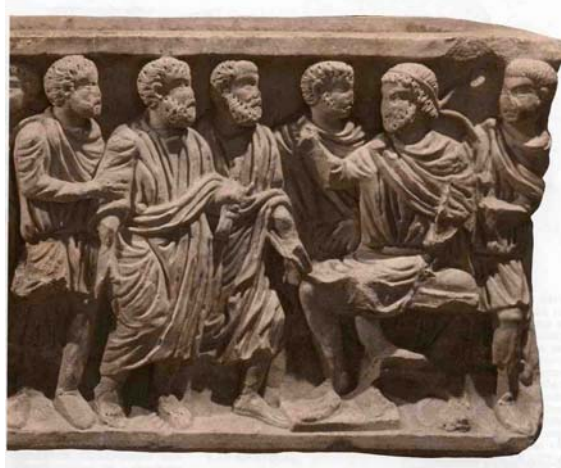
Detalle de San Pedro y San Pablo ante Nerón. Sarcófago de Berja. Siglo IV. Museo Arqueológico Nacional

Según Réau, la espada no aparece como atributo del santo hasta el siglo XIII para equipararla a las llaves de San Pedro. Ferrando Roig retrasa su aparición a finales de ese siglo, excepcionalmente substituida por un cuchillo, para representar tanto su martirio como el estilo tajante de sus epístolas 5 . Existen sin embargo, algunas piezas que parecen confirmar una aparición anterior a esta fecha.