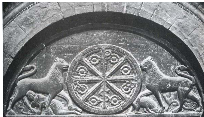
Tímpano de Jaca

No se puede descartar que se trate de un animal que muerde la letra, tal y como se verá en otras iniciales, aunque su boca no muestra claramente la posición adecuada. Si fuese por tanto un animal negativo, el que aparezca a los pies del Salvador representaría la victoria de Cristo sobre el mal, siguiendo el texto del Salmo 90 13 como vemos en numerosas representaciones como, por ejemplo, el tímpano de Jaca.