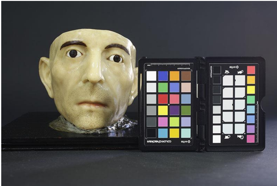
Ilustración 5. Toma previa con carta de color.