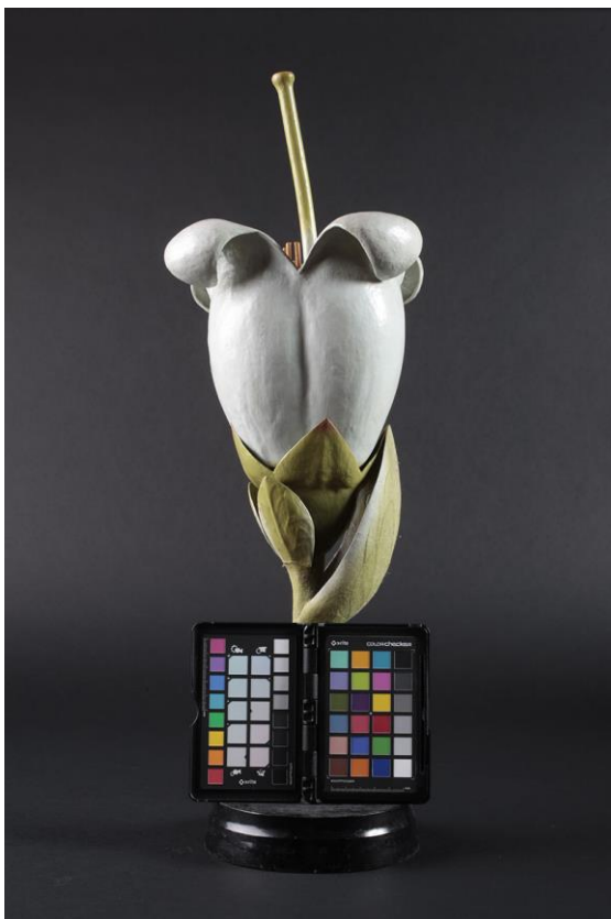
Ilustración 4. Toma previa con carta de color.