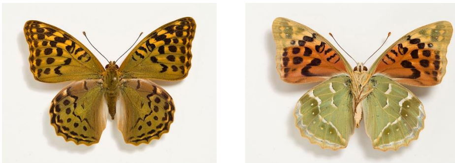
Ilustración 6. Toma dorsal y ventral después de la calibración de cámara.