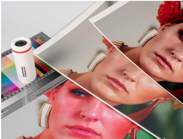
Ilustración 3. Pruebas de color con diferentes soportes.