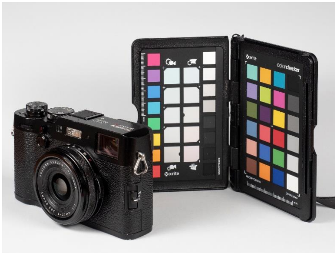
Ilustración 1. Cámara y carta de colores empleada

Imágenes de algunas de las sesiones y resultados obtenidos.