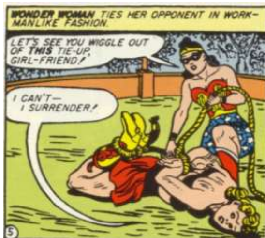
Figura 2: El Látigo de la Verdad genera una gran polémica Fuente: Moulton Marston, 1942.