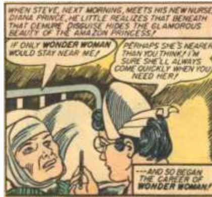
Figura 3: Wonder Woman representa la ética del cuidado con Steve Trevor Fuente(s): Moulton Marston, 1942.

Wonder Woman se presenta ante la Tierra de los Hombres como una mujer fuerte, cuyas convicciones determinan unas actuaciones en un mundo dominado por la masculinidad, aglutinadora a su vez de una combinación de dominación sexual y crianza (DiPaolo 2007, 152-153). En esa combinación se articula un modelo de defensa y protección del hombre que surge desde el inicio de su relación con Steve Trevor, mientras que trata de romper las ligaduras propias del sistema patriarcal dominante.