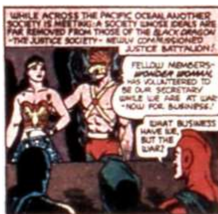
Figura 4: Wonder Woman se convierte en secretaria de la Liga de la Justicia Fuente(s): Fox y Peter, 1942.

cómo se sucedieron diferentes retrocesos en la perspectiva feminista en sus historias (McCausland 2017, 77-78).