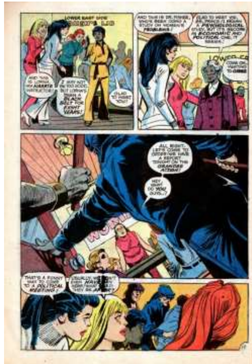
Figura 5: Diana en el Women's Lib Group Fuente: Delany, Giordano y O'Neil, 1972.

En 1963 Betty Friedan publica su Mística de la feminidad , apenas tres años antes de que se funde la Organización Nacional para las Mujeres, punta de lanza del Movimiento por la Liberación de las Mujeres, nacido en 1969 de la mano de Ellen Willis y Shulamith Firestone. El manifiesto de Firestone, The Dialectic of Sex: The Case for Feminist Revolution , supone una revolución ideológica y Wonder Woman se convierte en partícipe de la misma, cuando en 1970 aparece ya en la portada del cómic It Aint Me Babe , lanzado por el colectivo de prensa del Movimiento de Liberación en Berkeley. Dos años después se reproduciría esta situación en la portada de la revista Ms. , cuando ésta se convirtió en una publicación regular (Lepore 2019, 283-285). La revista Ms. Llegó a ser una de las revistas de mayor trascendencia en el movimiento feminista en Estados Unidos, alcanzado las 400.000 lectoras (Ergas 2000, 596). Esta revista nace en 1971 como un espacio de debate y teorización de la categoría de “cultura feminista”, a partir de Jane Alpert, quien presenta allí en 1973 la cuestión del derecho a la maternidad.