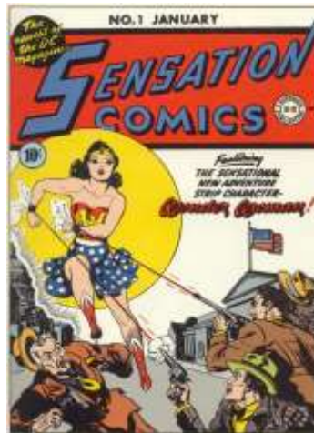
Figura 1: Primera aparición de Wonder Woman Fuente: Moulton Marston, 1942.

El personaje de Wonder Woman nace con el nombre de Diana en Isla Paraíso (denominada a partir de los años ochenta como Temiscira, nombre también utilizado en su adaptación al cine en 2017), capital del reino de las amazonas. Es hija de la reina de este país ubicado en apariencia en algún lugar del Triángulo de las Bermudas, al margen de lo que se denomina en origen como Tierra de los Hombres, para convertirse a posteriori en el Mundo Patriarcal. Esta Isla Paraíso se presenta como un mundo idílico en el que los únicos males que lo atormentan son provocados por figuras masculinas (una perspectiva que se verá reforzada en las historias de los ochenta cuando se narre el drama vivido entre Hipólita y Zeus, que trae como consecuencia el propio abandono de estas tierras por parte de un grupo de amazonas).