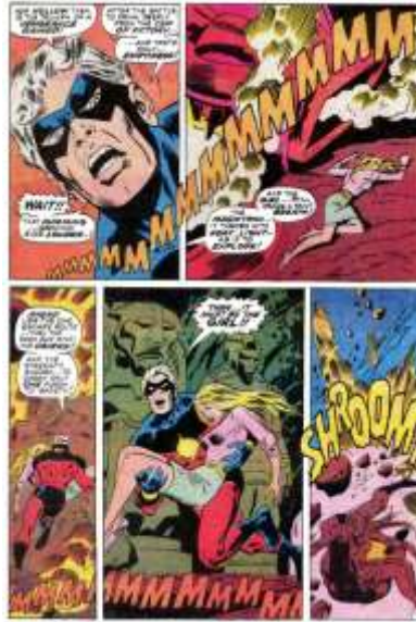
Figura 9: Capitán Marvel #18 Fuente(s): Buscema, Kane, Lee y Thoma, 1969.

En la década de los setenta va a participar de una nueva política de Marvel, por la cual no sólo sus cómics se convierten en un muestrario de lo acontecido en las calles, sino que surge una corriente interna de empoderamiento de sus personajes femeninos. Así sucede con Spider-Woman, con She-Hulk y, por supuesto, con la propia Ms. Marvel. Esta última es recuperada en 1977 en Ms. Marvel #1 (Conway y Buscema 1977), donde posee diferentes habilidades y súper poderes como la capacidad de volar, súper fuerza o un sentido adicional precognitivo. Nace con un traje hiper ceñido, que será rediseñado por Dave Cockrum para el número #20 (1978), con el que termina siendo identificada históricamente. Se convierte así en la primera protagonista femenina del Universo Marvel (Goodman 2019).