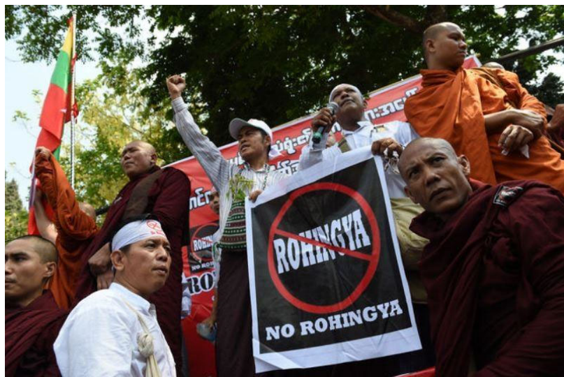
FIGURA 1. Monjes budistas con carteles antirohingyas.