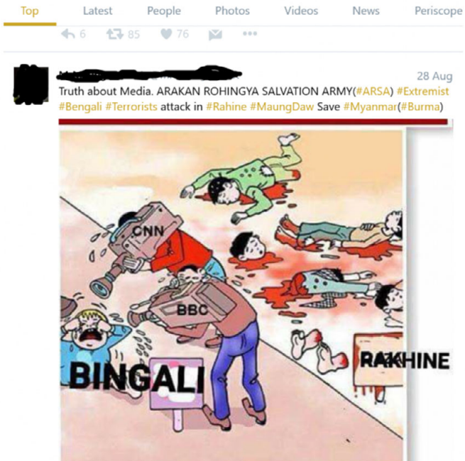
FIGURA 6. Otra caricatura contra la visión occidental de la crisis rohingya.