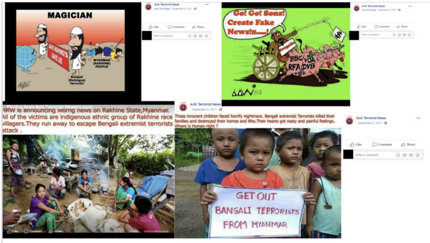
FIGURA 7. Mensajes de odio contra los rohingyas.