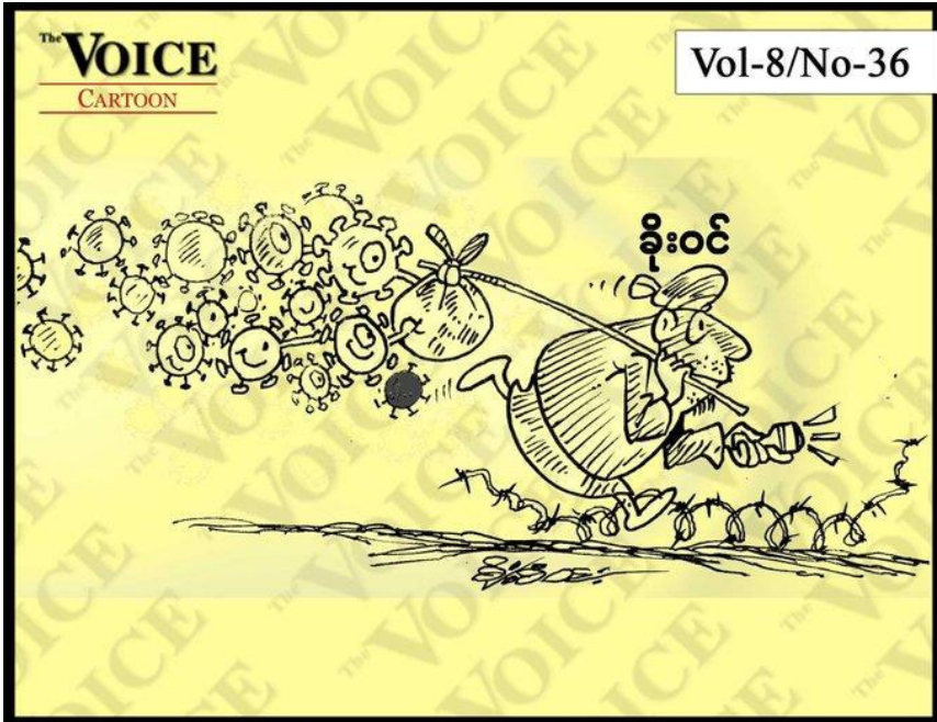
FIGURA 4. Teorías conspiratorias sobre la “Corona Jihad”.