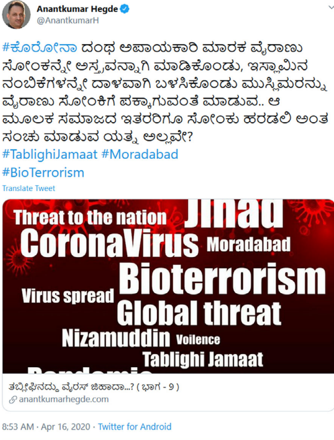
FIGURA 3. Teorías conspiratorias de ultranacionalistas indios contra los rohingyas.

justificar la posición gubernamental a través de “hechos deleznable” que justifiquen la exclusión de los rohingyas de la ciudadanía (Cordero, 2019).