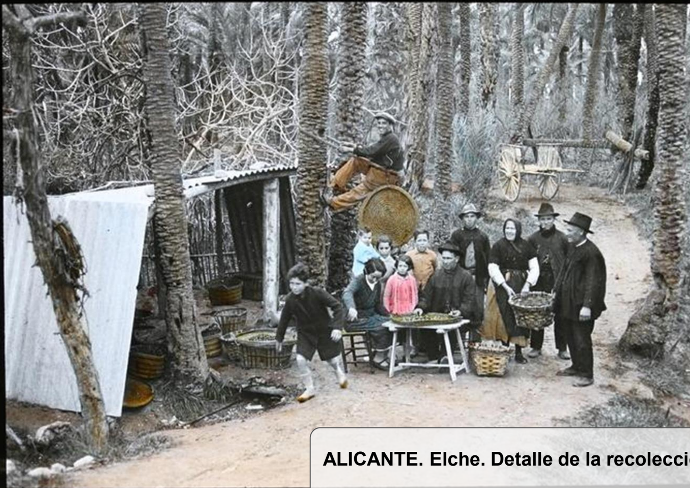
ALICANTE. Elche. Detalle de la recolección de dátiles