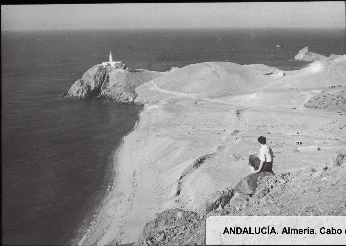
ANDALUCÍA. Almería. Cabo de Gata