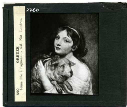
Archivo Fotográfico Lafuente Ferrari (dataset)

Los metadatos de algunas colecciones de PDC se pueden consultar y descargar libremente para su uso en investigación.