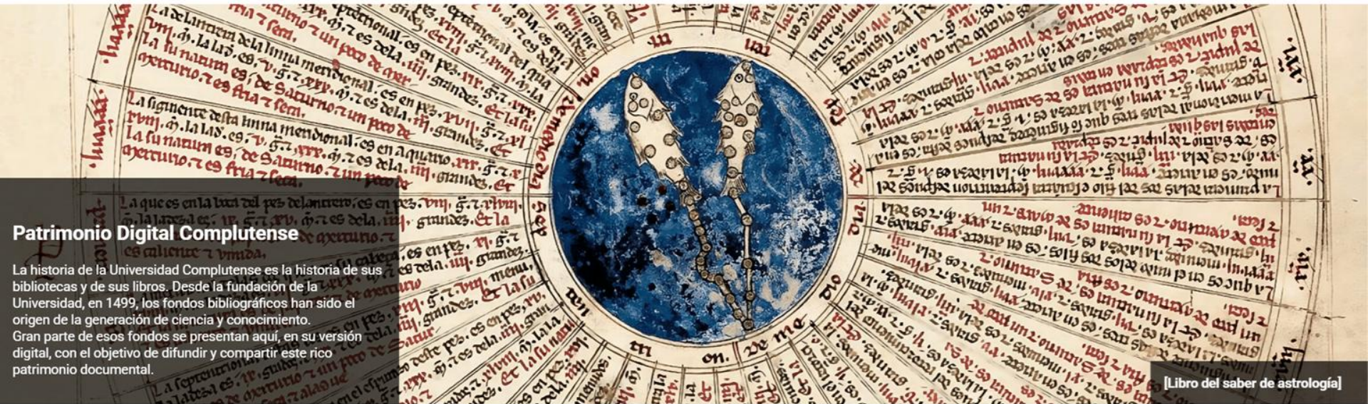
[Libro del saber de astrología]