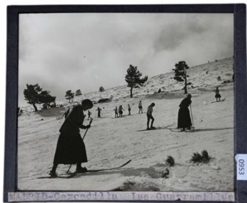
Colección Fotográfica Hernández-Pacheco (dataset)

https://hdl.handle.net/20.500.14352/132890