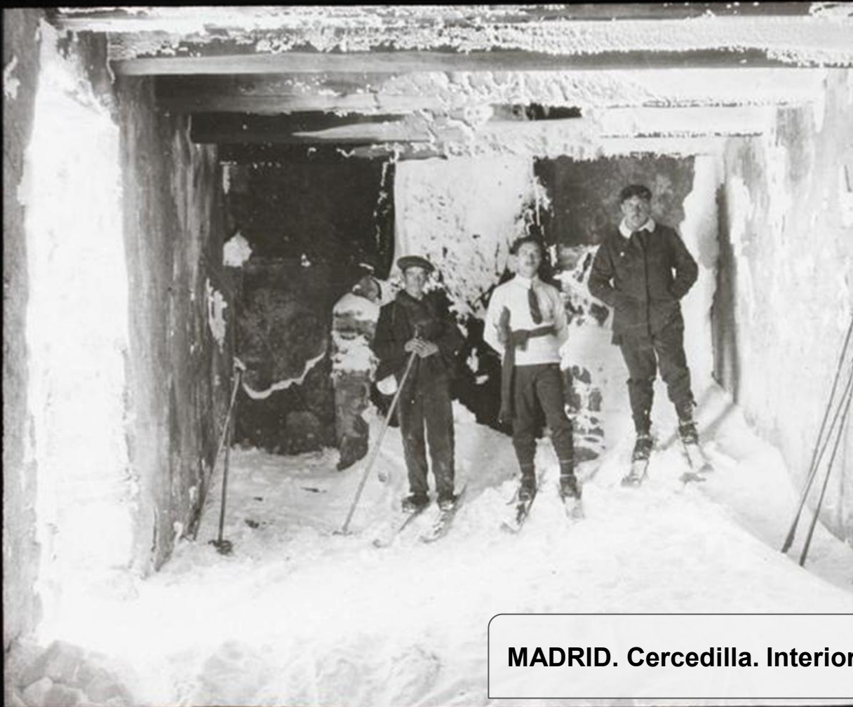
MADRID. Cercedilla. Interior de la casita del Ptº