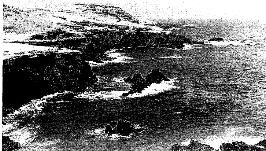
Fig. 2.—Costa del Jable de las Salinas en La Matanza. Acantilados en el Complejo Ultramáfico.

de venas, venillas e impregnaciones sílicas de gran variabilidad, que pasan a brechas perkníticas micáceas en las que intruyen las carbonatitas como diques, apófisis y venas sin continuidad morfológica, pero que se extienden en un área visible de casi un kilómetro. Petrologicamente son fundamentalmente sóvitas con las típicas estructuras reomórficas de flujo y bandeados por alternancia de tipos mineralógica y texturalmente distintos.