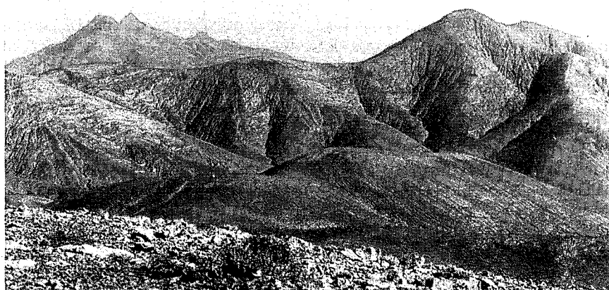
Fig. 3.—Complejo Filoniano en la zona central de Amanay. A la derecha, el Sicasumbre.

Estos complejos, en su zona de techo, allí donde no han sido erosionados, pasan ya a materiales con rasgos de diques-capas, derrames lávicos y verdaderas coladas subaéreas perdiendo sus características estructuras filonianas en paquetes de cientos de metros de extensión, subverticales y paralelos.