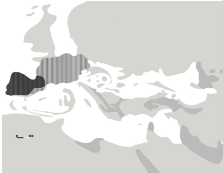
Figura 2. El género Heteroxerus se distribuye a lo largo de todo el continente europeo. En cambio, la especie H. grivensis es un endemismo ibero-occitano durante la MN5. La zona de color negro representa el área de distribución de la especie, y las trazas verticales el área de las demás especies del género. Paleogeografía de Ilyina et al. (2004), con diferente tonalidad se muestran las tierras emergidas permanentemente y las zonas inundadas durante una trasgresión marina.