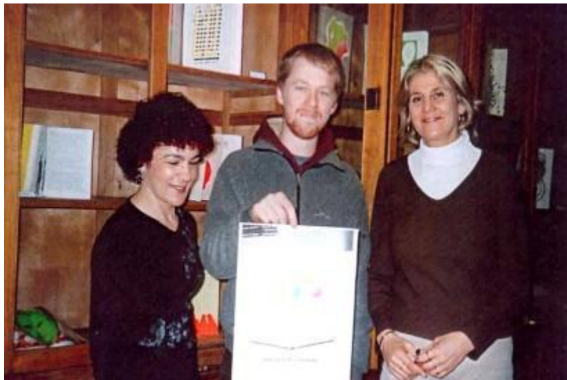
Palimpsesto: Libros intervenidos