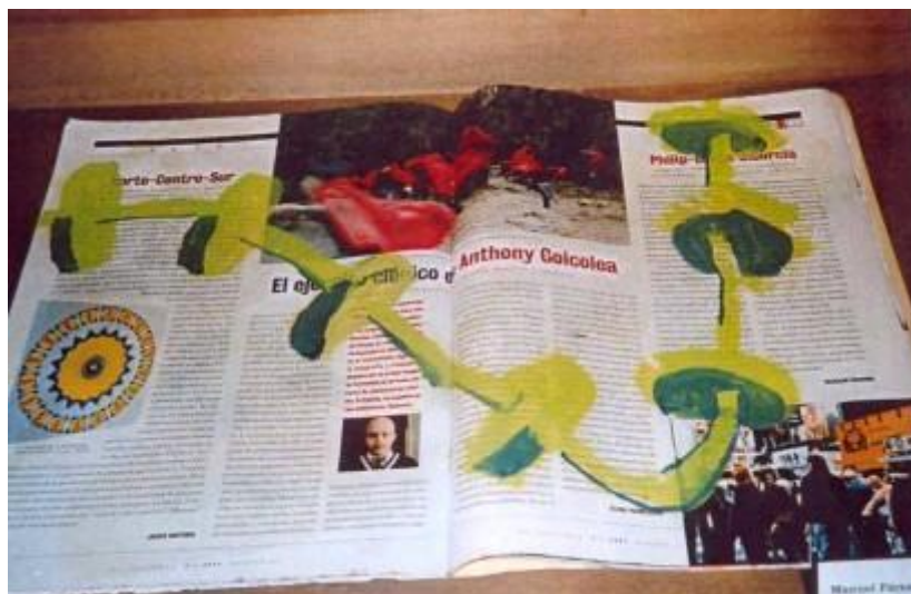
Palimpsesto: Libros intervenidos