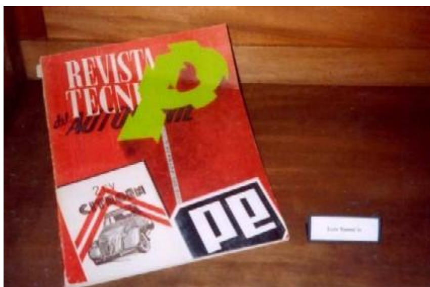
Palimpsesto: Libros intervenidos