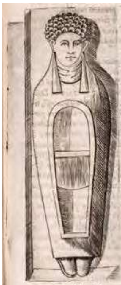
Fig. 2. Sarcófago antropoide púnico de arcilla descubierto por Abela en 1624. Abela, 1647.

Tras la muerte de Abela, ocurrida el 4 de mayo de 1655, el notario Michele Ralli ratificó la cesión de la propiedad de Tal-Kortin al Colegio de Jesuitas de Malta, según la voluntad del mismo difunto (Cecalupo,