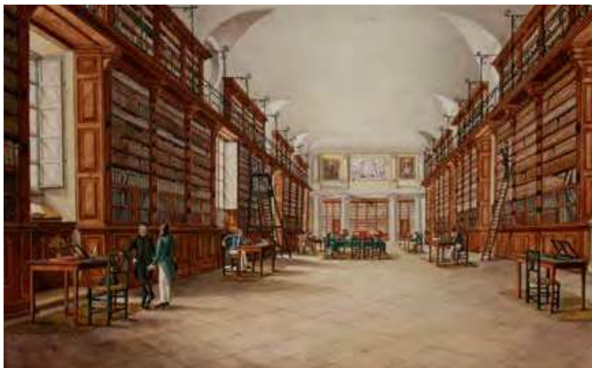
Fig. 5. Vista interior de la Biblioteca Pública en el siglo XIX. 7