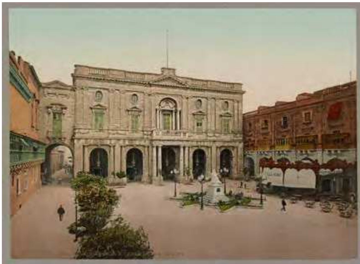
Fig. 4. Vista exterior de la Biblioteca Pública en el siglo XIX. 6