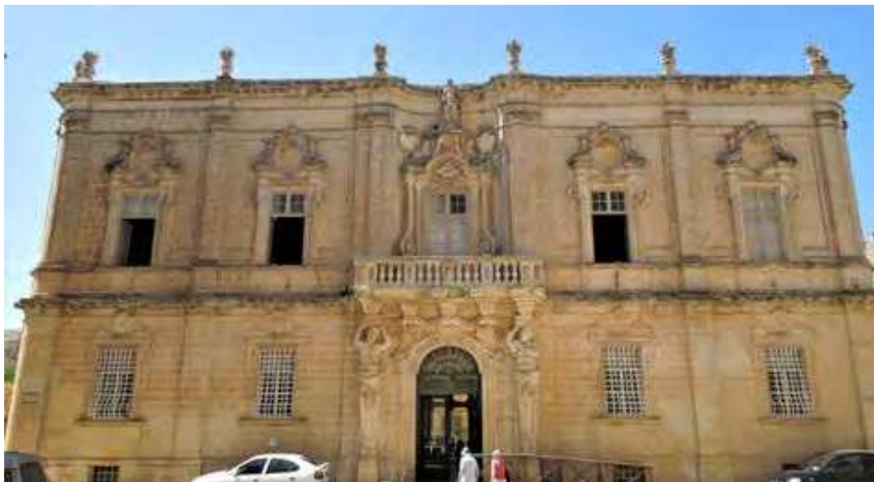
Fig. 6. El Cathedral Museum de Mdina (Malta).