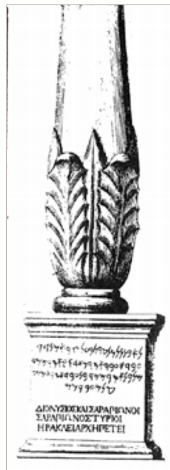
Fig. 3. Incisión de uno de los dos cipos con inscripción bilingüe. Ciantar, 1772.