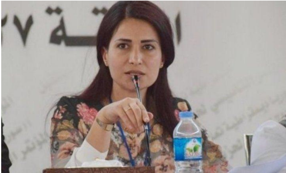
Hevrin Khalaf, política kurda y secretaria general del Partido Futuro de Siria, asesinada en octubre de 2019.