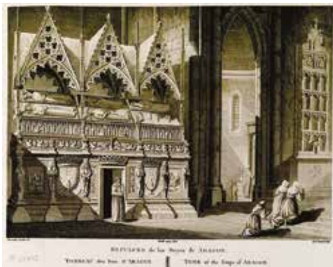
FIG. 1. Alexandre Laborde, Sepulcri dei re di Aragona presso la chiesa di Poblet , Voyage Pittoresque et Historique en Espagne, 1806, Paris, Bibliothèque de l'Institut National d'histoire de l'Art, collections Jacques Doucet.