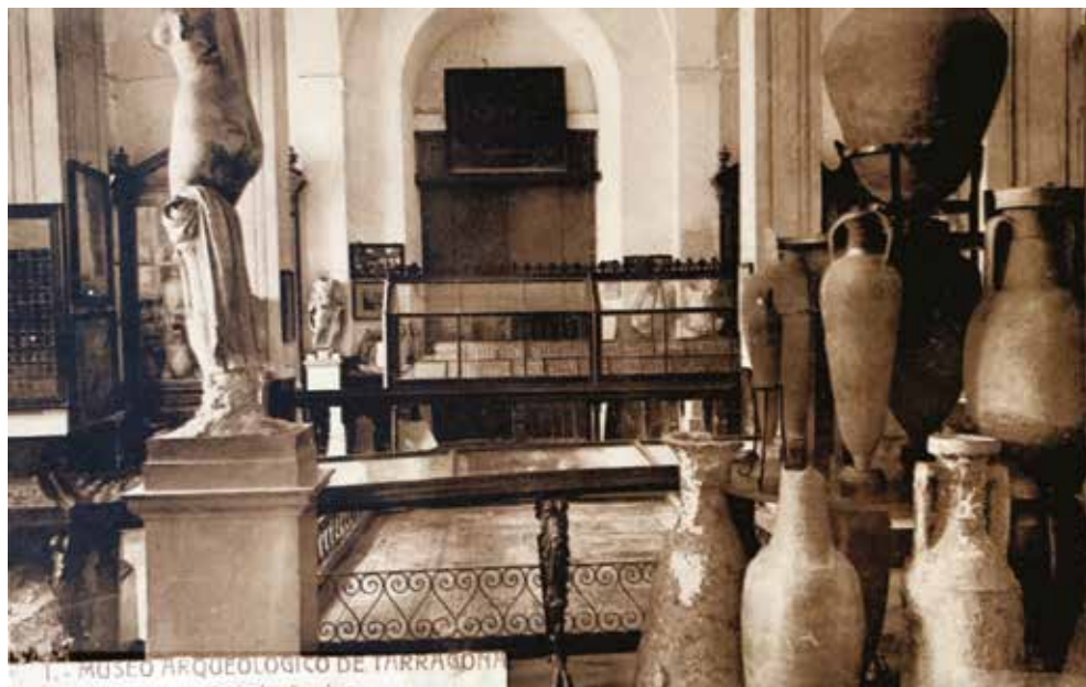
FIG. 3. Grande sala del Museo Archeologico Provinciale di Tarragona, 1890 ca., Madrid.