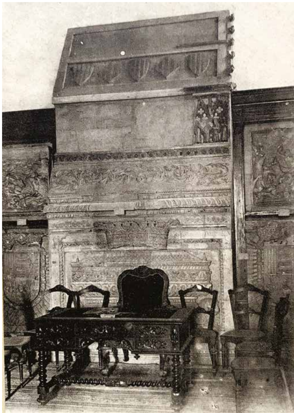
FIG. 4. Pantheon del re Jaime I presso il Museo Archeologico Provinciale di Tarragona, 1890 ca., Madrid.