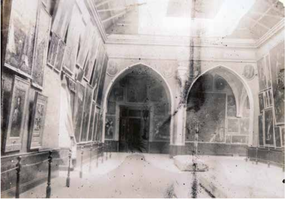
FIG. 5. Grande sala del Museo di Belle Arti di Valencia , 1900 ca., Valencia, Archivo de la Real Academia de Bellas Artes de San Carlos.

cia (lo Spagnoletto; Pedro Orrente, anche se era nato a Murcia; Juan de Juanes; ecc.), ossia ciò che si considerava la Scuola Valenciana 32 , cioè «la segunda Escuela Española de Pintura» 33 (FIG. 5). Tuttavia, in modo diverso da ciò che accadeva a Tarragona, Valencia non aveva, ancora negli anni Cinquanta, un museo di antichità, dato che i commissari si erano concentrati sulla pittura, soprattutto quella di età moderna, come componente fondativa della cultura e del passato della regione 34 .