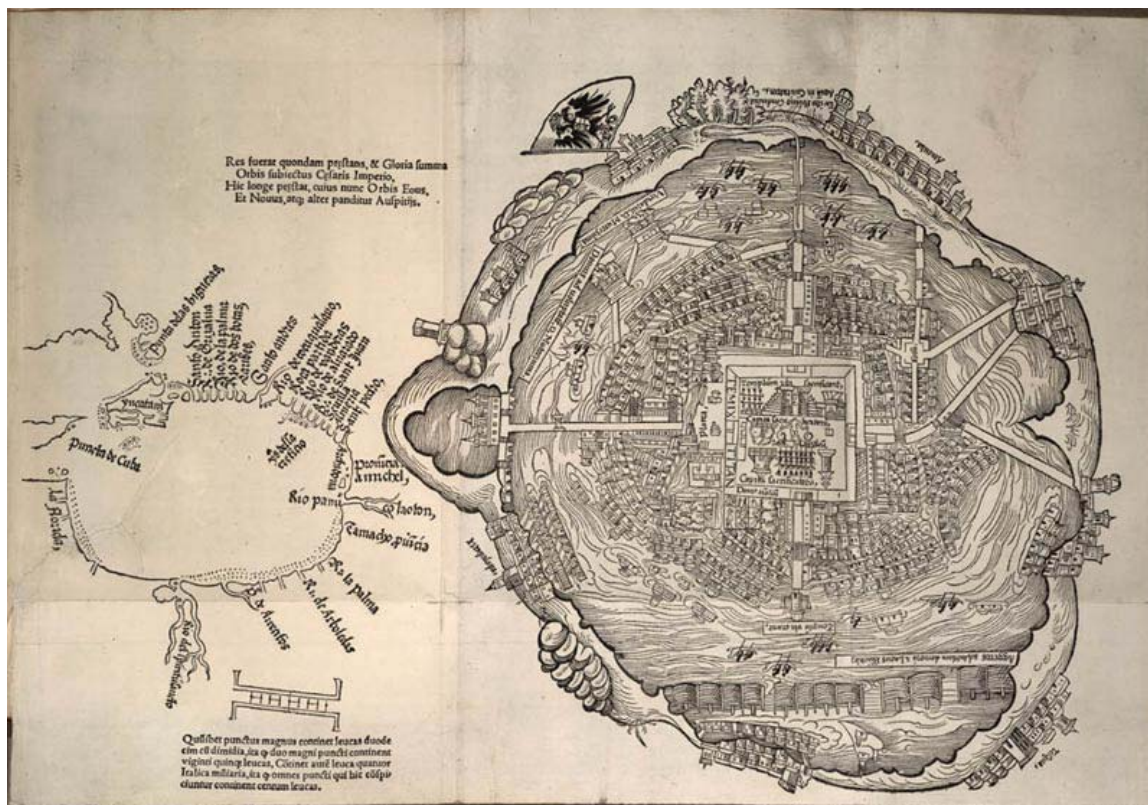
Figura 5. Mapa de Nuremberg

Una vez tornados los lugares estratégicos del mercado, el templo y los palacios de Moctezuma en lugares mnemónicos, con sus consabidas divisiones internas en calles, cámaras, aposentos, patios y jardines, Cortés procede a la construcción y depósito de las imágenes. Según la Rhetorica ad Herennium (3.35), la composición de las imágenes debía responder a las condiciones de firmeza ( firmas ), es decir, imágenes que perduren en la memoria, y fidelidad ( fideles ), para que permitan la pronta recuperación de los contenidos previamente encomendados. Para garantizar dichas cualidades, el memorioso ha de tener en cuenta los dos componentes esenciales de toda imagen: el simulacrum (la imagen per se, de naturaleza visual) y la intentio (la resonancia emotiva) (Yates 1964: 10). La emoción vinculada a cada imagen resulta sumamente significativa para garantizar su fijación y posterior recuperación porque, como se lee en los tratados mnemónicos: