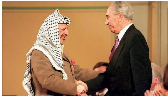
El líder palestino Yasser Arafat y el ministro de Exteriores israelí, Shimon Peres, se saludan en la ceremonia del premio Nobel de la paz en mayo de 1994

En Israel tampoco gustó a todo el mundo e incluso le costó la vida a su primer ministro. Isaac Rabin participaba en un evento bajo el lema ‘sí a la paz, no a la violencia’ poco después de la firma de la segunda parte de los acuerdos de Oslo en septiembre de 1995. “Fui hombre de armas durante 27 años. Mientras no había oportunidad para la paz, se desarrollaron múltiples guerras. Hoy estoy convencido de la oportunidad que tenemos de realizar la paz”. Sería su último discurso. Al bajar las escaleras, fue asesinado a tiros por un ultraderechista. Semanas antes, un joven israelí de 19 años presumía ante las cámaras con la chapa del Cadillac atacado de Rabin: “Hemos ido a por su coche y también iremos a por él”. Era Itamar Ben-Gvir , el ultranacionalista convertido ahora en ministro de Seguridad Nacional en el Gobierno más ultraderechista de la historia del país. Un ascenso que representa el ejemplo perfecto del fracaso de Oslo. Hoy en Israel están en el poder aquellos que querían quemar los Acuerdos de Oslo.