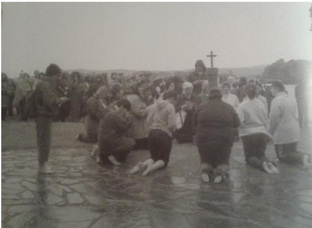
Fig.: 13 Peregrinos en penitencia durante el ejercicio de las estaciones alrededor de las camas penitenciales (siglo XXI). En Eilee Good's Palces apart: Lough Derg