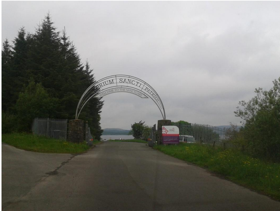
Fig. 6: Entrada a Lough Derg o Purgatorio de San Patricio