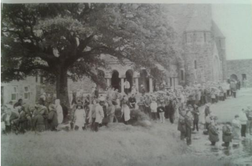
Fig.: 12 Peregrinos en penitencia durante el ejercicio de las estaciones alrededor de las camas penitenciales y fuera de la basílica (siglo XXI). En Eilee Good's Palces apart: Lough Derg