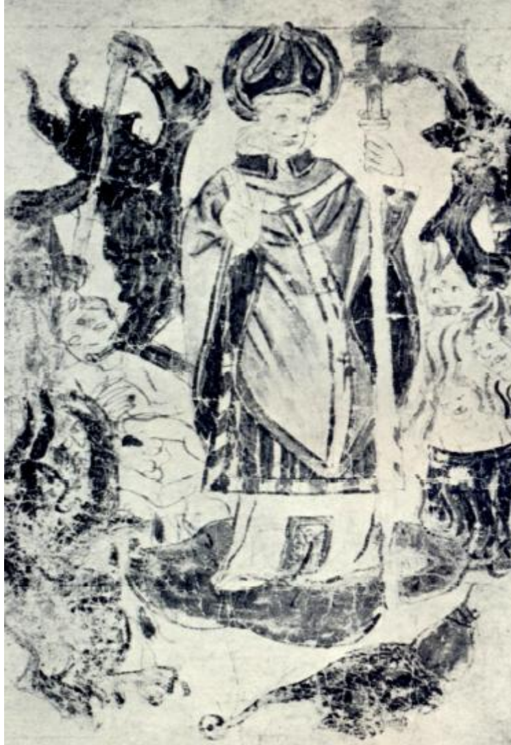
Fig. 2: St. John of Bridlington in St. Patrick's Purgatory in Shane Leslie's Saint Patrick's Purgatory .