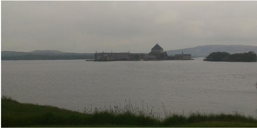
Fig. 7: Station Island