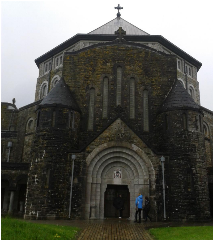
Fig. 9: La basilica