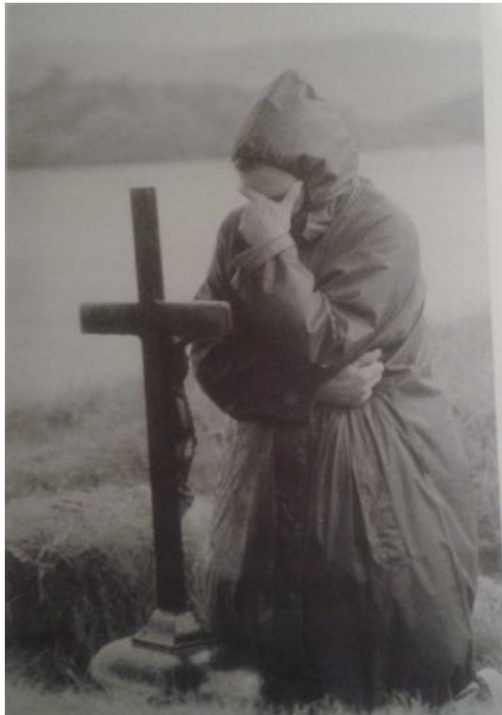
Fig. 15: Peregrino de Lough Derg (siglo XXI) En Eilee Good's Palces apart: Lough Derg