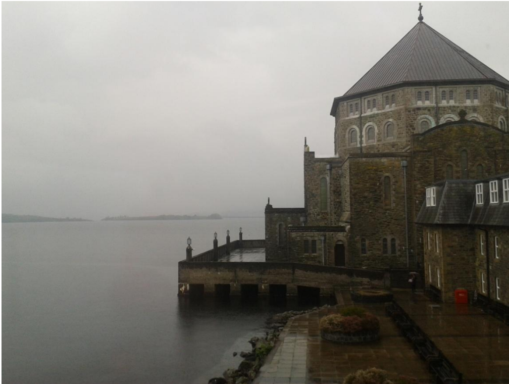
Fig. 10: Parte trasera de la basílica