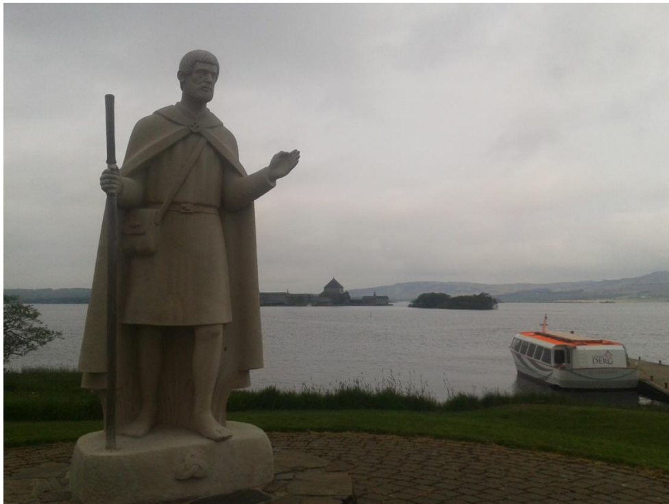
Fig. 8: Escultura al peregrino. Muelle y barco que conduce al santuario. Station Island al fondo