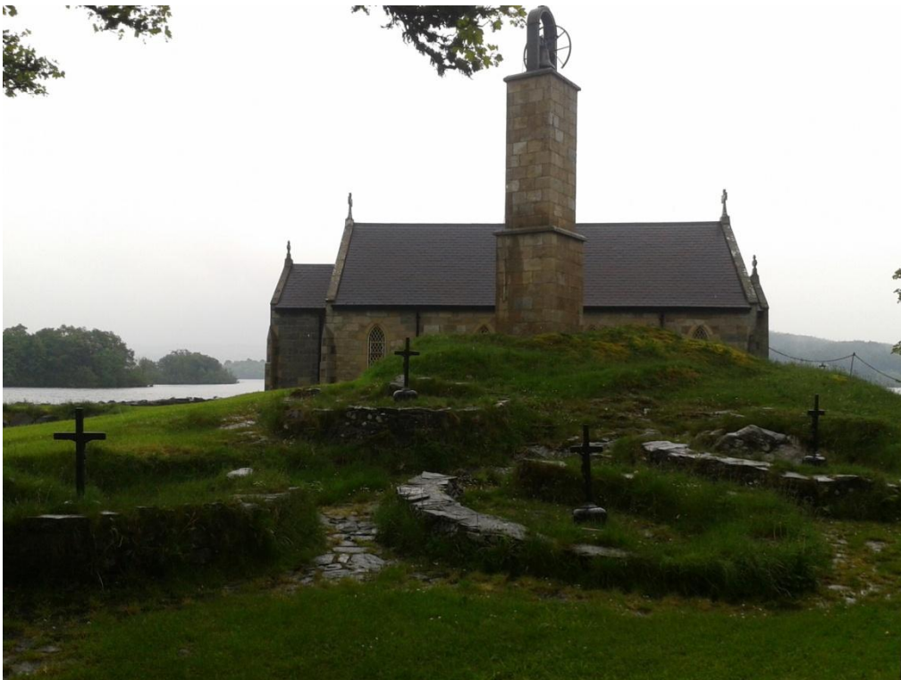
Fig. 11: Las camas penitenciales y la Iglesia de Santa María