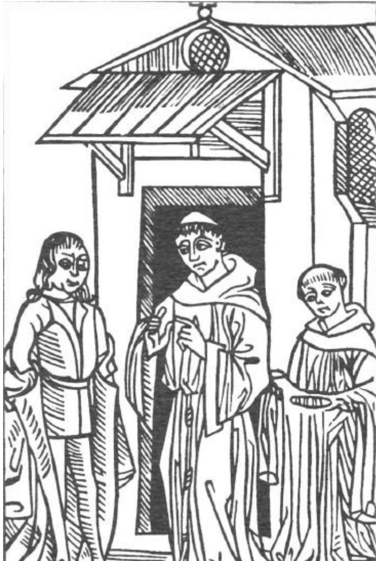
Fig. 1: The prior giving instructions to Knight Owein before entering the cave in Shane Leslie's Saint Patrick's Purgatory .