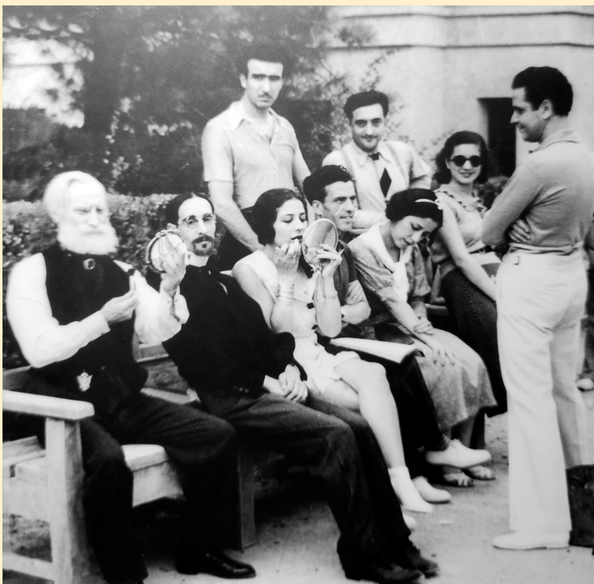
Concha Piquer en La Habana (1924). Con los miembros de su compañía (s/f).

En una época en la que la posición de la mujer estaba subordinada a la figura masculina, su actividad en la escena y tras la escena irremediadamente se enfrentaba a las normas sociales de su tiempo, consiguiendo ser independiente en lo económico y con libertad en el aspecto personal. Mujer valiente, mantuvo en pie hasta 1958 su compañía, con producciones internacionales que requerían un numeroso tránsito de personas y de enseres, para los que no escatimó presupuesto.