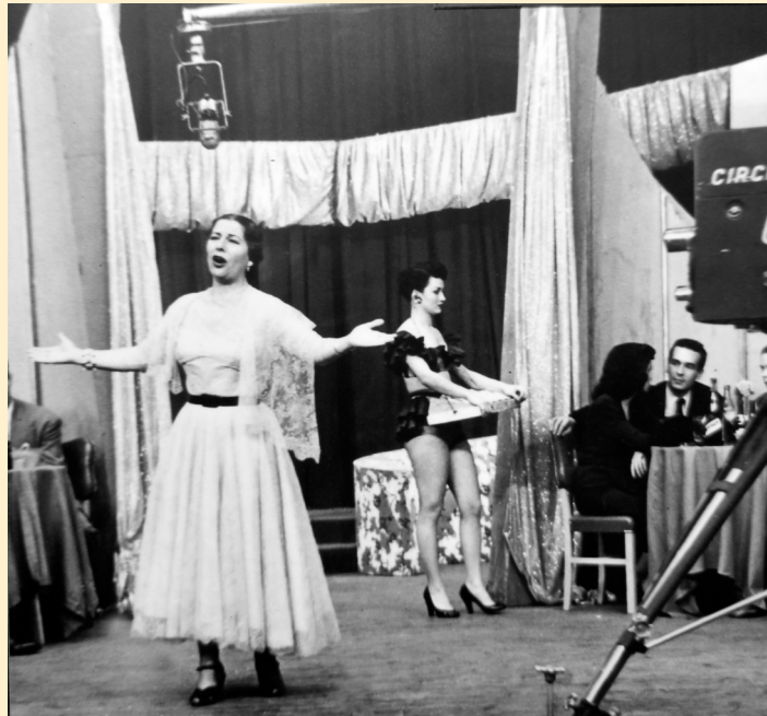
Grabación para la televisión cubana, La Habana (1952).

La llegada de la televisión a Cuba se produjo en 1950, emitiendo de manera regular desde 1951; en este sentido, se adelantaba notablemente a la aparición de la misma en España, cuya primera emisión data de 1956, aunque todavía de modo experimental; habrá que esperar a la década de los sesenta para el desarrollo de la misma, años en los que Concha Piquer ya se ha retirado de la escena.