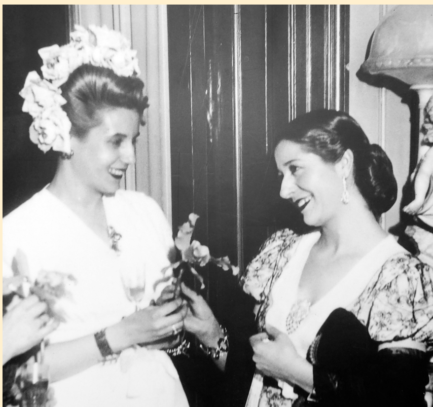
Con Eva Perón en el Teatro Cómico, Buenos Aires (1945)