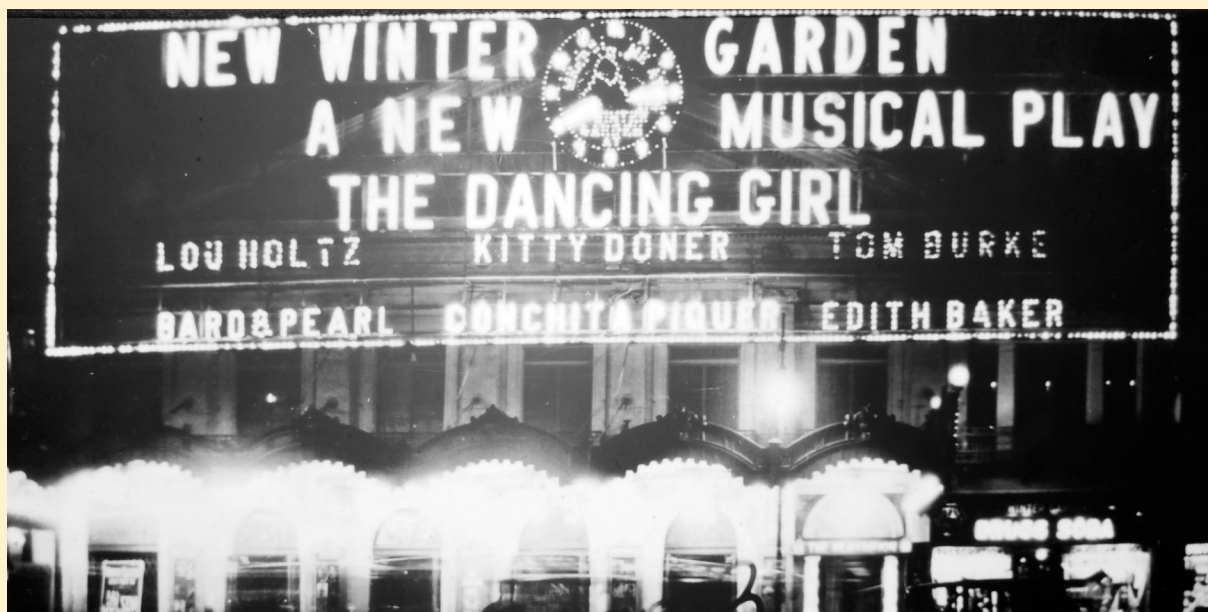
The dancing girl (1923). Teatro Winter Garden, Nueva York (1923)

La rica oferta escénica que presentaba Nueva York se convirtió en una antesala de las propuestas que posteriormente se trasladarían al cine. En este sentido, la nueva industria recurrió tanto a figuras reconocidas como a obras que ya habían probado su funcionalidad en los teatros, como medio para asegurar los elevados costes que suponía un rodaje. Es notorio, además, el protagonismo de las artistas femeninas, actuando como reclamo publicitario y como representación de la epítome de la modernidad, convirtiéndose en un símbolo del capitalismo que con su exposición y seducción en la gran pantalla, acaparaban la atención del público. Conchita Piquer formó parte de este universo configurándose como performing star , una manera de ser y estar en el escenario que, en los siguientes años, trasladaría a sus espectáculos «de Arte Español». Y es que, en efecto, aunque en el universo de la copla existieron destacadas personalidades masculinas (Angelillo, Miguel de Molina, Antonio Molina...) pocos pudieron igualar la popularidad y éxito de las estrellas femeninas.