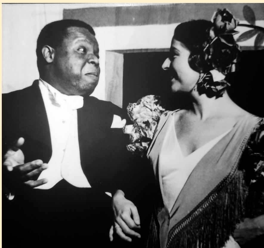
Con Bola de Nieve , Barcelona (1948).

(...)Yo salí con tal nervio que dije: Toquen como puedan, porque yo no sé ni lo que voy a hacer. Y eso, como yo no sabía que el micrófono lo captaba, lo oyó el público y le hizo mucha gracia. Y la gente se puso de pie, y yo sin saber na' . Aturdido, sin saber lo que iba a hacer, canté Bito Manué, tú no sabe ingle y me aplaudieron mucho. Y luego canté mi canción, que ya el público conocía, que ya estaba en la calle, y fue un gran éxito. Me dejaron en la revista porque yo, aparte de ser el pianista de la Montaner, pues cantaba. Así empecé mi labor teatral. Esa temporada fue maravillosa 8 .