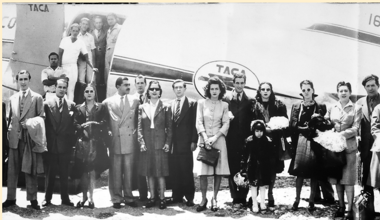
Con la compañía en Medellín (1946)

Nacida en el barrio de Sagunto (Valencia), la artista sigue la estela de las grandes figuras de principios del siglo XX como Pastora Imperio, la Argentinita o Raquel Meller, adquiriendo su formación artística en la escena 2 : siendo una niña comienza a actuar en el teatro Soguero, donde es contratada para trabajar durante cuatro domingos, y más tarde, con el apoyo del maestro Laguna, en otros espacios de la capital del Turia como el Apolo y el Kursaal. Es en este último escenario donde la descubre Manuel Penella, que adivina en ella un talento excepcional y la lleva a tierras americanas, siendo este un momento fundamental en el desarrollo de su carrera. Para ella compone durante la travesía La maja de rumbo y, posteriormente, piezas que adquirirían gran popularidad tanto en España como en Hispanoamérica, tales como Agüita clara , La chula celosa , Dulcinea (en colaboración con Valverde) y el pasodoble En tierra extraña . Concha Piquer no limitó su actividad artística al espacio peninsular; hasta 1958 -año en el que se retira- con su «Compañía de Arte Folklórico Andalúz Escenificado» realizó numerosas giras en las que trasladó un repertorio conformado en España. Incansable trabajadora, en estas interminables tournés , se acompañaba no solo de músicos y bailarines, sino del vestuario y parte de las escenografías confeccionadas en España, dando lugar a la frase popular «viajas más que el baúl de la Piquer».