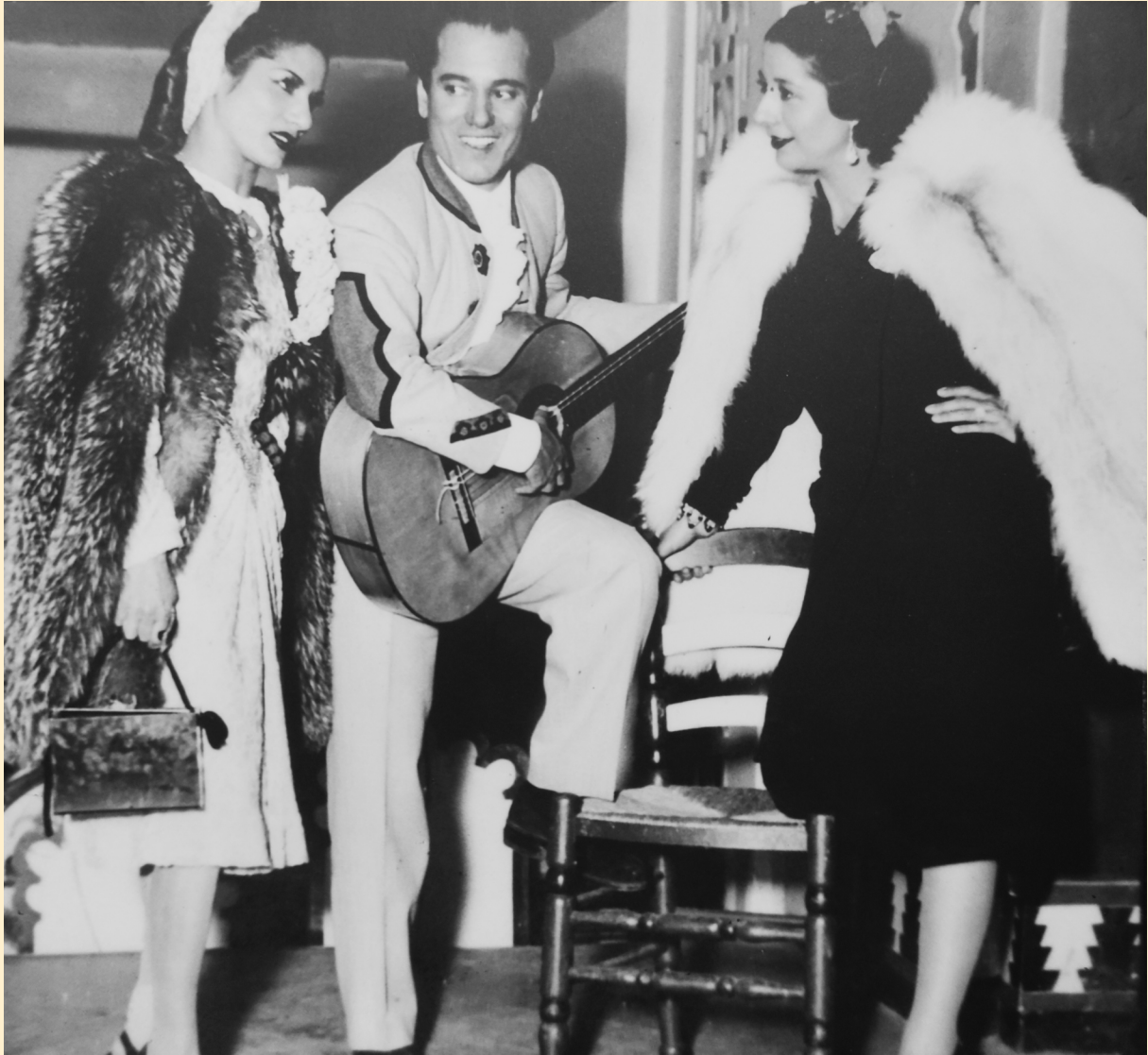
Carmen Amaya, Concha Piquer y Pepe Marchena (1945)