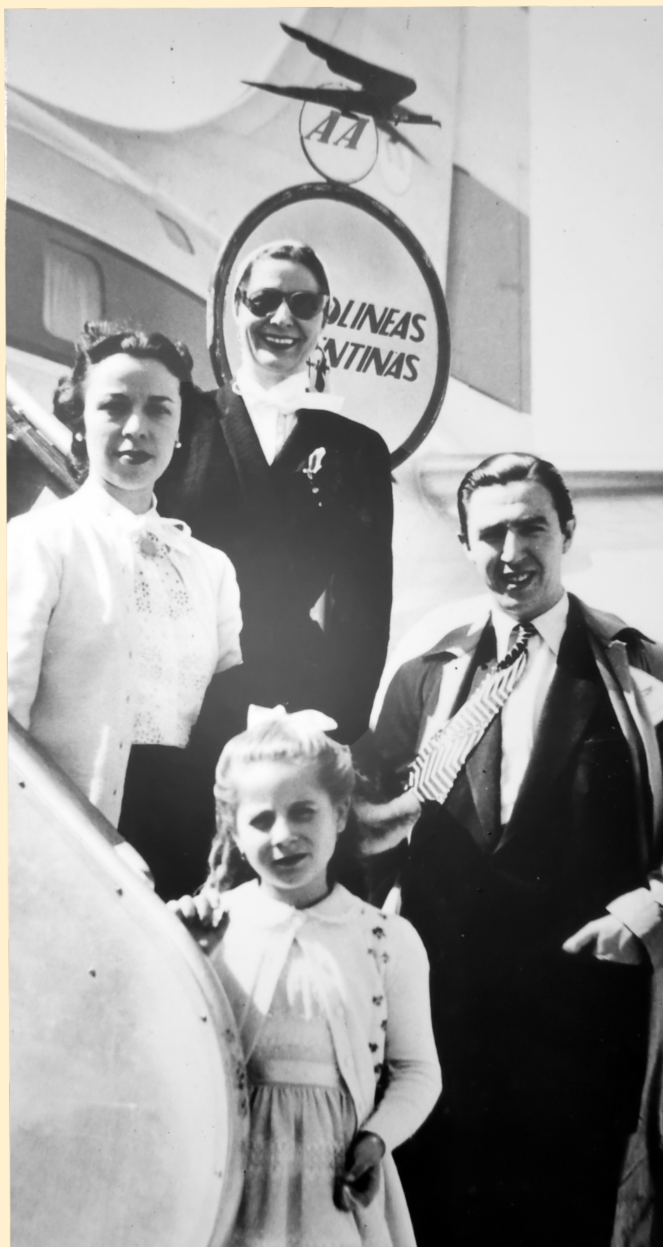
Con su compañía en Buenos Aires con destino a La Habana (1951)