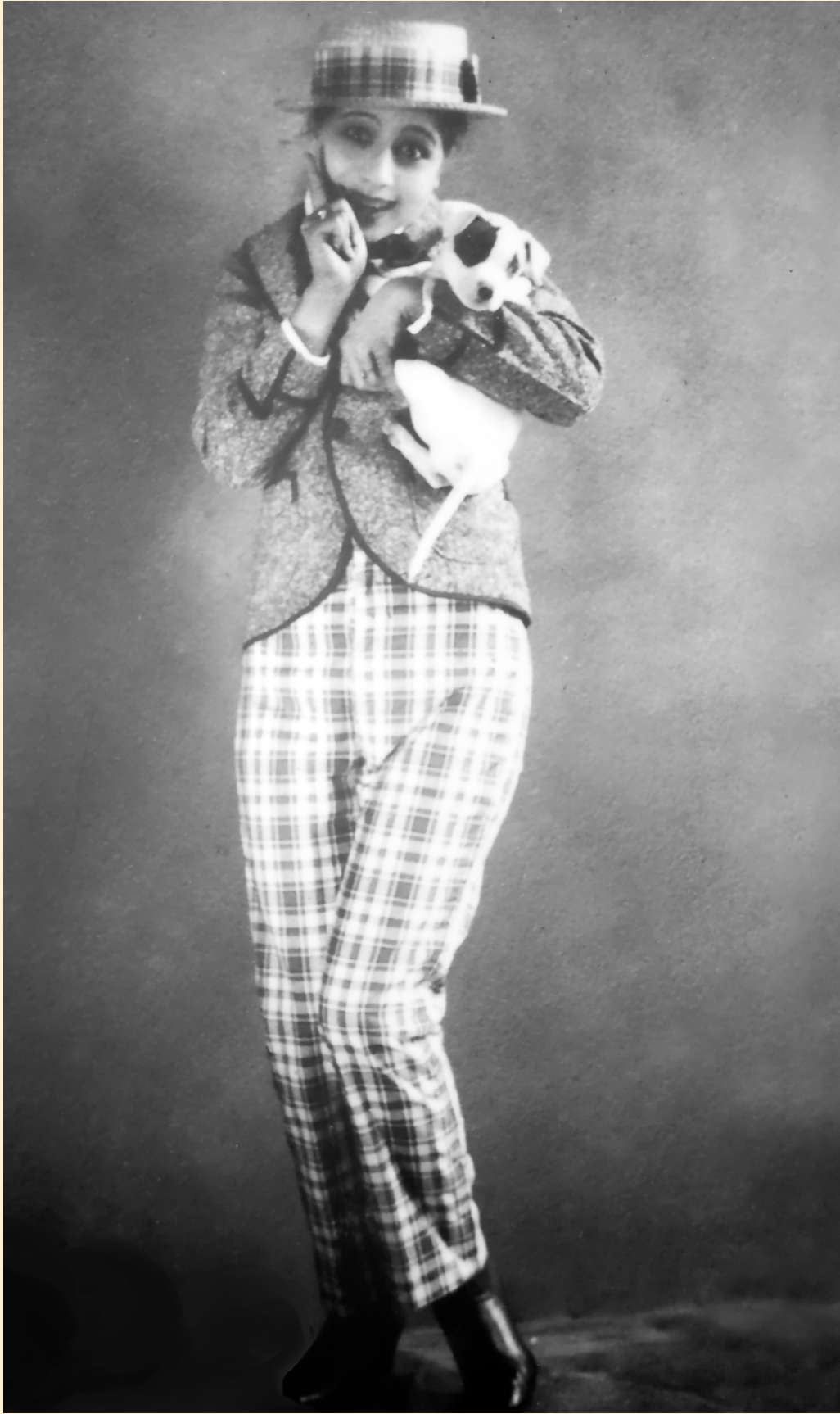
Concha Piquer en Nueva York (1923)