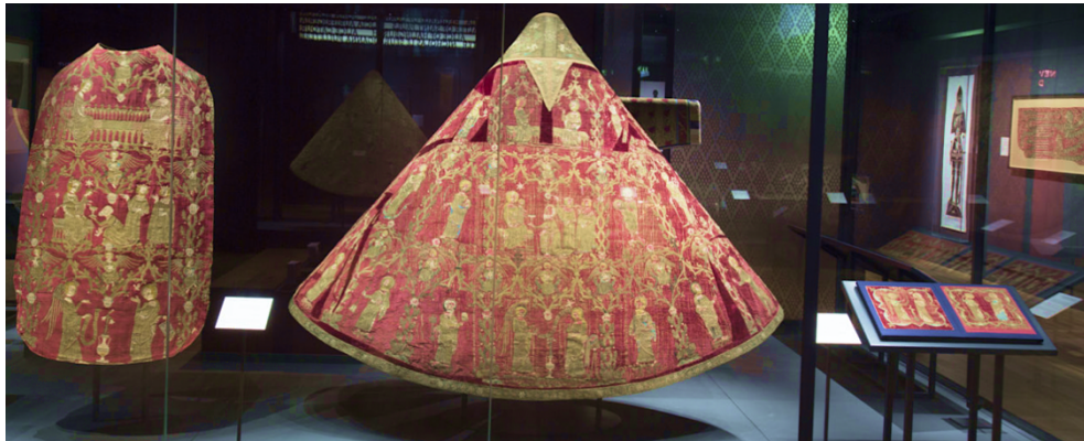
Figura 7. Detalle de una vitrina central de la exposición Opus Anglicanum , en la que se aprecia el soporte cónico para la exhibición de una capa pluvial.

manuscritos puedan sostenerse en las vitrinas, hay que cambiar las páginas por las que se abren cada varias semanas. Un caso interesante y perfectamente planteado fue la exhibición Cantorales , celebrada en la Biblioteca Nacional de España en 2014. Para esta muestra, se diseñaron algunos atriles de madera que guardaban una cierta armonía con la época de los libros. A la vez, el color de las vitrinas destacaba con la claridad de la iluminación, siendo prácticamente inapreciables los elementos de sujeción de las hojas de los libros 36 .