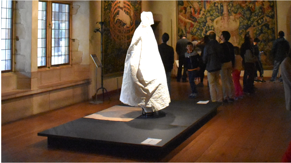
Figura 1. Pieza oculta por velo en la exposición Heavenly Bodies: Fashion and the Catholic Imagination en The Cloisters , días antes de su inauguración.