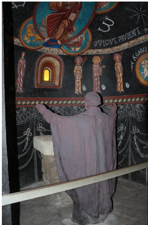
Figura 9. Recreación de un espacio litúrgico altomedieval hispánico en el Museo de Historia de Barcelona.