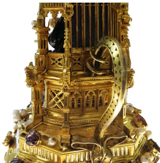
Figura 5. Vista trasera de Portapaz, Museo de la Catedral de Burgos, procedente de la Corte del Duque de Berry, h. 1393 (derecha).

Lo mismo ocurre con el portapaz, esta vez más frecuente en los museos, utilizado para hacer llegar el signo de paz que se intercambia después de la liturgia eucarística a las autoridades que se encuentran distantes del obispo, sin que este tenga que desplazarse para ello. Tienen la apariencia de unas pequeñas placas metálicas –generalmente de plata–, a modo de minúsculos retablos con imágenes devocionales. En la parte posterior, poseen un asa para que el diácono pueda asirla sin opacar la imagen frontal. En el Museo de la Catedral de Burgos, el portapaz del siglo XIV procedente de la corte del Duque de Berry (fig. 5), se encuentra en una vitrina que permite el tránsito de los visitantes alrededor, siendo observable de esta manera el asa trasera 31 . Sin embargo, estos pequeños artefactos, apreciados a menudo por su iconografía ubicada en la parte delantera, suelen pasar inadvertidos en su función ritual, precisamente por no exponerse de manera que sea visible su asidero posterior, en algunas colecciones y museos.