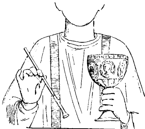
Figura 4. Uso de la cánula o pajita litúrgica, según diagrama de Rohault de Fleury (izquierda).

exposiciones y textos de reputados especialistas han insistido en identificar las piezas como dos estolas, cuando claramente una de ellas –la más corta– es un manípulo 28 . Por lo que respecta a los libros litúrgicos, las dificultades se focalizan en otra dimensión: transmitir a las audiencias cuál era el contenido de cada libro, en qué tipo y momento de cada ceremonia se utilizaba y por qué ministro. No es tarea fácil cuando la realidad de la diversidad de manuscritos y contenidos se impone a las clasificaciones taxonómicas en las que no terminan de encajar algunos libros, especialmente en la Alta Edad Media. Por señalar algún aspecto, es frecuente que, en la exhibición de los libros litúrgicos del rito hispánico, se recurra en las cartelas y la didáctica a la mención del ‘libro equivalente’ al rito romano, como si existiesen correspondencias completas 29 .