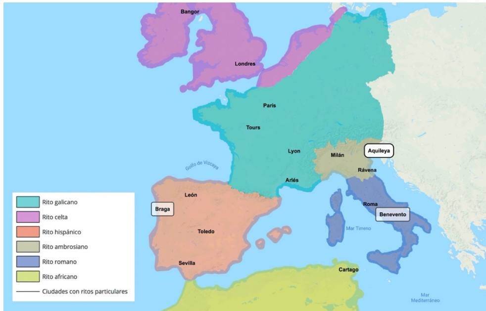
Figura 2. Mapa con la extensión geográfica de los ritos litúrgicos del cristianismo occidental, entre los siglos IV y IX.

estaban dotados de unos rasgos globales que nos permiten trazar unas líneas de unidad, más allá de las variaciones eucológicas. Estos rasgos identitarios se acentúan aún más entre los ritos pertenecientes a una misma área geográfica, como es el caso de las interrelaciones entre la liturgia hispánica, la romana y la galicana en la Alta Edad Media (fig. 2), que dará sustrato textual a la reforma del rito romano bajomedieval con la que se pretenderá una cierta unidad 11 .