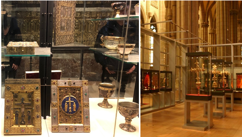
Figura 6. Detalle de vitrina en el Tesoro di San Marco di Venezia (izquierda) y vista del área central del Museo Diocesano de Arte Sacro, Vitoria (derecha).

En el ámbito internacional, grandes museos conservan y presentan al público colecciones relacionadas con la liturgia cristiana medieval, como el Louvre o el Musée National du Moyen Âge de Cluny en París, el Hermitage en San Petersburgo, el Victoria & Albert o el British Museum en Londres, el Musée Provincial des Arts Anciens du Namurois de Bruselas, el Museum Schnütgen de Colonia o el Metropolitan Museum of Art de Nueva York. En España, además del Museo Nacional de Arte de Cataluña, el Museo Arqueológico Nacional o el Museo Lázaro Galdiano, siguen destacando por su exhibición de interesantes objetos medievales los museos diocesanos de Vic, Jaca o Cuenca, entre otros. Además de estos y otros centros, no queda en Europa iglesia, catedral o monasterio medieval importante que no posea una pequeña colección propia con algún artefacto litúrgico. Sin embargo, ni en los grandes museos ni en los centros más modestos es frecuente encontrar discursos expositivos en los que la liturgia medieval cristiana sea comprendida por los espectadores con un nivel medio de formación. Sin pretensión de exhaustividad, analizaremos algunos ejemplos de exposiciones permanentes y temporales para ver cómo afrontan las dificultades de este tipo de patrimonio cultural.