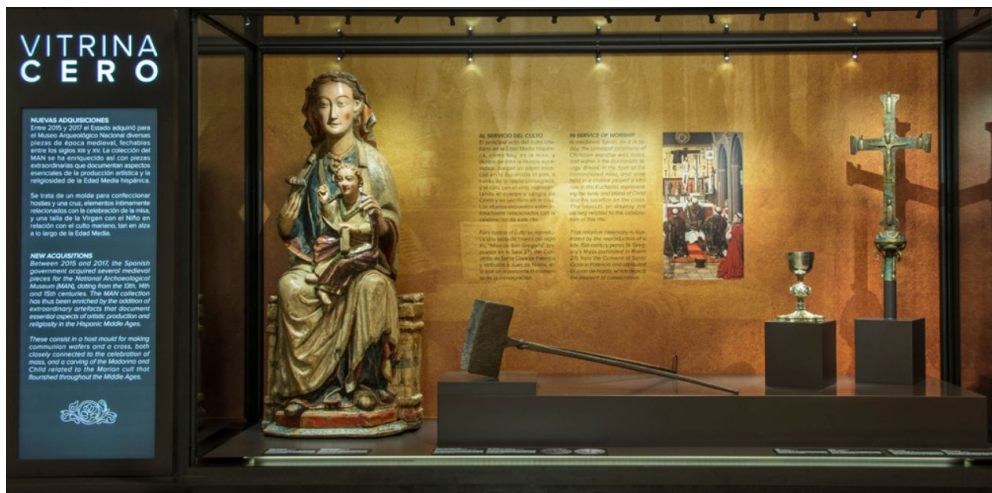
Figura 3. “Al servicio del culto”, Vitrina 0 del Museo Arqueológico Nacional entre enero y abril de 2018.

hostias, como el conservado en el Museo Arqueológico Nacional en Madrid, debe permitir al espectador comprender de qué manera el artefacto está relacionado directamente con la recuperación del culto eucarístico de la Baja Edad Media y con la necesidad de mostrar a las audiencias litúrgicas el pan consagrado en la elevación que, en este momento, poseía ya una forma determinada circular para facilitar su ostensión 24 . Si no se dota al visitante de estos elementos interpretativos, el molde para confeccionar formas eucarísticas se convierte en unas graciosas tenazas de hierro del siglo XV, carentes de relevancia entre la multitud de objetos conservados del mismo período. Este enfoque se hizo patente con muy buen tino, por ejemplo, en la confección de la “Vitrina 0” del Museo Arqueológico Nacional (fig. 3), en la que se mostraba esta pieza acompañada de otros objetos litúrgicos.