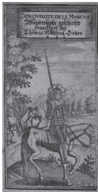
Abb. 1. Don Kichote de la Mantzcha, Das ist: Juncker Harnisch auß Fleckenland (Titelkupfer der Ausgabe Frankfurt a.M. 1648)

Übertragung aus dem Spanischen, inhaltsgetreu, wenn auch mit einigen Abweichungen, die auf eine komische Interpretation des Werkes zurückzuführen sind. (Colón 1974: 23-24) Die Übersetzung enthält jedoch nur die ersten 22 Kapitel des Romans, allerdings mit einer etwas anderen Nummerierung. Widmung, Lobgedichte und einige Passagen, die der Übersetzer als zu lang erachtet, die seiner Meinung nach den Leser ablenken und nichts Wesentliches zu der Handlung beitragen, werden ausgelassen. Das Buch enthält überdies vier Holzschnitte, die auch die burlleske Interpretation des Textes zum Ausdruck bringen. Auf der Titelseite z.B. sieht man Don Quijote nicht als einen älteren Junker, sondern als einen jungen Ritter, wie auf den Bildern des Cartels; er trägt den zu dieser Zeit typischen spanischen Kragen, durch den der spanische Hof im Ausland jahrzehntelang lächerlich gemacht wurde und der für einen Ritter absolut ungewöhnlich war), ist mit einem Stock statt einem Speer bewaffnet; seinen Helm zieren zerquetschte Federn.