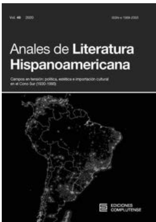
Imagen 4. Anales de Literatura Hispanoamericana , núm. 49 (2020).

ratura Hispanoamericana en el ámbito de las academias universitarias, lo que ha ayudado al crecimiento de la red intelectual propiciada por la publicación; también ha sido importante la obtención de proyectos de investigación financiados por instituciones públicas y privadas españolas en las que se ha contado con investigadores americanos y europeos que han permitido extender el entramado.