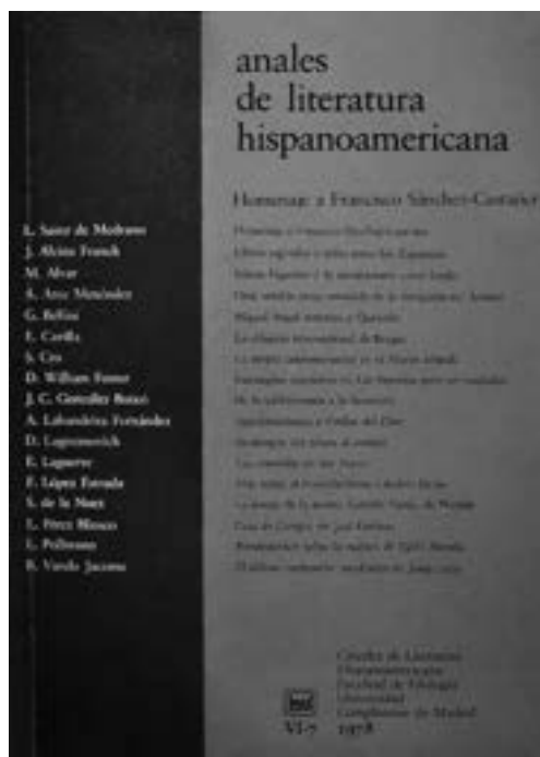
Imagen 2. Anales de Literatura Hispanoamericana , núm. 7 (1978).

Los tres primeros números —7, 8 y 9— fueron un homenaje a Sánchez-Castañer, lo que explica, hasta cierto punto, que también aparecieran