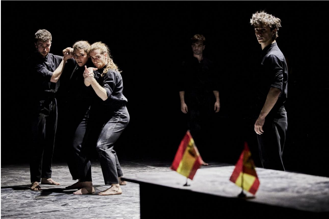
Fig. 28. Gernika [Fotografía], 2022.

Para finalizar con el análisis del attrezzo , los bailarines portan mini banderas franquistas tras los bombardeos y el consiguiente silencio sepulcral, una vez que el bando nacional durante la guerra civil española, detonante del atroz crimen, penetra en la villa vasca. Cambian así de personaje, dejan de ser ciudadanos para convertirse, temporalmente, en soldados.