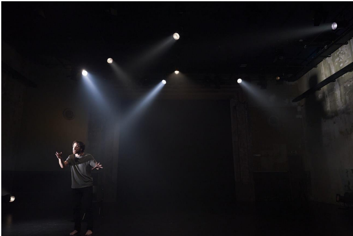
Fig. 6. | En mitad de tanto fuego [Fotografía], por David Ruano, 2023.