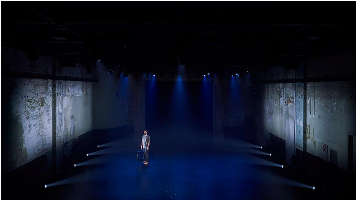
Fig. 8. En mitad de tanto fuego [Fotografía], por David Ruano, 2023