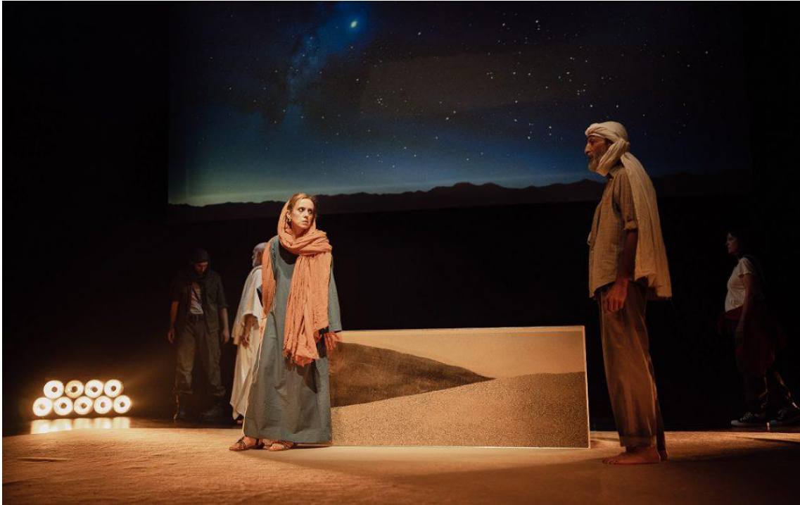
Fig. 17. Sáhara. Crónica del desierto [Fotografía], 2023.