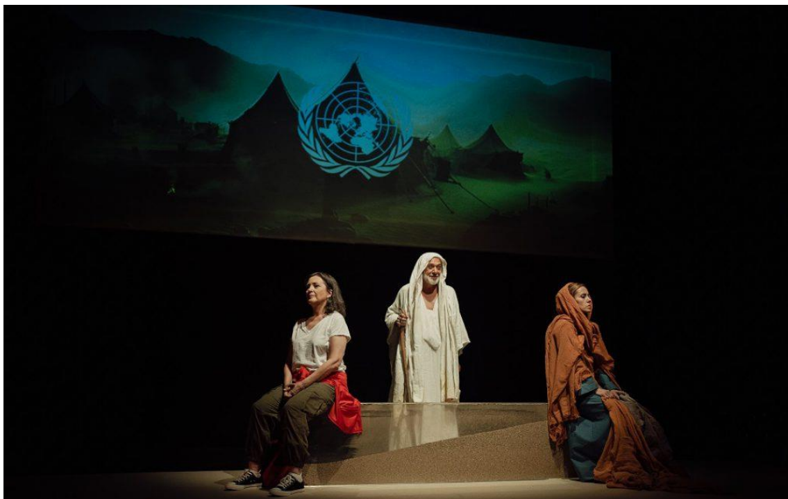
Fig. 16. Sáhara. Crónica del desierto [Fotografía], 2023.

Mediante este diseño escenográfico de Silvia de Marta, se pretende recrear el desierto del Sáhara (único espacio dramático, junto al mar final que también se construye por medio de la proyección), ese largo camino que deben emprender los personajes hasta llegar al mar. Por tanto, y para la construcción de este ambiente, la proyección e iluminación es fundamental. Los tonos anaranjados son los más frecuentados durante el transcurso de la acción dramática diurna, mientras que los azulados quedan reservados para aquellos momentos nocturnos y situaciones de ensoñación. La luz, además, al incidir sobre el prisma rectangular, potencia esa arena que contiene sobre el suelo. A todo ello se une la proyección de paisajes desérticos o elementos simbólicos que contextualizan, aún más, la situación. Ejemplos de estas proyecciones quedan reflejados en las imágenes 12 y 13.