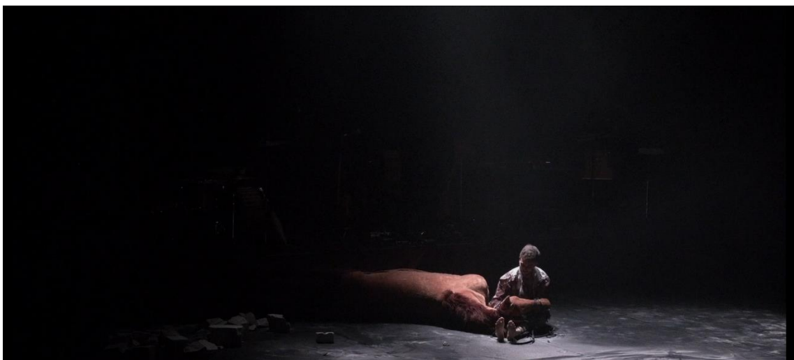
Fig. 26. Gernika [Captura de pantalla], 2022.