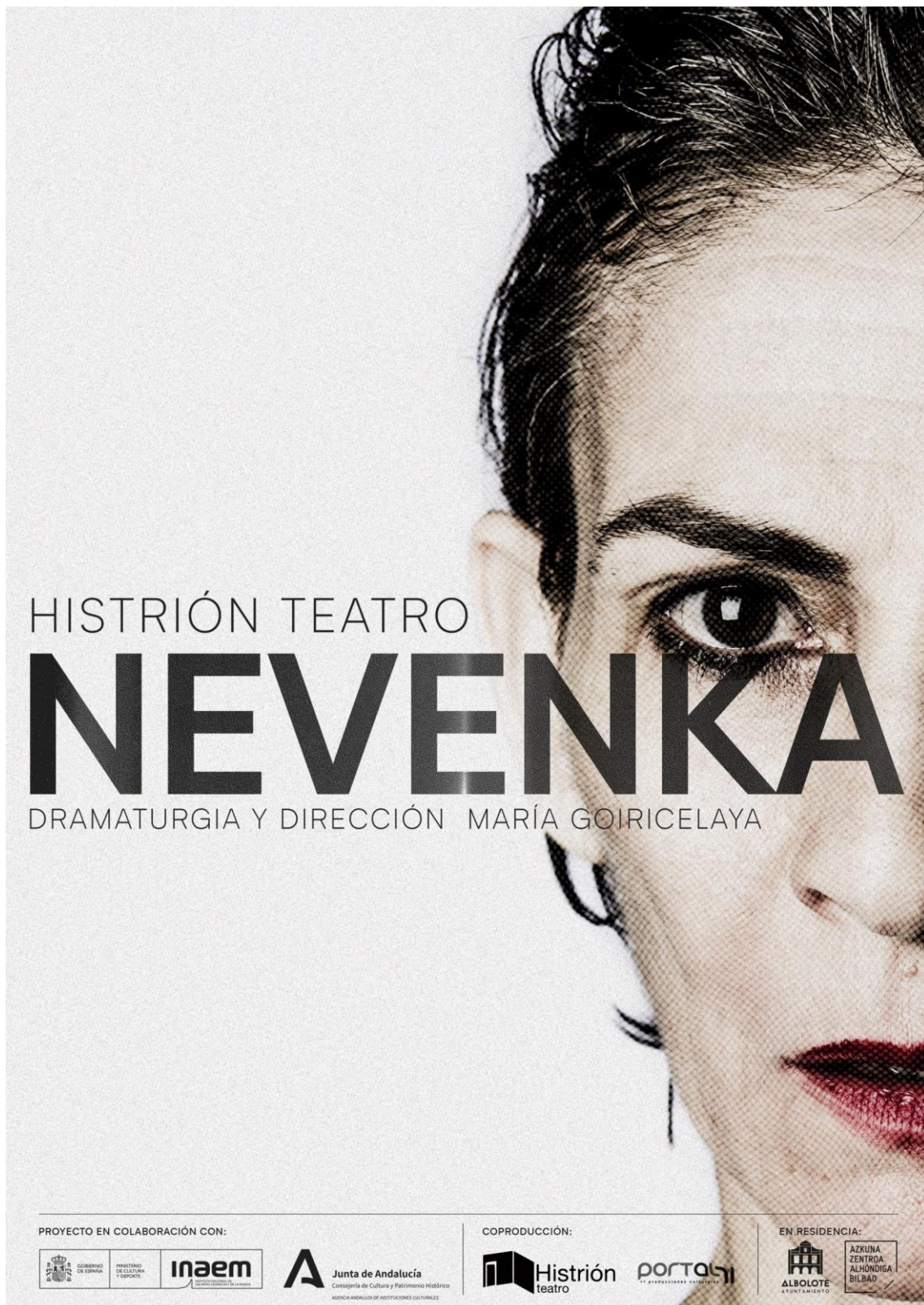
Fig. 9. Cartel Nevenka , 2023.