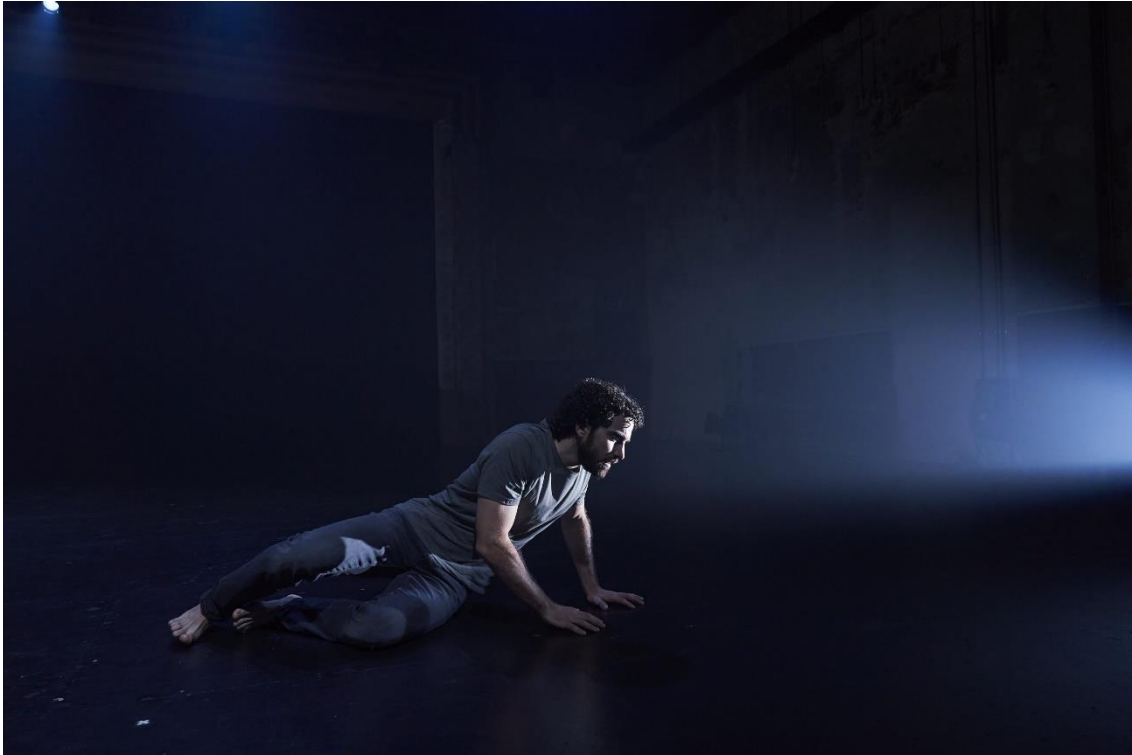
Fig. 5. En mitad de tanto fuego [Fotografía], por David Ruano, 2023.