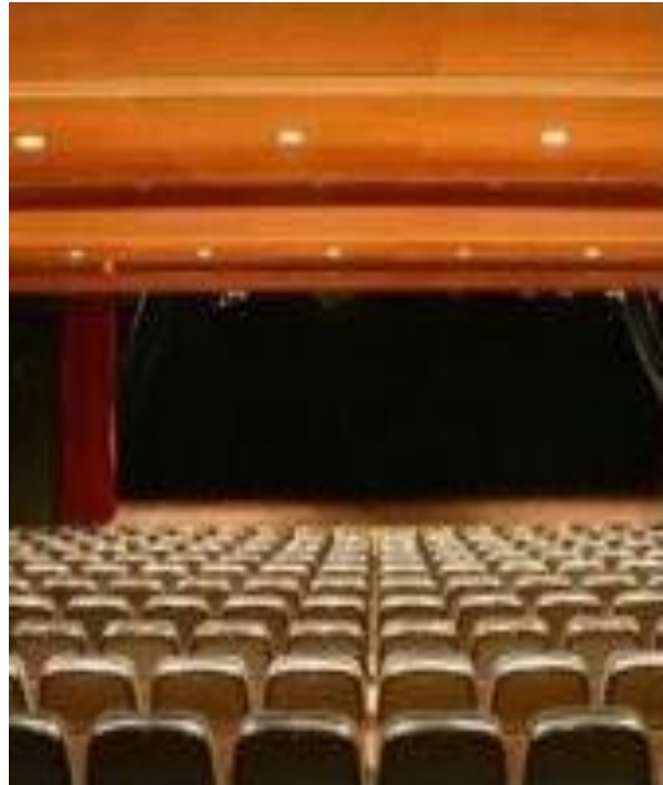
Fig. 2. Por otro lado, el Centro Cultural Manuel Benito Moliner suele albergar propuestas escénicas más independientes, sobre todo, debido a sus dimensiones más reducidas.