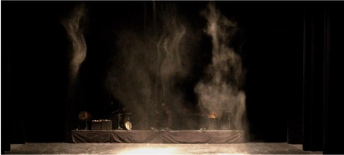
Fig. 24. Gernika [Captura de pantalla], 2022.