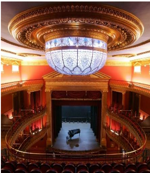
Fig. 1. El Teatro Olimpia de Huesca cuenta con una caja escénica negra a la italiana de 135 metros cuadrados de superficie total. Se dispone como un teatro al estilo clásico.

Asimismo, y para mejor comprensión de las necesidades escenográficas de cada espectáculo, se detallan los tres lugares de representación en donde se produjeron las representaciones de las obras mencionadas con anterioridad.