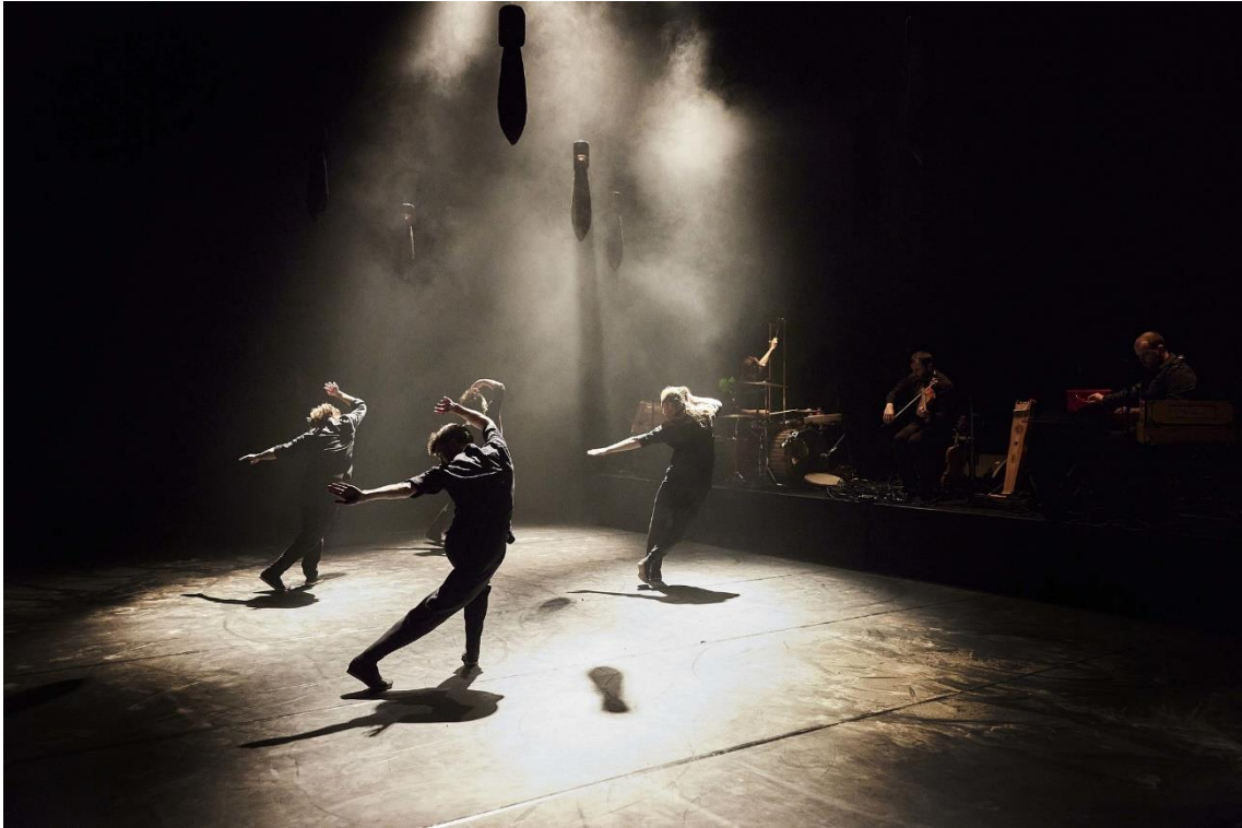
Fig. 22. Gernika [Fotografia], 2022.