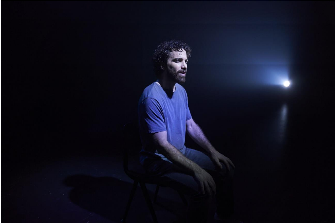
Fig. 7. En mitad de tanto fuego [Fotografía], por David Ruano, 2023.