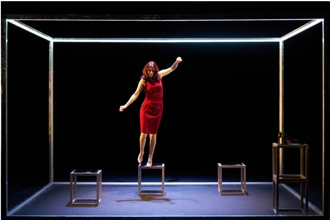
Figs. 12 y 13. Nevenka [Fotografías], 2023.