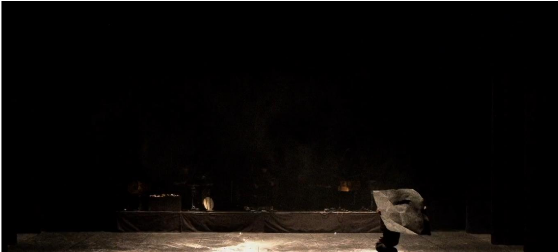
Fig. 25. Gernika [Captura de pantalla], 2022.