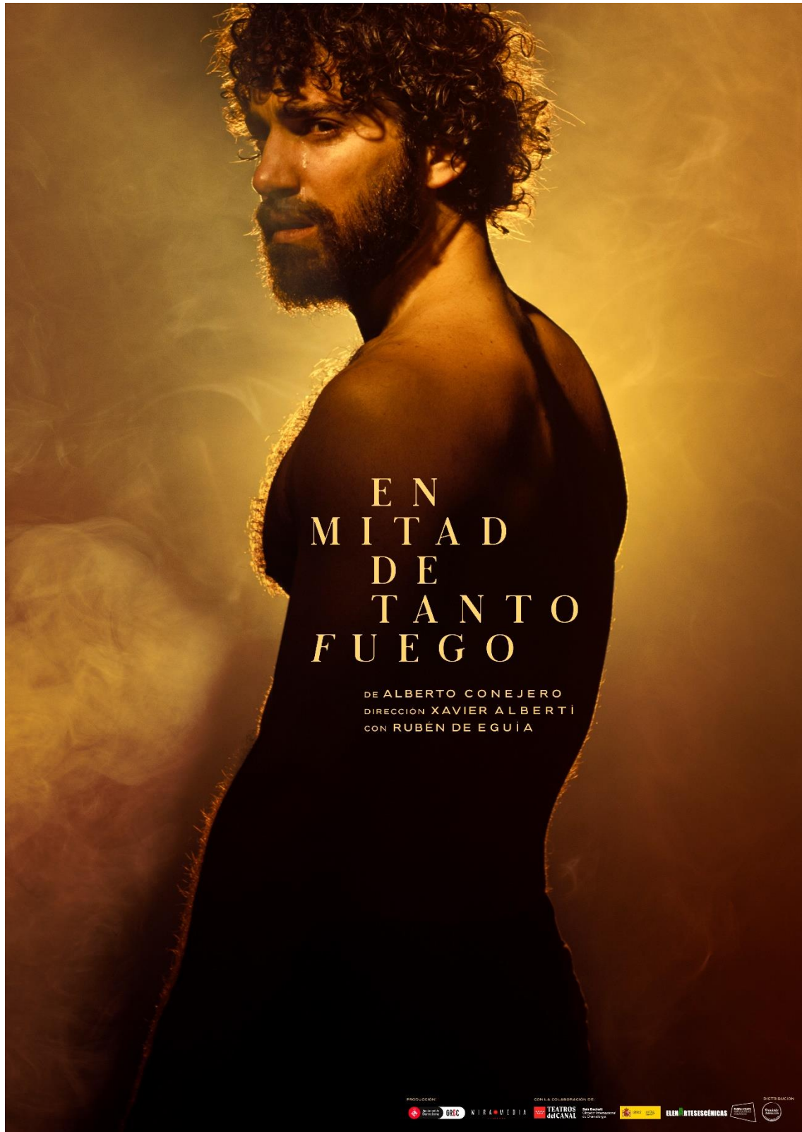
Fig. 4. Cartel En mitad de tanto fuego , 2023.