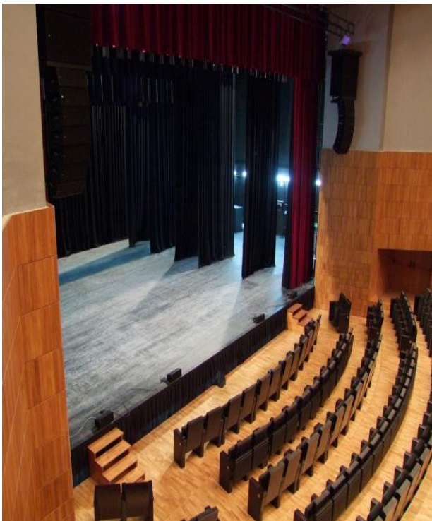
Fig. 3. Para finalizar, el Auditorio Carlos Saura del Palacio de Congreso goza de un escenario de grandes dimensiones con una superficie total de 400 metros cuadrados. A continuación, se adjuntan fotografías de cada uno de los lugares de representación citados por orden de mención.