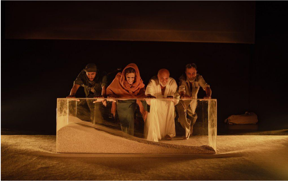
Fig. 19. Sáhara. Crónica del desierto [Fotografía], 2023.