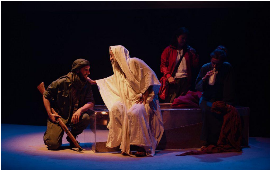
Fig. 18. Sáhara. Crónica del desierto [Fotografía], 2023.