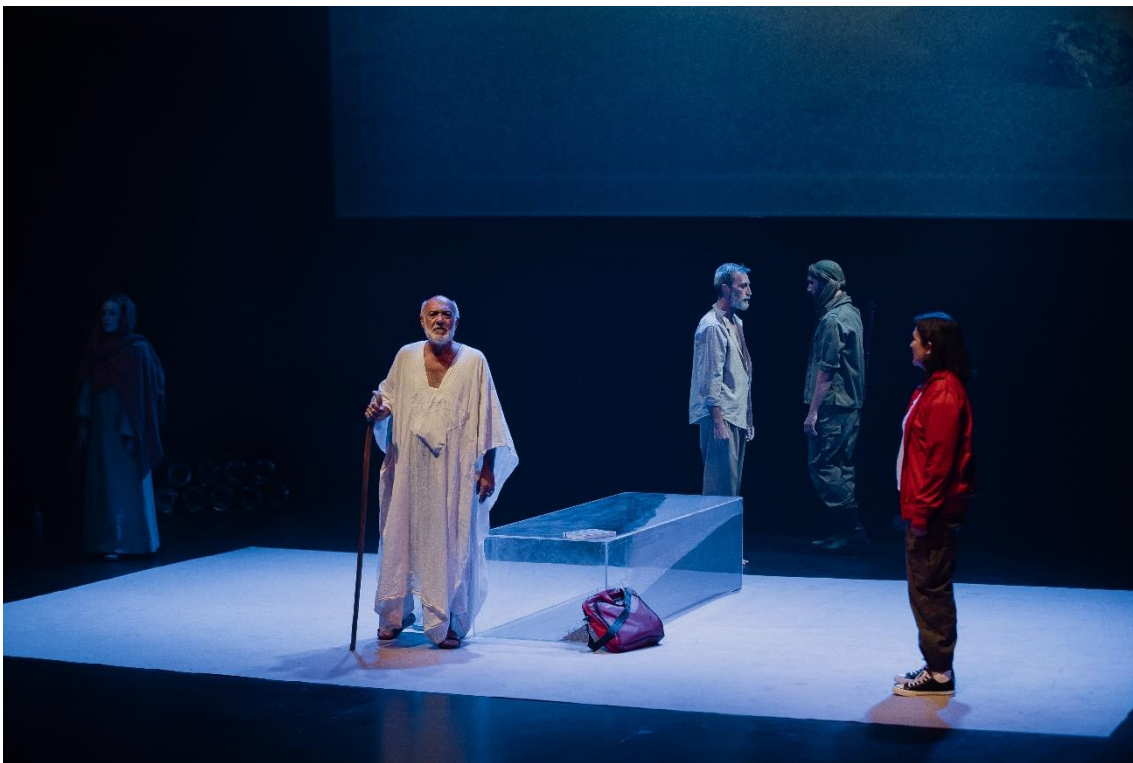
Fig. 15. | Sáhara. Crónica del desierto [Fotografía], 2023.

La importancia de esta cita es fundamental cuando se aborda la escenografía de esta producción, donde términos como «viaje», «vértigo» o «desierto» son cruciales para la comprensión de su diseño de escena. En las sucesivas líneas se hace referencia a estos conceptos a través del análisis de la puesta en escena de Sáhara. Crónica del desierto .