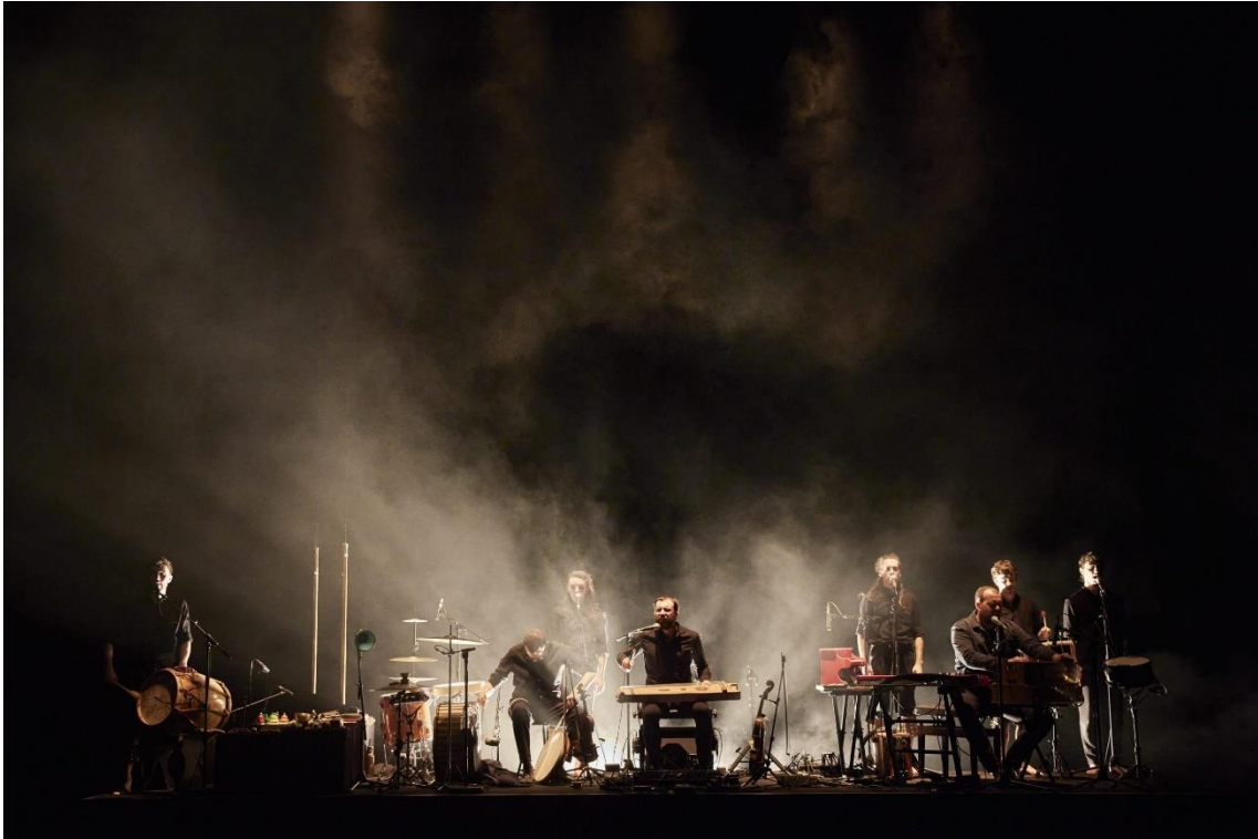
Fig. 29. Gernika [Fotografia], 2022.