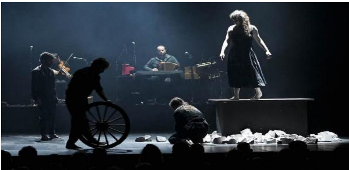
Fig. 27 | Gernika [Fotografía], 2022.

En segundo lugar, mediante la harina y piedras que constituyen ahora y reposan sobre la escena. Configuran así un espacio dramático devastado, lleno de escombros y horror. En tercer lugar, se introduce en escena una rueda arrastrada por uno de los bailarines, sin duda alguna, un elemento simbólico que remonta al espectador a los orígenes de la civilización. Por último, aparece un carro sobre el que reposan idénticas piedras a las ya visualizadas y del cual emanará la figura de uno de los bailarines, rescatándose este de entre los cascotes.