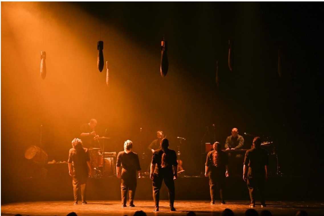
Fig. 23. Gernika [Fotografia], 2022.