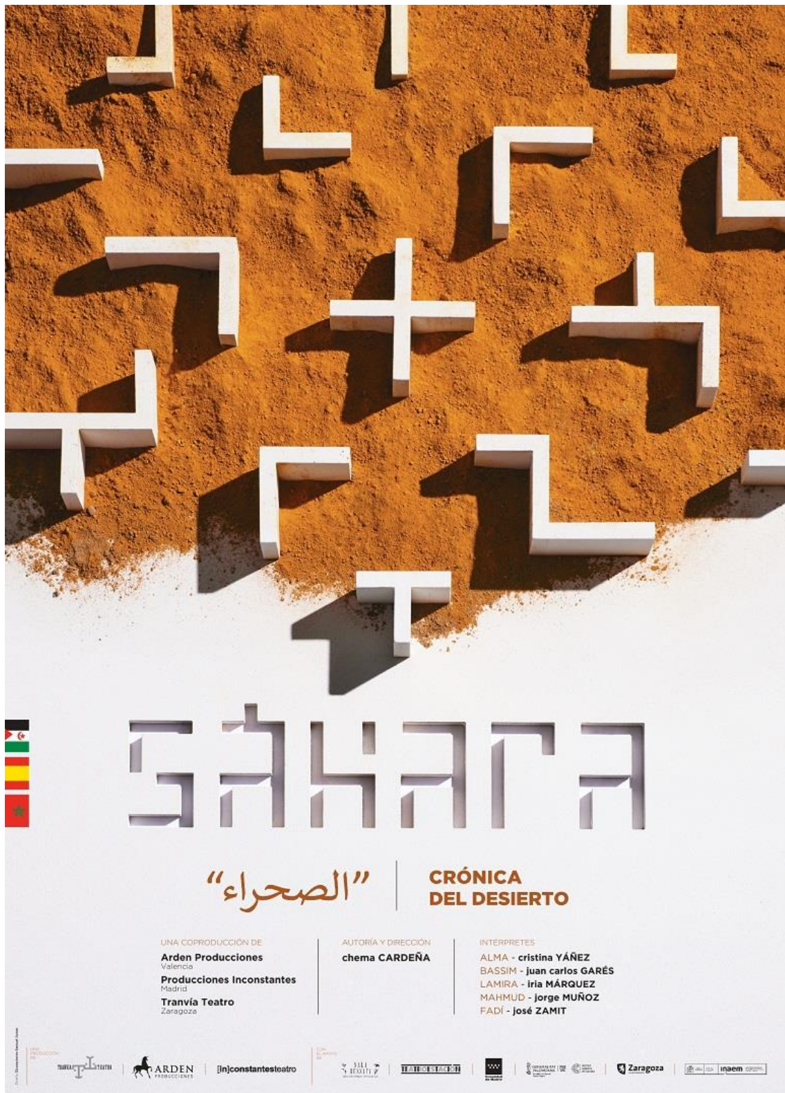
Fig. 14. Cartel Sáhara. Crónica del desierto , 2023.