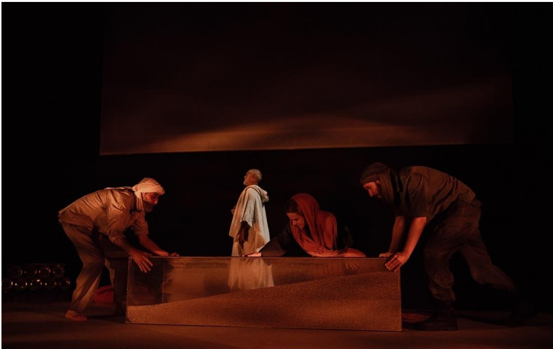
Fig. 20. Sáhara. Crónica del desierto [Fotografía], 2023.