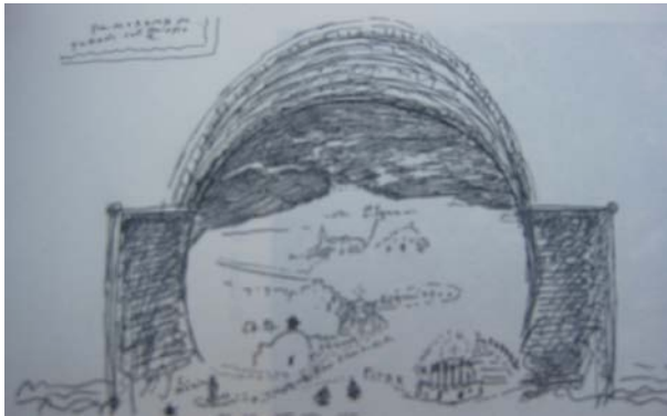
Vista di Toledo. Tav. 5.

Mirando estos dibujos se aprecia el peculiar procedimiento estilístico de Ortese, que imagina sus paisajes fantásticos a partir de los cuadros de un pintor en los cuales el paisaje tiene un valor del todo peculiar. En la pintura de El Greco éste cumple un emotivo protagonismo, una visión lírica que lo coloca como descendiente de la tradición veneciana 157 , en la cual dicho elemento pictórico trascendió muy pronto la mera plasmación de una orografía, de un fondo escénico.