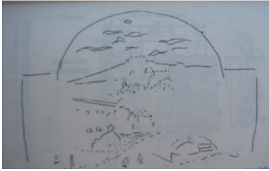
Vista di Toledo. Tav. 2.