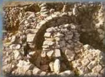
Castillejo de Bonete