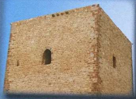
Castillo de Terrinches