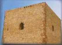
Castillo de Terrinches