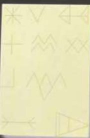
Marcas de cantero del Castillo de Terrinches

En 1282 Terrinches sufrió una razzia lanzada por tropas islámicas al mando del Sultán de Marruecos, Aben Yucef, que destruyó las cosechas del pueblo y parte de su caserío. El vecindario, refugiado en el Castillo, resistía el asedio sin capitular. Les capitaneaba su Alcaide (de nombre Presonero), quien pensó rendirse al ver que los musulmanes prendían fuego al exterior del Castillo, en el intento de romper las defensas o quemar a los allí refugiados. En ese momento cobró un histórico protagonismo la mujer del Alcaide, pues cogió el mando y, confiando en los potentes muros del Castillo, animó a todos a la resistencia. Su nombre no nos ha llegado, pero las informaciones recogidas en las Relaciones de Felipe II sí mencionan que su carácter era el de una «persona varonil». El Castillo de Terrinches soportó bien el ataque, por lo que las tropas islámicas optaron por desistir de su ofensiva para dirigirla hacia la cercana población de Almedina. En el siglo XV la línea de defensas de la que formaba parte el Castillo de