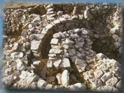
Castillejo de Bonete