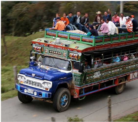
Figura 9. Chiva tradicional para el transporte de pasajeros y mercancías