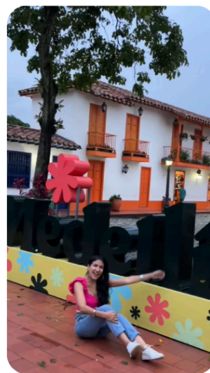
Figura 3. Pueblito paisa con branding oficial de Medellín