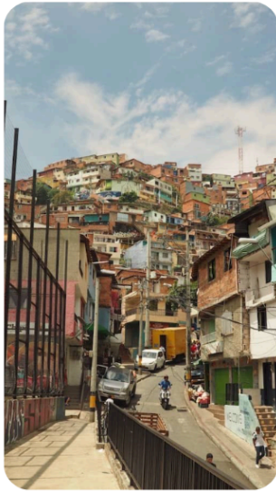
Figura 11. Comuna 13