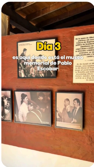
Figura 7. Museo de Pablo Escobar dentro de la Hacienda Nápoles

En cuanto al narcopatrimonio, la presencia de este tipo de contenido fue menor a la esperada inicialmente. Solo se identificó un vídeo y un comentario en los que se menciona directamente la Hacienda Nápoles, antigua propiedad de Pablo Escobar, hoy convertida en parque temático. En el vídeo, la creadora de contenido incluye la hacienda dentro de su itinerario como un atractivo turístico, sin juicio explícito, pero apunta como dato relevante que dentro se encuentra el museo de Pablo Escobar, mientras que en el comentario se hace referencia a “la hacienda de Pablo” y se sugiere que visitarla enriqueció su experiencia en la ciudad, lo que demuestra que la ciudad se sigue ligando al pasado aunque haya intentos de resignificación. Si bien esta propiedad no se encuentra en Medellín, su inclusión dentro de circuitos turísticos asociados a la ciudad la posiciona simbólicamente como parte de su patrimonio. Esta resignificación del pasado criminal como atractivo cultural y comercial es lo que se denomina narcopatrimonio (Naef, 2017 citado en Beauvais, 2022).