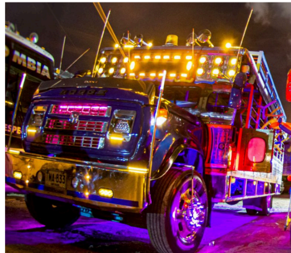
Figura 10. Chiva rumbera, adaptada para fiestas móviles

https://www.colombiatravelreporter.com/blog-posts/chivas-rural-transportation-and-colombian-culture-icon