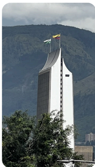
Figura 2. Edificio Coltejer

https://www.tiktok.com/@coasttourscartagena/video/7372299996546403590