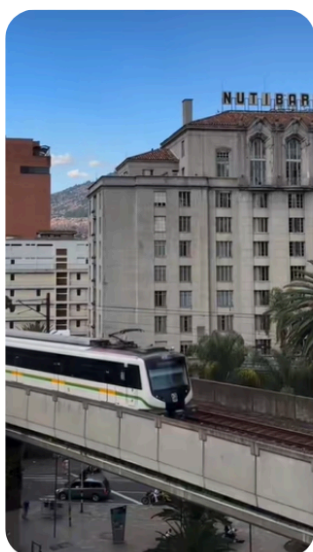
Figura 5. Metro de Medellín y hotel Nutibara

sólida funciona como un elemento diferenciador, además de servir de guía para los discursos espontáneos que se producen sobre el lugar.