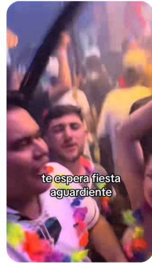
Figura 13. Turistas de fiesta en Medellín