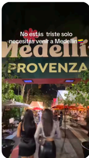
Figura 14. Provenza con branding oficial de Medellín Fuente: https://www.tiktok.com/@vsvsss/video/7346240719595539718