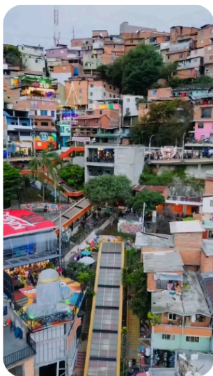
Figura 1. Panorámica Comuna 13 de Medellín