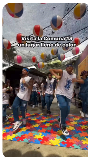
Figura 6. Espectáculo de bailarines en la comuna 13

https://www.tiktok.com/@despegar.mx/video/7338068350674767110