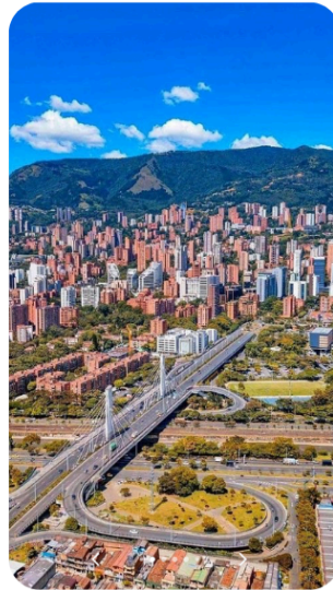
Figura 12. Panorámica del puente de la 4 sur, El Poblado