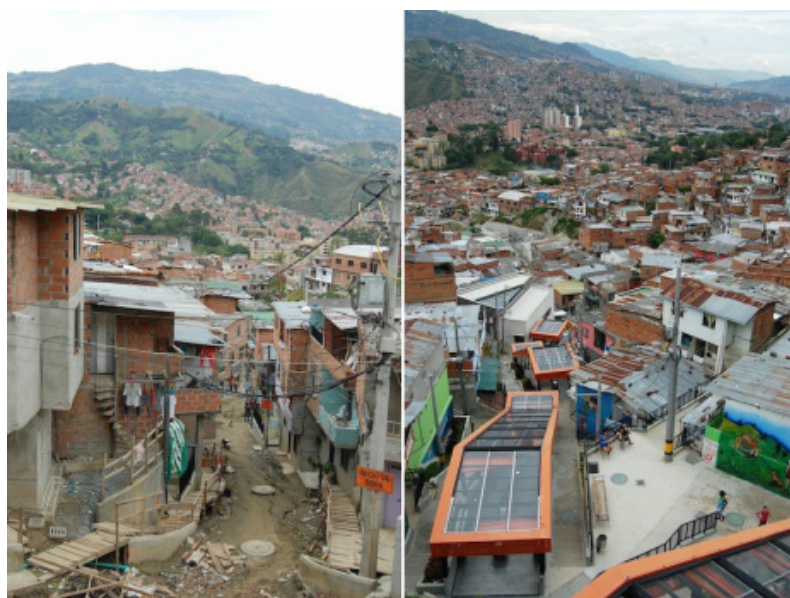
Figura 4. Antes y después de la construcción de las escaleras eléctricas de la Comuna 13

Además, algunos comentarios de usuarios extranjeros refuerzan esta idea al expresar experiencias personales seguras o admiración por el cambio, como ocurre con frases del tipo “yo he ido y no me ha pasado nada malo” 4 . Estos comentarios coinciden con lo planteado por Marchiori y Cantoni (2012), quienes sugieren que los contenidos publicados en línea permiten a los usuarios formar una experiencia mediada del destino turístico. Estos contenidos, al ser accesibles para muchos y reflejar opiniones compartidas, pueden sustituir o reforzar la experiencia directa, influyendo en las percepciones de otros usuarios sin necesidad de un contacto físico con el lugar. Por consiguiente, la narrativa de transformación que circula en TikTok sobre Medellín contribuye activamente a reconstruir y resignificar su imagen turística.