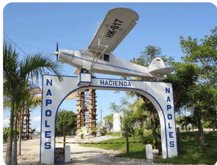
Figura 8. Entrada de la Hacienda Nápoles

https://www.tiktok.com/@conociendoconjuli/video/7452534976400198917