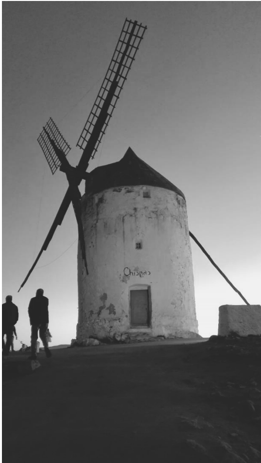
El molino mientras anda gana