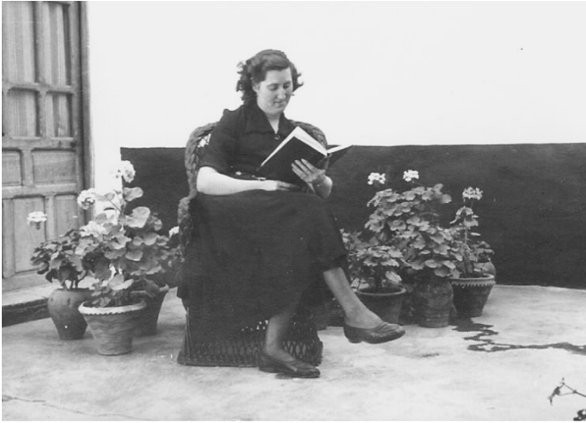
Más vale saber que haber

(«Nadie tienda más la pierna de cuanto fuere larga la sábana», II 53). En cambio, Núñez opta por un refrán rimado que no recurre a la modalidad imperativa negativa («Cada uno estienda la pierna, como tiene la cubierta» 1312); la forma académica tampoco opta por dicha modalidad sino que lo presenta como una locución: «Extender la pierna hasta donde llega la sábana» (Autoridades, 1737: «pierna»).