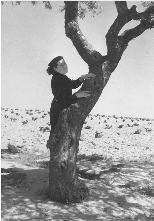
Quien a buen árbol se arrima buena sombra le cobija