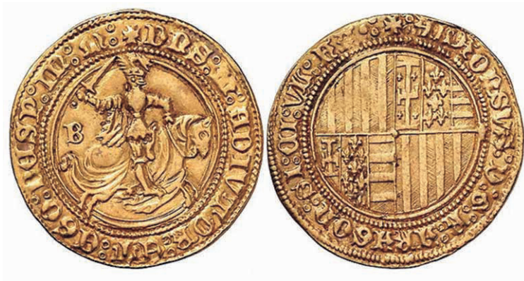
Figura n.º 6. Alfonsino de oro de Alfonso V de Aragón y I de Nápoles

Esta moneda de oro nos muestra una importante carga política, en primer lugar se usa el modelo castellano, cuando el territorio pertenecía por su historia y tradición al mundo italiano y de la Corona de Aragón, y fundamentalmente quiere indicar que sólo la unión del potencial de las Coronas de Castilla y de Aragón ha conseguido derrotar al reino más poderoso de Europa, Francia, y sólo juntos podrán asegurar la victoria, por eso la presencia de ambos monarcas, como soberanos conjuntos del Reino tal y como lo reconocían los documentos de 1500 y 1501, y la frase evangélica de «unidad» en unos momentos complejos, recordemos que el Archiduque Felipe, esposo de doña Juana, heredera de los Reyes Católicos, había estado conspirando y «mediando» entre los contendientes con vistas a asegurar su posición cerca del rey de Francia (48).