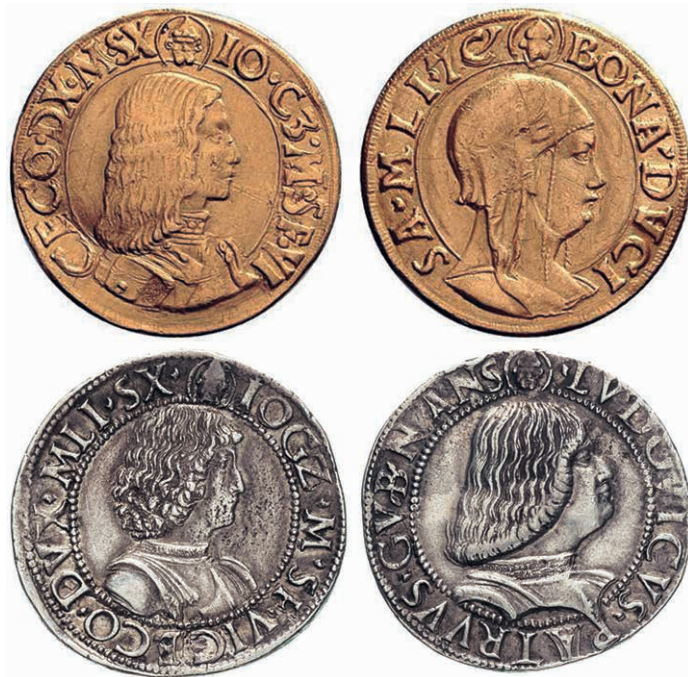
Figura n.º 8. Monedas de Regencia del Ducado de Milán

Intentando buscar un posible modelo iconográfico para esta moneda, aunque obviamente cambiando su mensaje político, sólo se puede encontrar algo parecido en las piezas acuñadas en el Ducado de Milán durante la minoría de edad de Gian Galeazzo María Sforza, que estuvo primero bajo la regencia de su madre, Bona de Saboya (1476-1480), y luego de su tío, Ludovico Maria, el llamado «Moro» (1480-1494). En ese período se emitieron monedas con dos retratos, uno en cada cara, aunque vistos en la misma dirección y no afrontados como en el caso de Nápoles, uno el del duque reinante, y el otro el de su tutor y regente, a continuación vemos un doble zecchino de oro con su madre y un testone de plata con su tío (Fig. n.º 8).