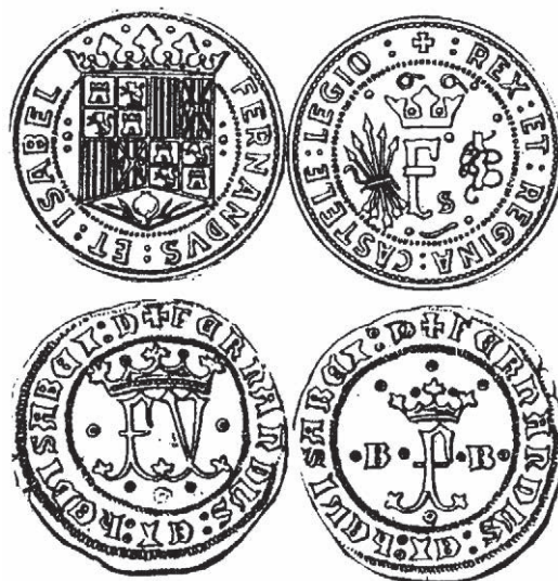
Figura n.º 9. Real de plata y Blanca de vellón para América (post. 1505)

En cuanto al tema del reino de Granada era mucho más delicado, ya que se encontraba integrado totalmente en la Corona de Castilla y nadie hubiera entendido que el Rey Católico mantuviera su gobierno separado del de Castilla, y en las titulaciones diplomáticas nunca se separó del título de Castilla y León. Pero las circunstancias eran tan complicadas y volátiles que nos ha quedado un testimonio muy interesante de este intento de gobierno conjunto de Granada por parte de Fernando y su hija Juana, es una moneda a nombre de ambos, un real de plata de la ceca de Granada, pero que no tuvo continuidad por ser una moneda absolutamente ilegal en muchos sentidos, como vamos a ver brevemente a continuación.