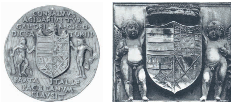
Fig. n.º 18. Armas del Gran Capitán (79)