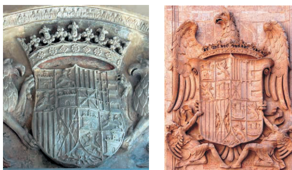
Figuras n.ºs 15. Escudo del Rey Católico en la Aljafería y en Granada

Para terminar con el tema de las monedas napolitanas hay que hablar de una pieza especialmente interesante y todavía más excepcional si cabe, son unas series realizadas en cobre (grano) que a