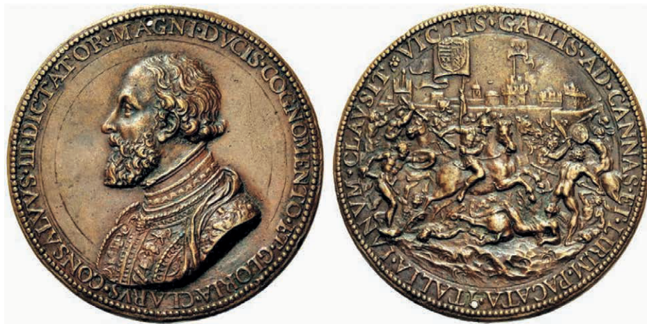
Fig. n.º 17. Medalla dedicada al Gran Capitán (78)

quía Hispánica, y en esos años y en ese lugar concreto, Nápoles, hay que reconocer el protagonismo que en estos hechos tuvo Gonzalo Fernández de Córdoba, el Gran Capitán, el creador de la máquina militar hispana que dominaría los campos de batalla europeos durante casi dos siglos.