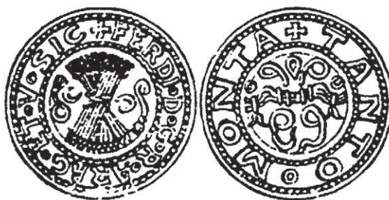
Fig. n.º 16. Grano de vellón

sición a sus políticas por parte del archiduque Felipe, se había resuelto, en este caso con la muerte del protagonista, pero eso era lo de menos, lo importante era que ya no existía.