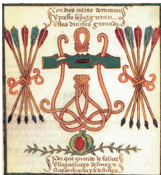
Divisas de los Reyes, Miniaturas del Cancionero de Pedro Marcuello

Estas ideas de que la unidad de ambas Coronas conseguirá la victoria sobre los enemigos de ambas fue muy repetida por cronistas y artistas de la época, y como ejemplo citaremos el famoso manuscrito denominado El Rimado de la Conquista de Granada o Cancionero de Pedro Marcuello, escrito entre 1482 y 1502, es decir en plena guerra y victoria sobre los nazaríes, y cuando coloca la imagen de las divisas de los Reyes (fol.7v) las acompaña de las glosas que dicen: «Con Dios cierto domarán / y presto sojuzgarán / estas divisas Granada», y cuando las vuelve a repetir (fol.39 v.) añade: «Estas divisas, mis reyes / fueron bien consideradas/ y con ffe y Ihesus armadas / Pues qu'el yugo entra con y, flechas con effe doblada, / más ganarán que Granada», animando a los Reyes a seguir unidos en su lucha y a ir más allá de la conquista de Granada, llegando hasta Jerusalén, ejemplo del mesianismo de la época y del constante apoyo de la Providencia divina a los proyectos de los monarcas (29).