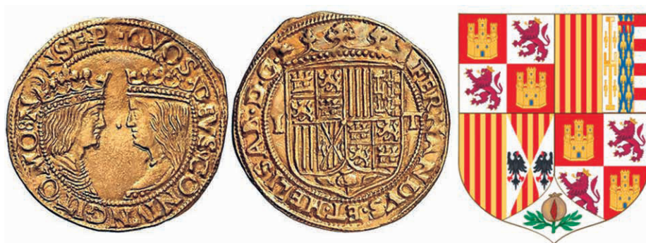
Figura n.º 5. Ducado napolitano de los Reyes Católicos