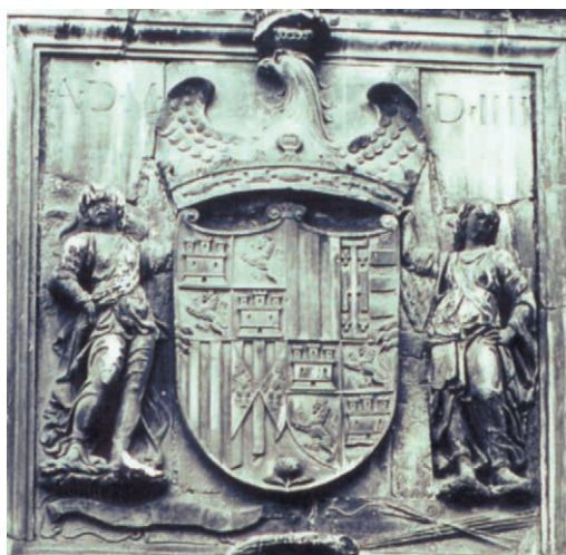
Figura n.º 14. Escudo Real en Nápoles (1504)

fechado en el año 1504, que a sus pies lleva también el yugo y las flechas (Fig. n.º 14), y que al final será el que prevalezca, como puede verse en los escudos del Rey Católico en el Palacio de la Aljafería de Zaragoza o en el de la Catedral de Granada (Fig n.º 15), ambos ya mostrando también las armas de Navarra.