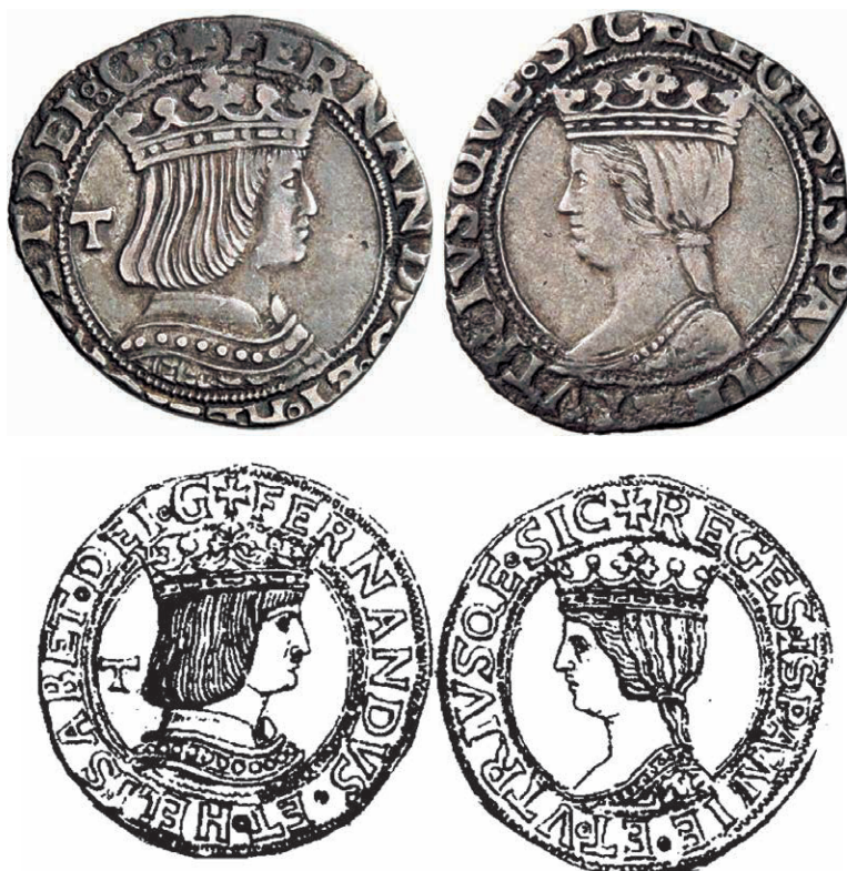
Figura n.º 7. Carlino de los Reyes Católicos

cando que la empresa ha sido conjunta y sólo posible por la unión de todos los recursos de ambas Coronas, cuya unidad debe ser preservada (51).