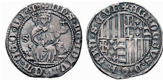
Fig. n.º 2 Carlino de plata del rey Alfonso

trada triunfal en Nápoles el 26 de febrero de 1443, consiguiendo la investidura oficial del reino por parte del papa Eugenio IV poco después (10), en concreto en el 15 julio de 1443 (11), con lo cual ahora era ya rey oficialmente de las «Dos Sicilias», o como aparece en la documentación de Sicilia «citra et ultra Farum» (12), que se explicita también en las monedas, como en este carlino de plata (fig. n.º 2) donde el rey Alfonso se titula Rey de Aragón (ARA) y en siglas SCVF (Sicilia citra et ultra Farum).