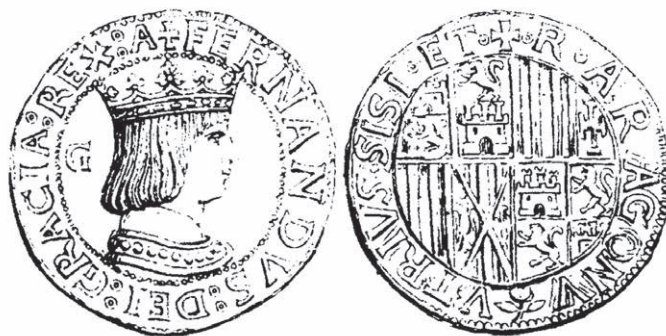
Figura n.º 12. Carlino de Fernando el Católico

Sobre las armas napolitanas del Rey Fernando hay que decir que en un primer momento usa el palado ya comentado de Jerusalén-Anjou-Hungría, como puede verse en la ilustración de la parte inferior del folio 3r. del magnífico Misal-Breviario de Fernando el Cató-