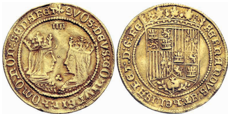
Figura n.º 4. Ducado castellano (Pragmática de 1497)

de placa como en los de plomo), pero en las monedas no aparece hasta la reforma de la Pragmática de Medina del Campo (13 de junio de 1497). Ahora bien, era necesaria una modificación en este diseño, para añadir en el segundo cuartel las armas propias del reino de Nápoles (Jerusalén-Anjou-Hungría), en un partido junto a las barras de Aragón (fig. n.º 5), ordenándolas de la misma manera que lo hiciera Alfonso V en sus primeras monedas tras convertirse en rey de Nápoles (fig. n.º 6) (47).