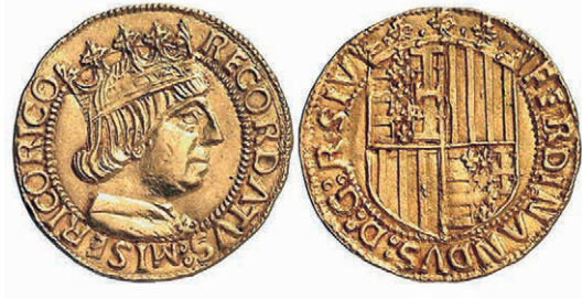
Fig. n.º 3. Ducado de Ferdinando I de Nápoles

Sin entrar en más detalles hay que decir que el largo reinado de Ferdinando fue muy agitado, y la última parte del mismo no iba a ser distinta, a principios de los años 90 el rey de Francia, Carlos VIII, empezó a gobernar directamente, y expresó claramente su intención de reclamar el trono de Nápoles como heredero de los extintos Anjou, y para ello empezó a realizar varias maniobras diplomáticas, mientras que Fernando el Católico, rey de Aragón, cada vez se interesaba más por los asuntos napolitanos y creaba un partido favorable a que este reino se integrara en la Corona de Aragón desplazando a la rama bastarda de la familia (19).