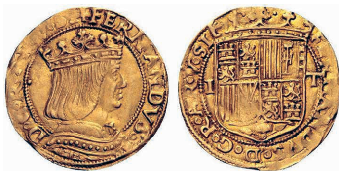
Figura n.º 11. Ducado napolitano de Fernando el Católico

reverso se repiten sólo sus títulos patrimoniales, FERNANDVS D(ei) G(ratia) R(ex) AR(agonum et) V(triusque) SI(ciliae), y en las de plata (figura n.º 12) se sigue el mismo criterio, salvo que las armas del reyno están dentro de un escudo sino que ocupan todo el campo de la moneda, quedando la Granada en la orla de la leyenda, y las armas de Nápoles quedan ahora reducidas a la Cruz de Jerusalén.