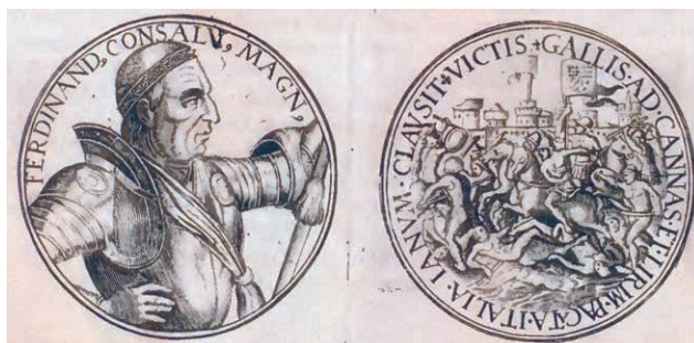
Fig. n.º 1. Dibujo de una medalla dedicada al Gran Capitán (3)

Pero antes de entrar en el tema hay que decir que la moneda es el primer medio de propaganda política de los gobernantes desde su invención y por ello sus tipos y leyendas nos muestran un verdadero programa ideológico, la leyenda nos dice quien gobierna, con qué legitimidad, sobre qué territorios, de forma directa o que pretendía hacerlo, etc., y las imágenes nos informan del aspecto del gobernante, de su heráldica, con la importancia que las armerías tenían en este período (ordenación, simples o ampliadas, etc...), de la protección de la divinidad, etc. Por ello analizar estas piezas desde este punto de visto es mucho más importante de lo que se cree.