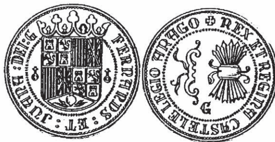
Figura n.º 10. Real a nombre de Fernando y Juana (Granada)

legitimación (Dei Gratia), que es correcta en tanto en cuanto ambos son monarcas por derecho divino de diferentes territorios, pero en el reverso se mantienen exactamente las leyendas de 1497, rey y reina de Castilla, León y Aragón, lo cual no era ya verdad desde 1505, ya que en esa fecha Fernando no es rey de Castilla, su título es únicamente administrador y gobernador del reino, que fue el que siempre usó después de la muerte de doña Isabel en todo tipo de documentos, y Juana no es reina de Aragón, sino únicamente su heredera (de hecho este título de reina le correspondería desde 1506 a la segunda mujer de don Fernando, Germana de Foix) (fig. n.º 10).