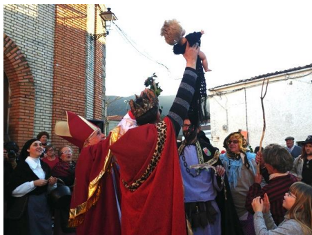
Figura 67. “El Obíhpu Jurdanu” y el anterior “Rey del Antrueju” ensalzan al hijo de “la Tía Rechonchona” para presentarlo al pueblo. Carnaval Hurdano de Azabal en 2017.