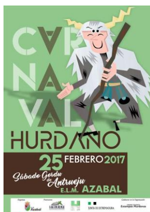
Figura 29. Cartel que anuncia el Carnaval Hurdano de 2017.

Este año, la aldea de Azabal (uno de los núcleos de población más antiguos de la comarca) ha sido la elegida para acoger el “Sábadu Gordu del Antrueju” el día 25 de febrero de 2017 (Fig. 29). El año pasado se celebró en la alquería de Horcajo y el próximo año las carnestolendas tendrán lugar en Casares de Hurdes, según anunció Félix Barroso durante la jornada de Carnaval. A continuación, se presenta la ficha de inventario de PCI.