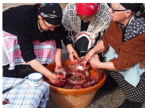
Figura 24. Mujeres elaborando embutidos durante la jornada de Matanza Tradicional Hurdana en Caminomorisco (11 de marzo de 2017). [Facebook]. Publicado el 12 de marzo de 2017. [imagen en línea]. Disponible en: < https://www.facebook.com/photo.php?fbid=857778144361713&set=a.857777457695115.1073741882.100003886061636&type=3&theater > [Consulta: 28 de marzo de 2017]

Al tercer día se hacía lo que se conoce como “la cata”: se asaba un poco de toda la carne que se había condimentado para comprobar cuál era su sabor y valorar si le faltaba sal, etc. Para hacer los chorizos se introducía la carne en las tripas que previamente las mujeres habían cosido ( Fig. 25 ). Algunos metían los chorizos de lomo enteros y otros en fragmentos dentro de las tripas, al igual que la costilla. La morcilla, por ejemplo, se introducía en las tripas que se compraban en mercado de San Andrés, no en las del cerdo sacrificado recientemente.