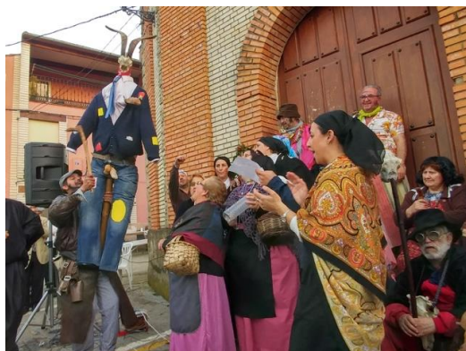
Figura 73. Mujeres suplicando la vida del “Morcillu” con coplas al ritmo de la flauta y el tamboril. Carnaval Hurdano de 2017 en Azabal.