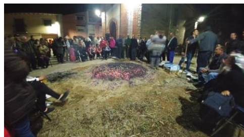
Figura 77. Patatas asándose en las brasas. Carnaval Hurdano de Azabal en 2017.