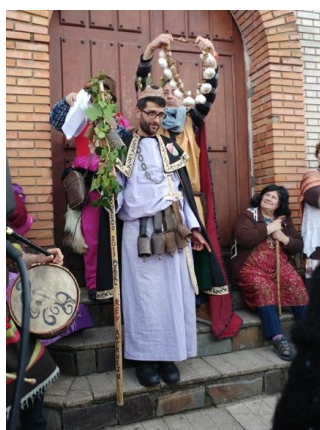
Figura 69. El anterior Rey coloca un collar de ajos al nuevo “Rey del Antrueju”. Carnaval Hurdano de Azabal en 2017.

Entronización del “Rey del Carnaval Jurdano”: Antes de proclamar al “Rey del Antruejo” como tal, se forma un pasacalle para ir a buscarlo a su casa. Allí monta en su “burro antruejo” camino a la Plaza Mayor con otra vestimenta más apropiada de un rey. En este “rejuiju”, el nuevo “Rey del Antruejo” es proclamado como tal por su predecesor mediante la imposición de la corona, el collar de ajos “para proteger al soberano de malos espíritus y una serie de rituales dignos de la Edad Media” (Barroso Gutiérrez, 2017d) ( Fig. 69, 70 ). Una vez proclamado, continúan los bailes y coplas 22 al son de la flauta y el tamboril.