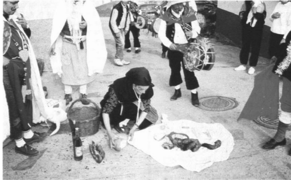
Figura 49. Una “Mózah del Guinálduh” muestra los donativos que se van recogiendo en la cuestación. Fotografía de Jerónimo Roncero Pascual. [imagen en PDF en línea]. Disponible en: < https://repositorio.uam.es/bitstream/handle/10486/8418/45463_9.pdf?sequence=1 > [Consulta: 30 de marzo de 2017]

acompañados de vino y aguardiente. La velada se cerraba con un gran baile a modo de despedida del Carnaval.