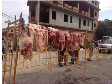
Figura 21. Piezas de carne del cerdo colgadas para su secado en la recreación de la Matanza Tradicional Hurdana. (11 de marzo de 2017).

Los intestinos también se aprovechaban: el delgado para hacer chorizos de carne picada, y el grueso para los chorizos de lomo y de costilla. El estómago, situado en el cuello, se le llamaba “bandujo” y se guisaba con pimentón, sal y aceite y se preparaba como un chorizo.