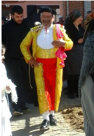
Figura 47. Vestuario del “Toreru” del Carnaval Hurdano de 2017 en Azabal.