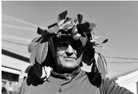
Figura 37. Detalle de los adornos del “Arruverdi” del Carnaval Hurdano de 2017.

“El Obíhpu Jurdanu”: Suele ser un hombre con una vestimenta que imita el atuendo de los obispos ( Fig. 38, Fig. 39 ). Lleva unas alforjas llenas de cagarrutas secas de cabra, que se las ofrece a la gente como si fuesen almendras o avellanas. A ratos, va leyendo un libro viejo y lanza bendiciones a la gente.