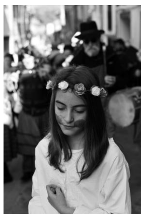
Figura 60. Niña que participó en el “rejuiju” de “la jilandera y loh mocituh” en el Carnaval Hurdano de 2017 en Azabal. [imagen en línea]. Disponible en: < https://www.facebook.com/niconnisiin/photos/a.1449028371835623.1073741885.316929568378848/1449033371835123/?type=3&theater > [Consulta: 16 de marzo de 2017]

“A las buenas mozas y a los buenos mozos que yo los convoco para hacerlos novios”.