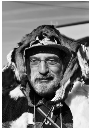
Figura 55. Enzamarrao del Carnaval Hurdano de 2017 en Azabal.