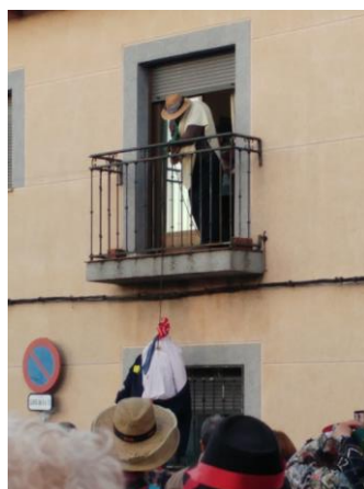
Figura 71. El ahorcamiento del “Morcillu”. Carnaval Hurdano de Azabal en 2017.

Don Perico está malo, ¿qué le daremus? Una zurra de palus, que quedi güeno.” (Barroso Gutiérrez, 2016)