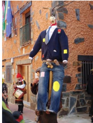
Figura 34. “El Morcillu” a hombros de “el morcilleru”, que lo lleva consigo toda la jornada carnalera. Carnaval Hurdano de 2017 en Azabal.

con mucho simbolismo celebrada desde hace siglos en el municipio de Caminomorisco, aunque su origen parece ser complicado de determinar.