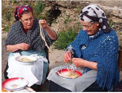
Figura 25. Mujeres cosiendo las tripas del cerdo. (11 de marzo de 2017). [Facebook]. Publicado el 12 de marzo de 2017. [imagen en línea]. Disponible en: < https://www.facebook.com/photo.php?fbid=857777924361735&set=a.857777457695115.1073741882.100003886061636&type=3&theater > [Consulta: 28 de marzo de 2017]