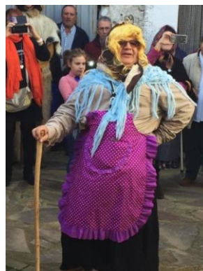
Figura 51. “La Tía Rechonchona” en el Carnaval Hurdano de 2017 en Azabal.

La “Tía Rechonchona”: es un personaje protagonizado por un hombre disfrazado de mujer embarazada, con un pañuelo atado a la cabeza, blusa, falda, delantal y el rostro maquillado. Realiza varias paradas durante toda la jornada quejándose de los dolores de parto. Protagoniza su propio “rejuíju” que consiste en el parto de “la Tía Rechonchona” dando a luz un muñeco de plástico tipo Nenuco .