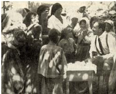
Figura 2. El Rey Alfonso XIII repartiendo alimentos a los hurdanos (1922).

En El rey a Las Hurdes (1922), el Doctor Marañón apunta que el Rey no realizaba viajes solo a las comarcas más atractivas y ricas del país, sino que sentía una preocupación por acercarse a la gente humilde, con pocos recursos, que vive en zonas geográficas difíciles donde hay pobreza ( Fig. 2 ). A través de su diario, cuenta como Alfonso XIII recorre los paisajes por puro interés en conocer el bienestar de la población a la que se debe; la que durante mucho tiempo no tuvo ni voz ni voto y que hasta el momento había sido ignorada por los anteriores monarcas.