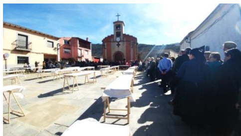
Figura 76. Comida popular celebrada en la Plaza Mayor del pueblo. Carnaval Hurdano de Azabal en 2017.