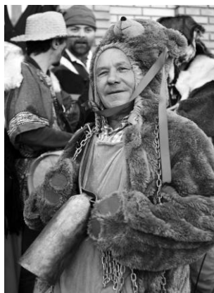
Figura 58. Personaje de “La Osa”. Carnaval Hurdano de 2017 en Azabal.