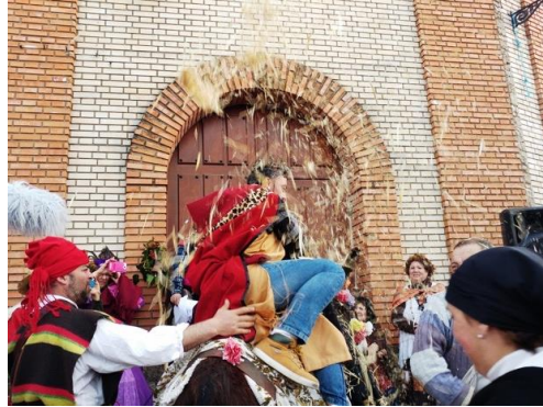
Figura 53. Los “Tíuh de la Paja” arrojando paja al anterior “Rey del Antrueju” en el Carnaval Hurdano de 2017 en Azabal.

de retirar de la vestimenta. Por otro lado, Barroso Gutiérrez (1994) apunta que la paja y el salvado se vuelven un símbolo de fertilidad para el paisaje y sus habitantes.