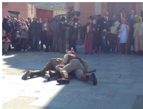
Figura 64. Los “güéh” abalanzándose sobre “la Cricona” en el Carnaval Hurdano de 2017 en Azabal.

Parto de “la Tía Rechonchona” y bautizo de su criatura: su nombre hace referencia a la gordura a causa del embarazo. Se queja continuamente de los dolores de parto ( Fig. 65 ). Entonces acuden las comadres para hacer de parteras y comienzan a lavar, besar y abrazar al muñeco ( Fig. 66 , Fig. 67 ). Este personaje da a luz a un muñeco de plástico (antiguamente, una muñeca de trapo). A continuación, se procede al bautizo de la criatura de “la Tía Rechonchona” a cargo del “Obíhpu Jurdanu” ( Fig. 68 ).