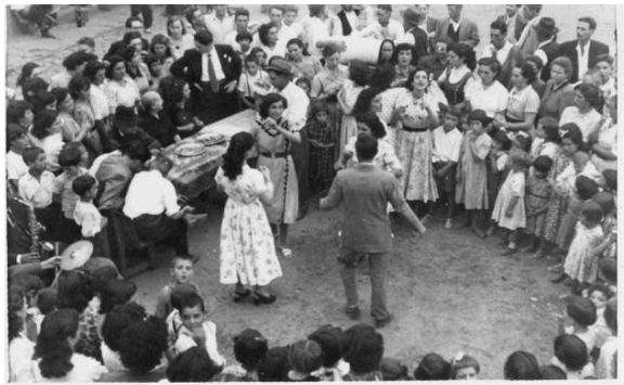
Figura 14. Dos parejas bailan “la espiga” delante de la mesa de los novios. (n.d.). [imagen en línea]. Disponible en: < https://scontent.fmad3-2.fna.fbcdn.net/v/t1.0-9/14590481_992125614233049_7514079635441701136_n.jpg?oh=d8ca64fce35870e9ae803278f4867eb6&oe=5967EB14 > [Consulta: 30 de marzo de 2017]