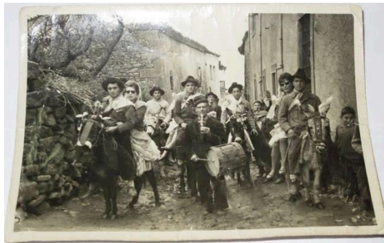
Figura 9. Pasacalle encabezado por un tamborilero. Lo siguen varias parejas montadas en burro y otras personas al fondo (n.d.). [imagen en línea]. Disponible en: < https://scontent.fmad3-2.fna.fbcdn.net/v/t1.0-9/14494620_10206641988558279_7413557038640965042_n.jpg?oh=f679e0ac223e0f18c3418e8747138558&oe=59686CF4 > [Consulta: 30 de marzo de 2017]

El novio se encarga de ir a buscar a su futura esposa a su casa acompañado de sus familiares. El grupo va formando un pasacalle al compás del sonido de la gaita y el tamboril que finaliza su recorrido en la iglesia ( Fig. 9 ).