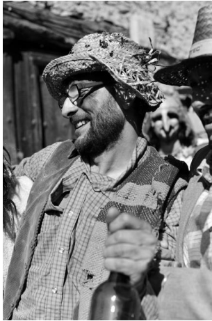
Figura 61. El Rey del Antrueju a la salida de su casa bebiendo vino. Carnaval Hurdano de 2017 en Azabal.

sus umbrales entre cánticos, vítores, “rejínchuh” (jijeos) y un gran bautizo de paja, ceniza o salvado que arrojan sobre él. Le ofrecen la bota para que beba vino sin medida y, con sus descalabrados vestidos, es subido encima de un burro y paseado por las calles del pueblo (Fig. 61, Fig. 62).