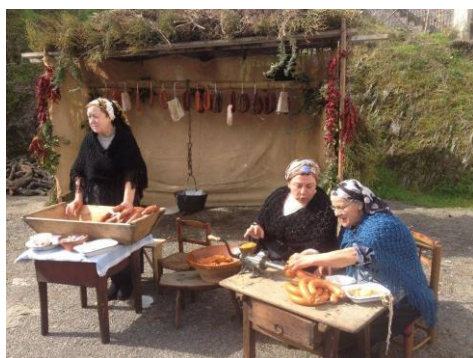
Figura 23. Piezas de carne del cerdo colgadas para su secado en la recreación de la Matanza Tradicional Hurdana. (11 de marzo de 2017). [Facebook]. Publicado el 12 de marzo de 2017. [imagen en línea]. Disponible en: < https://www.facebook.com/photo.php?fbid=857779557694905&set=a.857777457695115.1073741882.100003886061636&type=3&theater > [Consulta: 28 de marzo de 2017]

Durante el segundo día se picaba la carne. Previamente, se separaba la grasa de lo magro de la carne que ya estaba fría. La carne se picaba con una máquina (picadora) que además hacía la forma del chorizo ( Fig. 23 ). A la grasa que se había retirado se le añadía la calabaza, el ajo, la cebolla y el pimentón que se preparó el día anterior para hacer morcilla de calabaza. La elaboración del farinato (morcilla de patata) seguía el mismo procedimiento anterior, pero añadiéndole patata y pan picado. Por otro lado, la sangre del cerdo (que se recogió en el momento del desangrado) se mezclaba con acelga, cebolla, grasa de cerdo y picante y se elaboraba la morcilla de sangre. La carne picada se guisaba con pimentón, ajo, anís y romero para proporcionarle un toque de sabor, además de la sal, para su mejor conservación. De hecho, todo se guisaba para que fuera adquiriendo sabor.