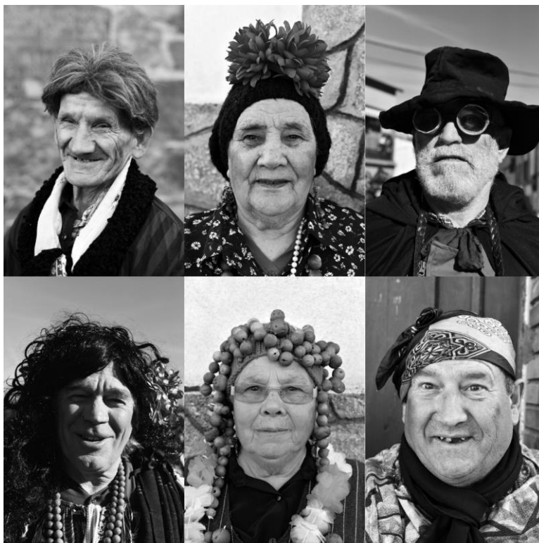
Figura 57. Hurdanos “enzamarraos” y “antruejaos” en el “Sábadu Gordu de Antrueju” de 2017 en Azabal.

incluso los hombres pueden llevar indumentaria femenina ( Fig. 57 ).