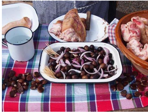
Figura 28. Aceitunas ‘rajás’ en la jornada de Matanza Tradicional Hurdana en Caminomorisco (11 de marzo de 2017). [Facebook]. Publicado el 12 de marzo de 2017. [imagen en línea]. Disponible en: < https://www.facebook.com/photo.php?fbid=857778144361713&set=a.857777457695115.1073741882.100003886061636&type=3&theater > [Consulta: 28 de marzo de 2017]

La Matanza Tradicional Hurdana se ha adaptado a los nuevos tiempos en forma de recreación mediante la escenificación de las distintas actividades que se realizan resumidas en un solo día. En un espacio determinado se instalan distintos puestos destinados a las diversas tareas descritas anteriormente. De esta manera se crea un recorrido delimitado por vallas que ofrece al espectador una visión completa de dichas actividades, como si de un “museo viviente” se tratara. Algo distinto al proceder tradicional es que después de sacrificar al cerdo se subastan sus piezas entre los vecinos y espectadores.