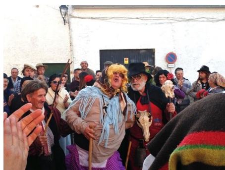
Figura 65. “La Tía Rechonchona” quejándose de dolores de parto acompañada por dos comadres. Carnaval Hurdano de Azabal en 2017.

Parto de “la Tía Rechonchona” y bautizo de su criatura: su nombre hace referencia a la gordura a causa del embarazo. Se queja continuamente de los dolores de parto ( Fig. 65 ). Entonces acuden las comadres para hacer de parteras y comienzan a lavar, besar y abrazar al muñeco ( Fig. 66 , Fig. 67 ). Este personaje da a luz a un muñeco de plástico (antiguamente, una muñeca de trapo). A continuación, se procede al bautizo de la criatura de “la Tía Rechonchona” a cargo del “Obíhpu Jurdanu” ( Fig. 68 ).