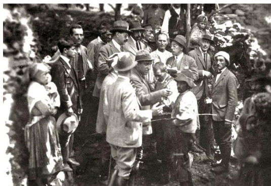
Figura 1. “Marañón reconoce, en presencia del rey Alfonso XIII, a varios enfermos de Casares [de Hurdes], [...], en 1922. Fotografía de José Demaría Vázquez “Campúa. Fundación José Ortega y Gasset - Gregorio Marañón, Madrid.” (Ángela, 4 de abril de 2014) [imagen en línea]. Disponible en: < http://conocemadrid.blogspot.com.es/2014/04/generacion-del-14-ciencia-y-modernidad.html > [Consulta: 11 de julio de 2017]

comarca en 1922 para estudiar in situ los problemas de bocio y cretinismo (y comprobar si realmente existían) y la sanidad en general ( Fig. 1 ). Al finalizar su visita, trasladó sus impresiones a Las Cortes y animó al rey a visitar la zona. El rey llegaría unos meses más tarde.