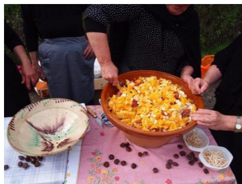
Figura 27. Mujeres preparando la ensalada de naranja durante la jornada de Matanza Tradicional Hurdana en Caminomorisco. (11 de marzo de 2017).

Algunos platos típicos que también forman parte de la matanza son la ensalada de naranja, con chorizo, jamón, ajo, pimentón, aceite y sal (en algunas ocasiones también azúcar) pimentón aceite; y las aceitunas 'rajás' ( Fig. 27, Fig. 28 ).