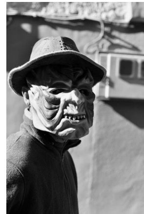
Figura 56. Carantoña del Carnaval Hurdano de 2017 en Azabal. [imagen en línea]. Disponible en: < https://www.facebook.com/niconnisiin/photos/a.1449028371835623.1073741885.316929568378848/1449037285168065/?type=3&theater > [Consulta: 16 de marzo de 2017]

Los Enzamarraos eran, antiguamente, semejantes a las Carantoñas. En la actualidad, no van disfrazados de ningún personaje concreto, si no que simplemente se visten con ropa vieja ( Fig. 55 ).