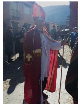
Figura 39. “El Obíhpu Jurdanu” en el Carnaval Hurdano de 2017 en Azabal.

“El Machu Lanú”: También llamado “el Lanú” a secas. Se trata de una misteriosa criatura mitológica hurdana con cuerpo de macho cabrío, voz humana cavernosa y rostro humano (aunque deforme), provisto de cuernos, de complexión corpulenta y que camina de forma bípeda. Antes de aparecer suele levantarse un ligero vendaval. Uno de los hurdanos que supuestamente tuvo