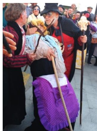
Figura 66. Las comadres avivando a la Tía Rechonchona” cuando ésta se desvanece del dolor. Carnaval Hurdano de Azabal en 2017.