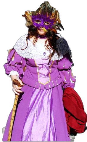
Figura 42. “La Madarma” del Carnaval Hurdano de 2017 en Azabal.

corta simbólicamente la mano derecha con el sable que esta lleva consigo. La mano la llevará escondida bajo la manga del camisón durante un rato. “La Madarma” también baila con los quintos determinadas danzas y les hace desfilar dentro de un ordenado desorden (Barroso Gutiérrez, comunicación personal, marzo de 2017).