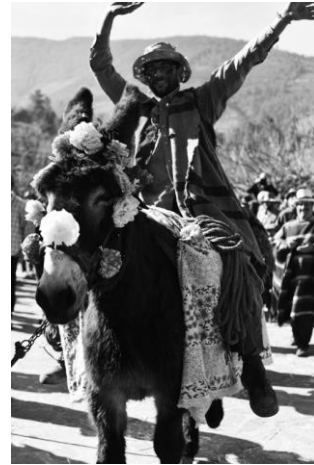
Figura 62. El Rey del Antrueju subido en el “burru antrueju” camino de la Plaza Mayor. Carnaval Hurdano de 2017 en Azabal. [imagen en línea]. Disponible en: < https://www.facebook.com/niconnisin/photos/a.1449028371835623.1073741885.316929568378848/1449033865168407/?type=3&theater > [Consulta: 16 de marzo de 2017]