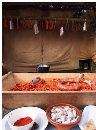
Figura 15. En primer plano, pimentón, dátiles y carne picada; al fondo, chorizos, morcillas y embutidos secándose. Matanza Tradicional Hurdana en Caminomorisco celebrada el 11 de marzo de 2017. [Facebook]. [imagen en línea]. Disponible en: < https://scontent.fmad3-2.fna.fbcdn.net/v/t1.0-9/17156148_1240519846003106_5596662628191066779_n.jpg?oh=1cf6d2ae4071aee21478f10c17e7e04f&oe=59EC677E > [Consulta: 28 de marzo de 2017]