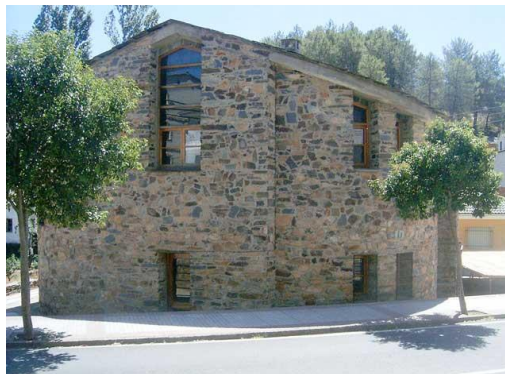
Figura 6. Casa de la Cultura en Caminomorisco en la actualidad (n.d.). Fotografía de autor anónimo. [imagen en línea]. Disponible en: < http://www.mancomunidadhurdes.org/index.php?opcion=adic > [Consulta: 12 de julio de 2017].

A raíz de la visita de los Reyes Eméritos se realizó una inversión para mejorar la infraestructura telefónica y viaria.