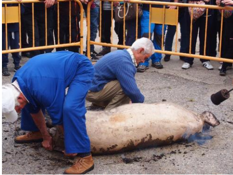
Figura 18. Retirada del pelo y la piel del cerdo con un soplete. (11 de marzo de 2017). [Facebook]. Publicado el 12 de marzo de 2017. [imagen en línea]. Disponible en: < https://www.facebook.com/photo.php?fbid=857789491027245&set=a.857777457695115.1073741882.100003886061636&type=3&theater > [Consulta: 28 de marzo de 2017]

El siguiente paso era retirarle el pelo y la piel. Actualmente se utiliza un soplete, pero tiempo atrás se raspaba con la retama ( Fig. 18, Fig. 19 ); era una labor lenta que se realizaba con el cerdo en el suelo. Estos residuos no tenían ningún uso y se desechaban.