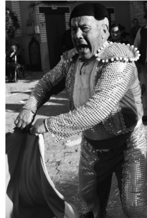
Figura 48. “El Toreru” del Carnaval Hurdano de 2017 toreando al “Toru Bardinu”. [imagen en línea]. Disponible en: < https://www.facebook.com/niconnisin/photos/a.1449028371835623.1073741885.316929568378848/1449041198501007/?type=3&theater > [Consulta: 16 de marzo de 2017]

Las “Mózah del Guinálduh”: Se trata de un grupo de mujeres jóvenes que acaban de cumplir 18 años que, durante los días próximos al Carnaval, acostumbraban a ir casa por casa en algunos pueblos de Las Hurdes, pidiendo el “guinálduh” (aguinaldo). Este donativo normalmente era un chorizo o morcilla pequeños. Las jóvenes se los colgaban de la cintura, de los hombros, como collares, o bien los colgaban de una vara que llevaban entre dos chicas.