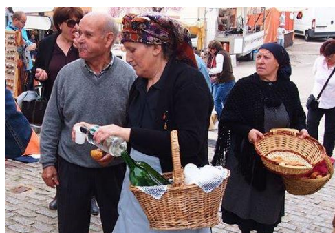
Figura 17. Mujeres ofreciendo aguardiente y dulces tradicionales durante la jornada de Matanza Tradicional Hurdana en Caminomorisco (11 de marzo de 2017).