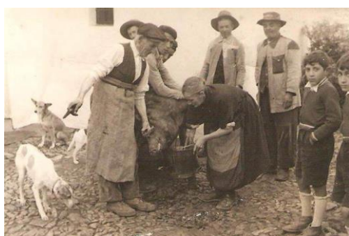
Figura 16. Mujer recogiendo la sangre con un cubo (n.d.).

El día de la matanza empezaba temprano, sobre las 8 de la mañana. Se colocaba un tablón grande de madera de castaño y se subía al cerdo con la ayuda de tres o más personas. Antes de dejarlo sin vida se le ataban las patas para que no diera patadas. A continuación, se le pinchaba con un cuchillo la vena yugular; esto no era tan sencillo y requería técnica. El objetivo era que el cerdo muriera desangrado para que así la carne quedara libre de sangre. Mientras agonizaba (o una vez muerto) una mujer recogía la sangre con un cubo para después hacer morcillas ( Fig. 16 ). Después de comprobar que ya estaba muerto, la mujer del dueño repartía dulces (perrunillas, galletas) a todos aquellos que habían ayudado. El aguardiente no podía faltar al grito de “¡que salga bueno!” ( Fig. 17 ); posteriormente se llevaba la lengua del cerdo al veterinario y éste la examinaba para afirmar que no tuviera ninguna enfermedad. Este brindis expresaba el deseo y la esperanza de que el largo tiempo de crianza del cerdo no hubiese sido en vano.