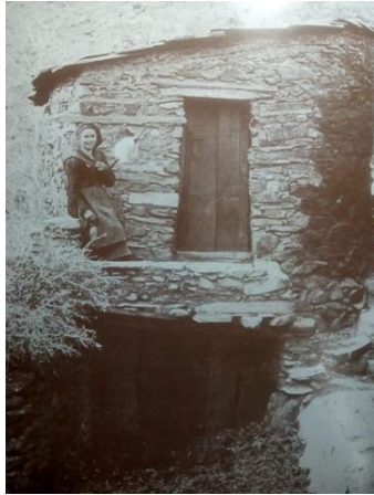
Figura 44. “La Jilaora” “jilandu” (hilando) en un poyete de una vivienda tradicional hurdana, (1911). Fotografía de Vicente Gombau. [imagen en línea]. Disponible en:

Era una mujer que iba con un gran huso y una enorme rueca, hilando algodón o lino (Fig. 45). Estos artefactos se utilizaban para trasladar el algodón enrollado en el huso hacia la rueca, generando el hilo para después poder tejer (Fig. 46).