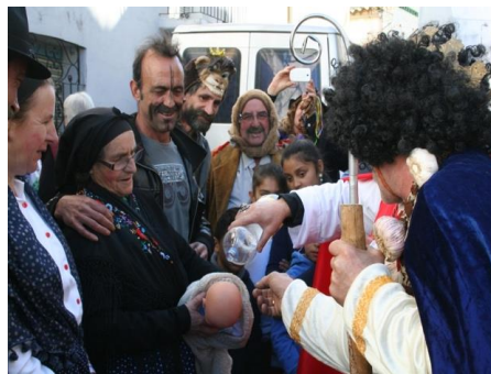
Figura 68. “Rejuiju” del bautizo de la criatura de la Tía Rechonchona en el Carnaval de Ahigal en 2014. Fotografía de José María Domínguez Moreno. [imagen en línea]. Disponible en: < http://planvex.es/web/2017/02/carnaval-jurdano/ > [Consulta: 18 de marzo de 2017]

Entronización del “Rey del Carnaval Jurdano”: Antes de proclamar al “Rey del Antruejo” como tal, se forma un pasacalle para ir a buscarlo a su casa. Allí monta en su “burro antruejo” camino a la Plaza Mayor con otra vestimenta más apropiada de un rey. En este “rejuiju”, el nuevo “Rey del Antruejo” es proclamado como tal por su predecesor mediante la imposición de la corona, el collar de ajos “para proteger al soberano de malos espíritus y una serie de rituales dignos de la Edad Media” (Barroso Gutiérrez, 2017d) ( Fig. 69, 70 ). Una vez proclamado, continúan los bailes y coplas 22 al son de la flauta y el tamboril.