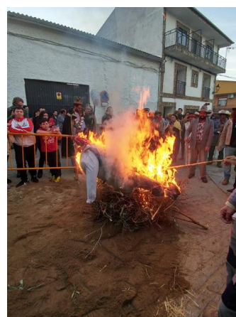
Figura 72. El “Morcillu” arde en la hoguera previamente castrado y ahorcado. Carnaval Hurdano de Azabal en 2017.