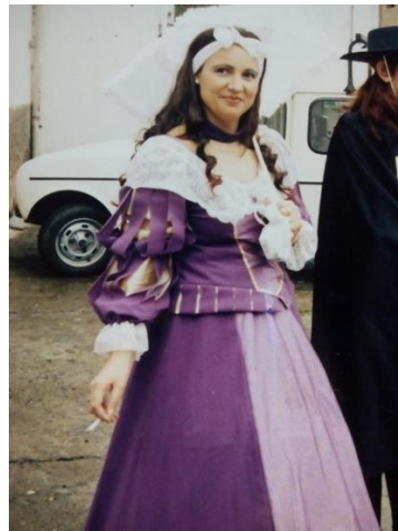
Figura 43. “La Madarma” en el Carnaval Hurdano de 2006 en la alquería de Arrolobos. Fotografía de Félix Barroso Gutiérrez. [imagen en línea]. Disponible en: < http://planvex.es/web/2017/02/rej-del-entruēju-diego-talavan/ > [Consulta: 30 de marzo de 2017]

En su origen, la indumentaria de “La Madarma” era un traje lujoso. Posiblemente, a lo largo de los tiempos, haya tenido una evolución y se haya adaptado a alguna moda de los siglos XVII o XVIII, pues así lo parece, a juzgar por el vestido que ha lucido dicho personaje desde que la memoria colectiva lo conoce (Barroso Gutiérrez, comunicación personal, marzo de 2017).