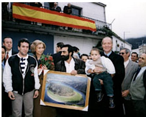
Figura 5. Don Juan Carlos y Doña Sofía durante su visita a Las Hurdes (1998). Fotografía de autor anónimo. [imagen en línea]. Disponible en: < https://www.timetoast.com/timelines/las-hurdes > [Consulta: 12 de julio de 2017].