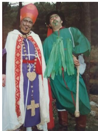
Figura 38. “El Obíhpu Jurdanu” y “el Arruverdi” de un anterior Carnaval Hurdano.

“El Obíhpu Jurdanu”: Suele ser un hombre con una vestimenta que imita el atuendo de los obispos ( Fig. 38, Fig. 39 ). Lleva unas alforjas llenas de cagarrutas secas de cabra, que se las ofrece a la gente como si fuesen almendras o avellanas. A ratos, va leyendo un libro viejo y lanza bendiciones a la gente.