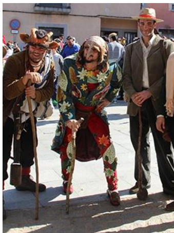
Figura 33. El “zajuril” (centro) en el Carnaval Hurdano de Azabal de 2017.

El “Zajuril”: en Las Hurdes, los “zajuriles”, según recoge Equipo Infinito (2016), eran hombres sabios, respetados por la comunidad de cada alquería, que guardaban y transmitían la sabiduría popular hurdana ( Fig. 33 ). “Se trataba de hombres considerados buenos y justos que ponían en paz las disputas y eran concedores del "derecho consuetudinario" hurdano. Poseían amplios conocimientos sobre medicina popular, artesanía y costumbres hurdanas”. Hasta en ocasiones se les consideraba con facultades para la adivinación, la videncia. Pese a esas facetas de hechiceros o videntes, su relación con los habitantes de cada alquería no era distante, sino que estaban en el centro de la comunidad hurdana y compartían muchos de sus conocimientos con los demás. Su apariencia es mitad macho cabrío, mitad humana, su rostro presenta una deformidad, camina erguido y su voz es cavernosa y aterradora.