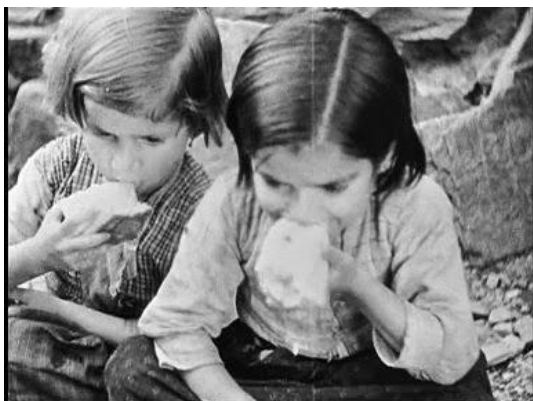
Figura 3. Niñas comiendo el pan que han mojado en el agua de un río. Captura de Las Hurdes, tierra sin pan (08:15) de Luis Buñuel. [imagen en línea]. Disponible en: < https://lbunuel.blogspot.com.es/2014/04/las-hurdes-tierra-sin-pan-terre-sans.html > [Consulta: 11 de julio de 2017].

Teniendo en cuenta que se trata de un director surrealista, las escenas también pueden entenderse como provocadas o manipuladas para conmover al espectador con motivo de la grabación (por ejemplo, la escena de las niñas mojando el pan en el río o cuando la cabra se cae del monte) ( Fig. 3, Fig. 4 ). Quizás Buñuel quería denunciar el olvido y las difíciles condiciones que todavía padecían ciertos lugares de España y cuyas instituciones ignoraban.