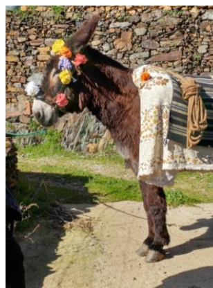
Figura 59. El “Burru Antrueju” del Carnaval Hurdano de 2017 en Azabal.

“ La Mona ”: se disfrazaba con pieles, careta o rostro tizado y robo. Su cometido era hacer piruetas y gestos obscenos mientras el “Amo de la Mona” toca una sartén para que baile. Protagoniza el “rejuju” de “La Mona”, una danza ritual, el Martes de Carnaval. Parece ser que este personaje se ha perdido puesto que no se ha presenciado en el Carnaval de 2017 en Azabal, pero está documentado por Barroso Gutiérrez (2017b, 1994).