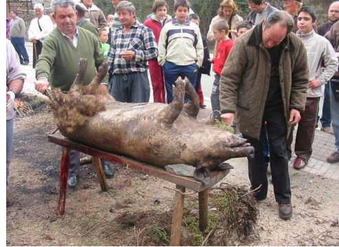
Figura 19. Muestra de cómo se retiraba antaño el pelo y la piel del cerdo con la retama. (11 de marzo de 2017).

Cuando el cerdo ya estaba pelado se subía de nuevo a la mesa y se procedía a despiezarlo. Aunque parezca lo contrario, esto exigía un orden riguroso y destreza por parte de la persona para sacar las piezas enteras. En primer lugar, se realizaba un corte vertical y se extraía la manteca; ésta se fundía, se le añadía pimentón y un poco de azúcar y se untaba en el pan. Otro uso de la manteca no era culinario. Se utiliza en la elaboración del jabón casero en el medio rural y es uno de los principales ingredientes junto con la sosa caustica. La carne del vientre era la siguiente pieza a retirar. Existe una anécdota que dice que, si el vientre no se rompía, se podía beber un vaso de vino; si, por el contrario, se rompía, no había vino. Una vez sacado el vientre, las mujeres llevaban las tripas al río para lavarlas porque se utilizaba más tarde para hacer embutidos.