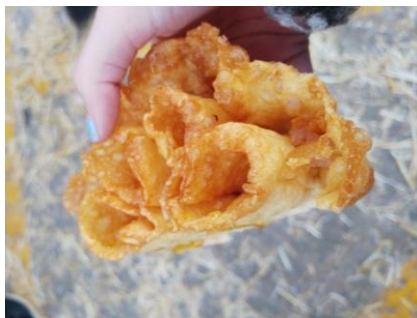
Figura 74. Floreta, un dulce tradicional hurdano. Carnaval Hurdano de Azabal en 2017.