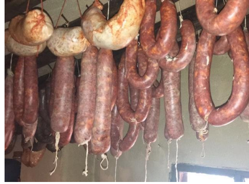
Figura 26. Chorizos y farinatos colgados en vigas durante el tiempo de secado. (2017).

Según se iban elaborando los chorizos se colgaban en la viga del techo, mientras que en el suelo de la cocina se hacía fuego para que el humo los fuese secando y esto tenía que ser así durante veinte días ( Fig. 26 ). Pasado este tiempo, se descolgaban y se guardaban en ollas grandes de barro las morcillas, los farinatos y los chorizos añadiéndoles aceite, y de esta manera se conservaban tiernos durante todo el año evitando que se endurecieran.