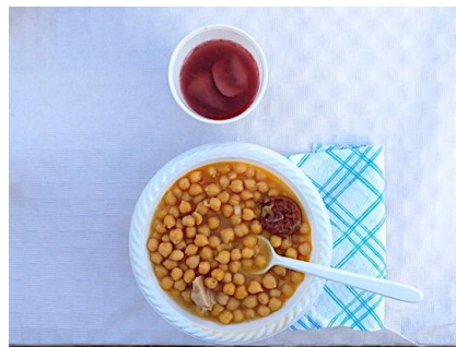
Figura 75. Potaje de garbanzos con berzas y patas de cerdo. Carnaval Hurdano de Azabal en 2017. Fotografía propia.