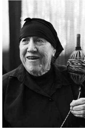
Figura 45. “La Jilaora” del Carnaval Hurdano de 2017 sujetando la rueca con el tejido ya convertido en hilo. Fotografía de Claverg. [imagen en línea]. Disponible en:

< http://planvex.es/web/2017/07/antrueios/ > [Consulta: 21