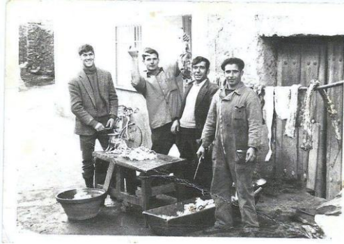
Figura 20. Vecinos hurdanos colgando las distintas piezas de carne del cerdo en una vara de madera. (n.d.). Fotografía de autor anónimo. [imagen en línea]. Disponible en: < http://patriciaiberico.blogspot.com.es/2015/01/el-sacrificio-del-cerdo-iberico-matanza.html > [Consulta: 28 de marzo de 2017]

comer, porque después se pelaban y se cocían las calabazas que se habían cogido del huerto. También se preparaba una olla con cebolla picada y ajos pelados para que al día siguiente ya estuviera todo preparado para hacer las morcillas.