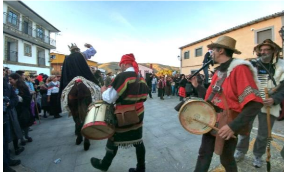
Figura 30. El “Rey del Antrueju” montado en burro una vez ha sido proclamado rey. Le siguen los tamborileros y otros personajes bailando. Carnaval Hurdano de 2017 en Azabal. Fotografía propia.