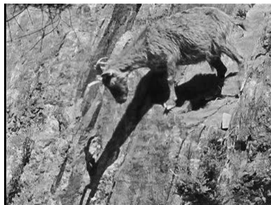
Figura 4. Cabra precipitándose por un barranco. Captura de Las Hurdes, tierra sin pan (13:19) de Luis Buñuel. [imagen en línea]. Disponible en: < https://lbunuel.blogspot.com.es/2013/09/las-hurdes-documental-manipulacion.html > [Consulta: 11 de julio de 2017].

Lo mostrado en el video queda contrastado con las aportaciones orales de mi abuela, a quien mis bisabuelos le aclaraban que algunas situaciones que proporcionaba documental no eran tan drásticas. Por ejemplo, en el video se muestra como los animales domésticos (el burro, las gallinas, etc.) comparten las mismas estancias con los humanos. Sin embargo, en casa de mis bisabuelos el corral está contiguo a la casa; existía una separación entre la cuadra y la estancia dedicada a la vida familiar.