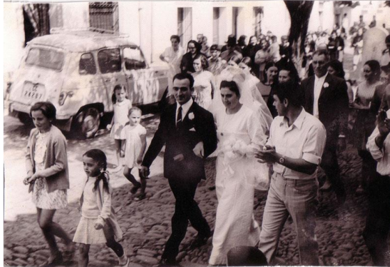
Figura 7. Los novios acompañados de familiares, amigos y vecinos durante el pasacalle previo a la entrada en la iglesia. (n.d.). Fotografía de autor anónimo. [imagen en línea]. Disponible en: < http://www.mancomunidadhurdes.org/index.php?opcion=boda > [Consulta: 4 de abril de 2017]