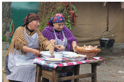
Figura 22. Mujeres curando las patas y las orejas del cerdo en la recreación de la Matanza Tradicional Hurdana. (11 de marzo de 2017).

El jamón y el tocino se salaban para curarlos; las patas y las orejas también se curaban para después añadirlas a los cocidos, así como también el hueso del espinazo ( Fig. 22 ).