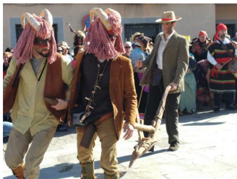
Figura 63. En primer plano, los “güéh”; detrás, el “araol del rozu” Carnaval Hurdano de 2017 en Azabal.