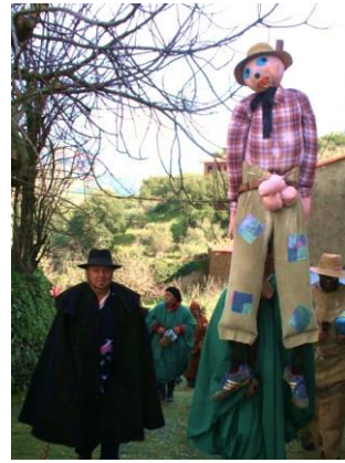
Figura 35. “El Morcillu” por las calles de Rivera Oveja, en el Carnaval Jurdanu de 2013. Fotografía de José María Domínguez Moreno. [imagen en línea]. Disponible en: < http://planvex.es/web/2017/02/carnaval-jurdano/ > [Consulta: 15 de marzo de 2017]

“El Arruverdi” : era un personaje que durante el invierno vivía en las montañas, en solitario y alejado de la civilización. Solo se le veía cuando llegaba el Carnaval. El “Sábadu Gordu de Antrueju” bajaba al pueblo a desearle a los vecinos que tuvieran una buena cosecha. Su vestimenta se basa en el color verde: lleva sombrero y cinturón cubierto con hojas y una especie de escoba (Fig. 36, Fig. 37).