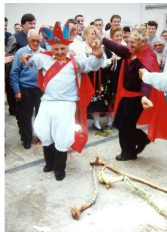
Figura 32. Danza de “loh garróti” (los garrotos), ejecutada por antiguos reyes del antruejo en la alquería de El Cabezo. Fotografía de Félix Barroso Gutiérrez. [imagen en línea]. Disponible en: http://planvex.es/web/2017/02/rej-del-entruerju-diego-talavan/ [Consulta: 31 de marzo de 2017]

Este “Rey Jurdanu” actúa más como un líder del pueblo o un rey republicano que como un monarca, según Barroso Gutiérrez (2017d), y lo justifica de la siguiente manera: