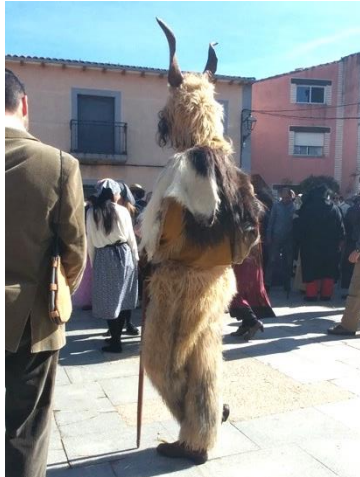
Figura 40. Apariencia de "El Macho Lanú" en el Carnaval Hurdano de 2017 en Azabal.

Aparte de esta visión siniestra del personaje, también está la festiva. “El Macho Lanú” como disfraz, que figura como uno de los personajes del carnaval hurdano.