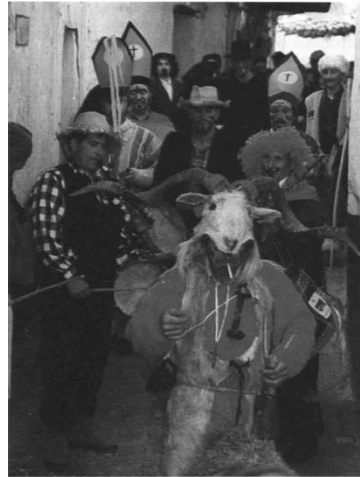
Figura 41. El Carnaval por las calles de Caminomorisco. En primer plano, "El Macho Lanú". Fotografía de "Kini". [imagen en PDF en línea]. Disponible en: < https://repositorio.uam.es/bitstream/handle/10486/8418/45463_9.pdf?sequence=1 > [Consulta: 30 de marzo de 2017]

Mitos como el del “Machu Lanú”, que abre los pasacalles carnavaleros y que, tal y como recoge Barroso Gutiérrez (2017c), “viene a ser una sarcástica animalización del personaje que lo representa (se ironizan a los seres legendarios y monstruosos que habitan en las espesuras de los montes porque se les teme)”.