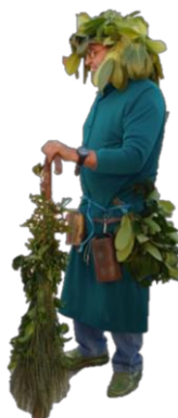
Figura 36. Apariencia de "El Arruverdi" en el Carnaval Hurdano de 2017 en Azabal.

“El Arruverdi” : era un personaje que durante el invierno vivía en las montañas, en solitario y alejado de la civilización. Solo se le veía cuando llegaba el Carnaval. El “Sábadu Gordu de Antrueju” bajaba al pueblo a desearle a los vecinos que tuvieran una buena cosecha. Su vestimenta se basa en el color verde: lleva sombrero y cinturón cubierto con hojas y una especie de escoba (Fig. 36, Fig. 37).