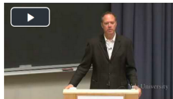
Video introductorio acerca del carácter de la disciplina: What is political philosophy? (Prof. Smith, Yale)