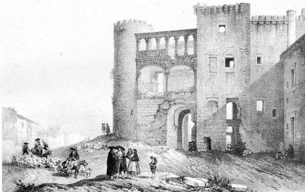
Fachada oeste del castillo de Alba de Tormes hacia 1850. Villaamil

Sin duda, además del hallazgo de un busto de marmol del III Duque de Alba perdido con los avatares de la Guerra de la Independencia, como primer y principal resultado de la excavación arqueológica hay que considerar el hecho de haber puesto a la luz la totalidad de las estructuras correspondientes a la planta baja de dos de las crujeas (norte y oeste) del castillo, que habían estado totalmente cubiertas de escombros hasta entonces. Antes de que comenzasen los trabajos, de lo que fue un gran edificio fortificado sólo quedaba en pie, en la totalidad de su altura, el denominado Torreón de la Armería —de tres plantas, entre las que destaca la primera o central, totalmente decorada con sobresalientes frescos renacentistas que representan escenas de la batalla de Mühlberg, protagonizada, entre otros personajes, por el propio III Duque de Alba.