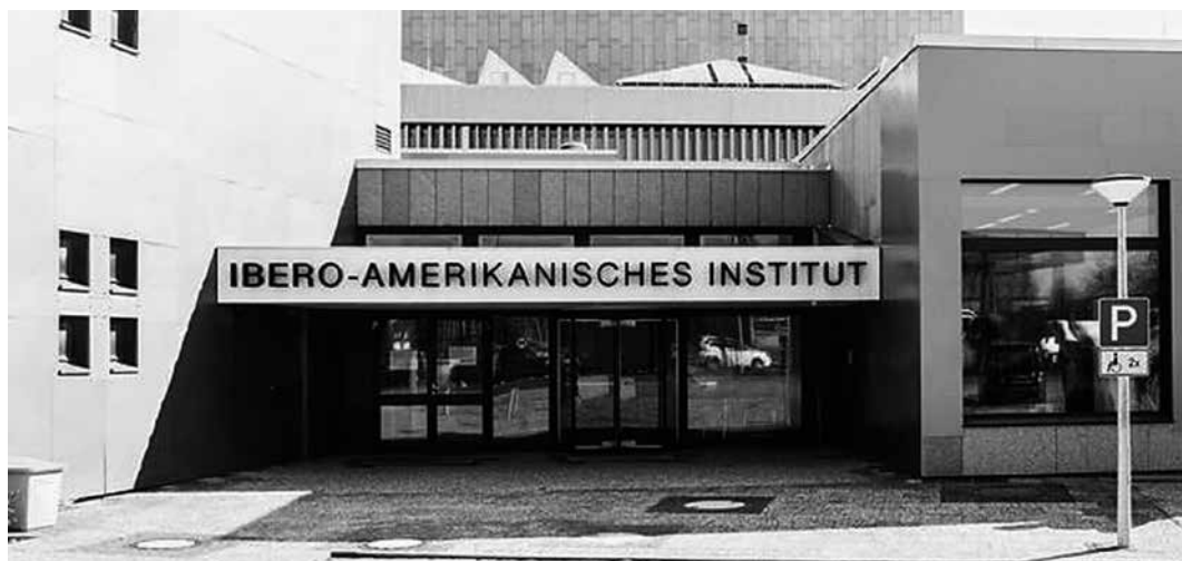
Instituto Iberoamericano de Berlín

vela popular argentina. El libro está magníficamente ilustrado con las imágenes de portadas de muchos y variados coleccionables. Según información oficial facilitada por la IAI 4 , la CFENPE cuenta con unos 50.000 títulos, la mayor parte pertenecientes al género de novela popular editada en España, pero también hay títulos procedentes de Argentina, México, Estados Unidos y Francia. La colección está estructurada en bloques cronológicos: 1) El primero comprende títulos que se publicaron durante la segunda mitad del siglo XIX y que incluyen coplas, aleluyas, romances de ciego y folletines insertos en prensa diaria, revistas especializadas y novelas publicadas por entregas que se solían vender por suscripción. 2) El segundo bloque es la colección que corresponde con la Edad de Plata de