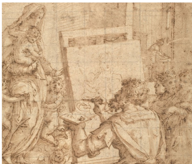
FIGURA 3. San Lucas pintando a la Virgen (fragmento). Giorgio Vasari (1567-1572). Lápiz, pluma, aguada y tinta parda, 264 x 214 mm. D001563. Museo Nacional del Prado, Madrid.