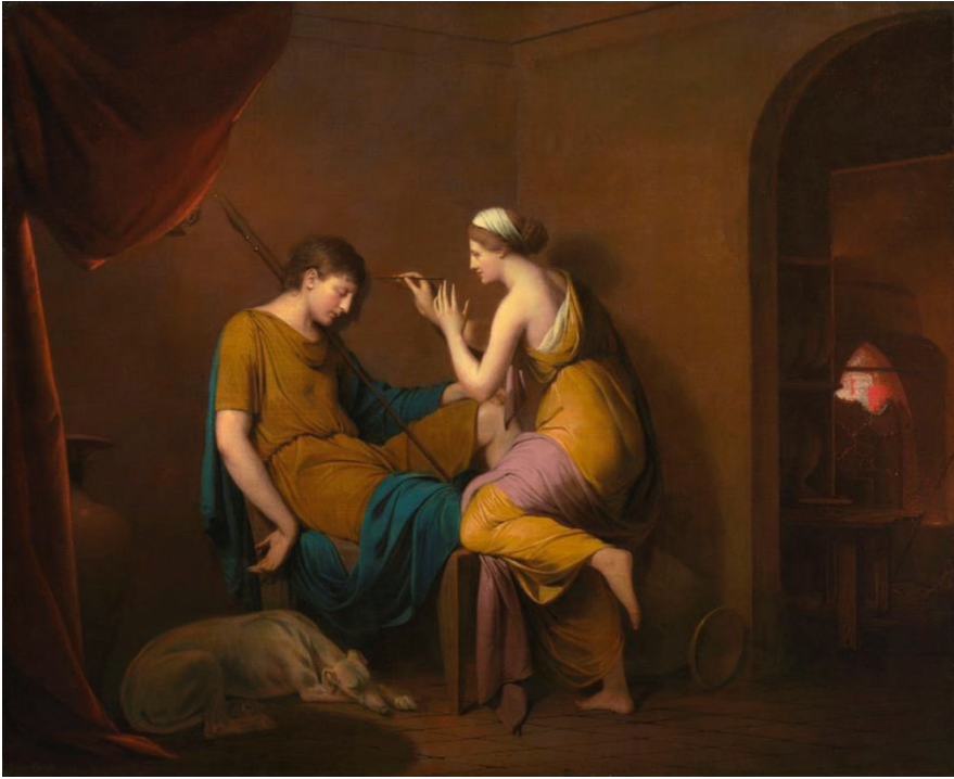
FIGURA.1: Joseph Wright of Derby. La doncella de Corinto . 1782-84. National Gallery of Art, Paul Mellon Collection. Washington