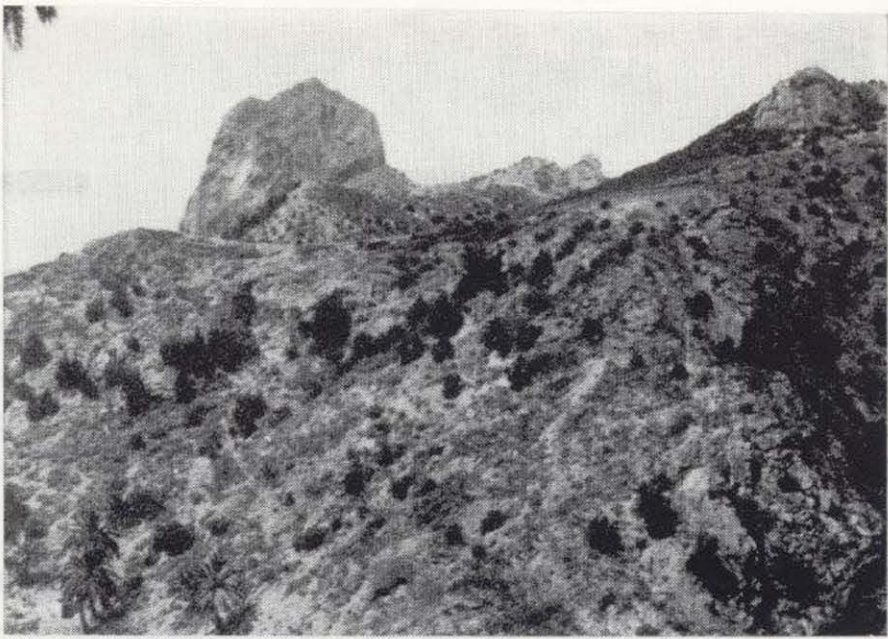
Figura 2.—Panorámica de las laderas de la Presa de la Encantadora.