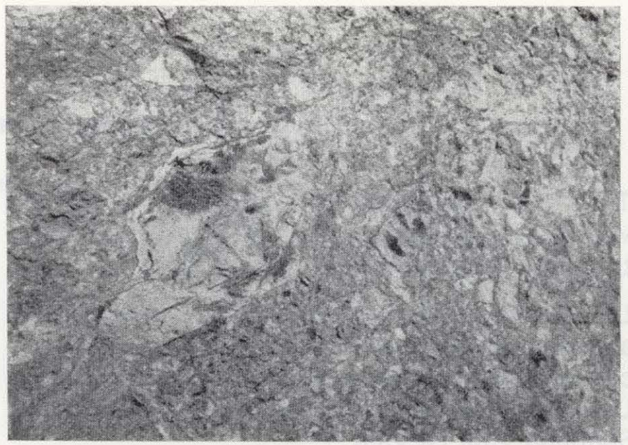
Figura 3.—Detalle de brecha tectónica en el borde de la depresión.