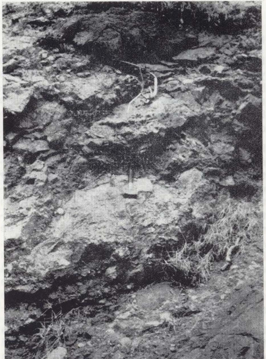
Figura 5.—Detalle de los bloques, algunos de ellos trozos de diques, en el debris-avalanche en el barranco Cañada de los Menores.