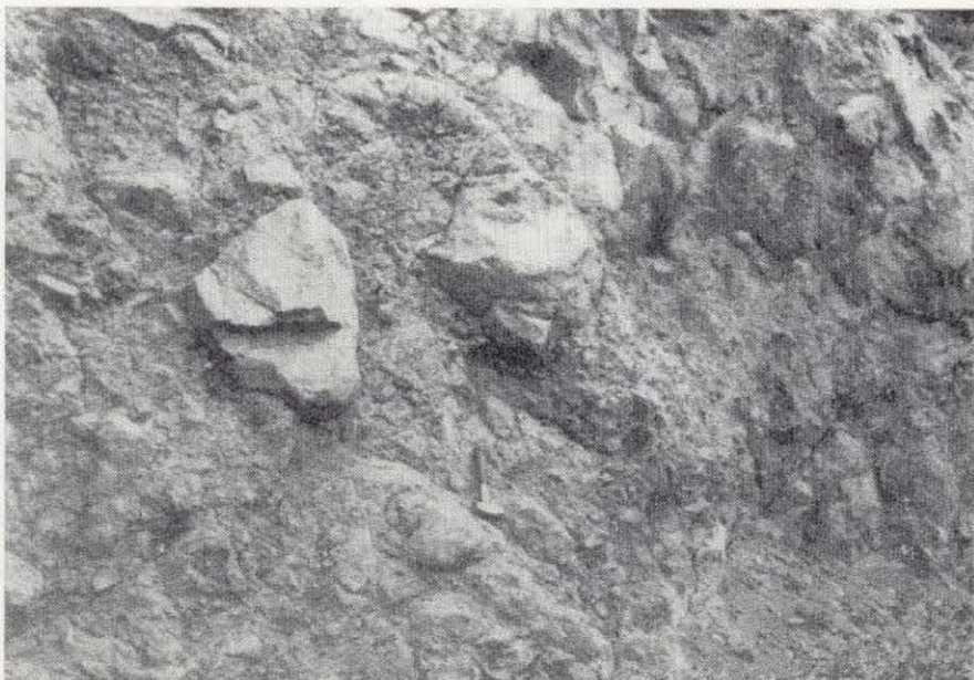
Figura 6.—Aspecto caótico de los depósitos de debris-avalanche en el barranco de El Ingenio.