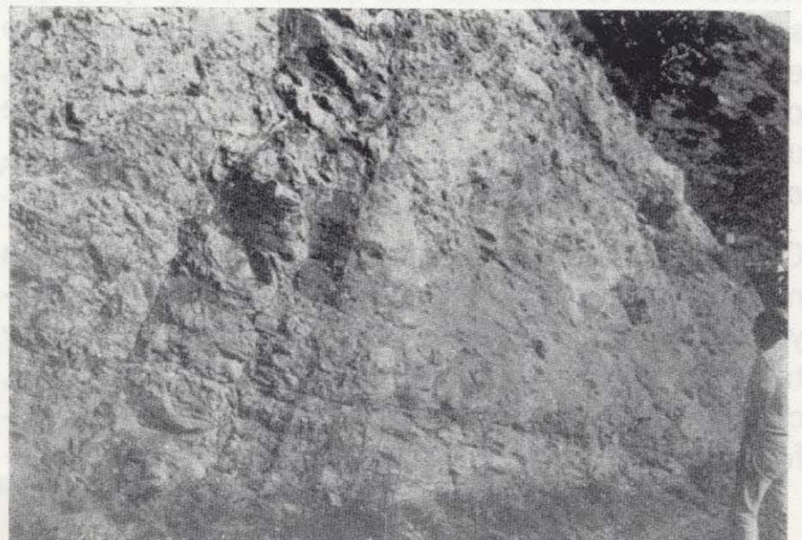
Figura 7.—Dique de composición traquifonolítica atravesando a brechas tectónicas del borde de la caldera.