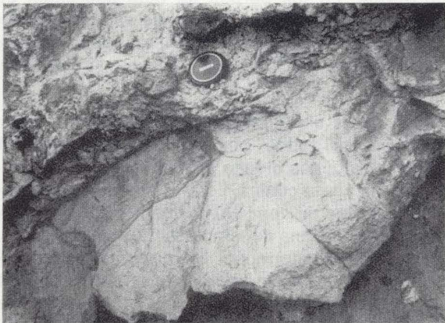
Figura 4.—Contacto discordante entre brechas piroclásticas, en la parte inferior, y depósitos de tipo debris-avalanche encima.