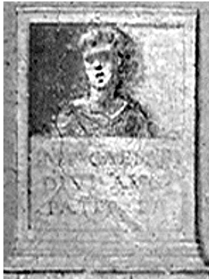
Fig. 4. G. BELLINI, Pala di Pesaro, Predella di San Terenzio, Olio su tavola, 40×36 cm, 1471-1474 (particolare).

Il testo non pare trovare una totale corrispondenza con epigrafi note, a meno di non apportare, come vedremo, alcune modifiche, e presenta, come forse quello del disegno del Louvre e del