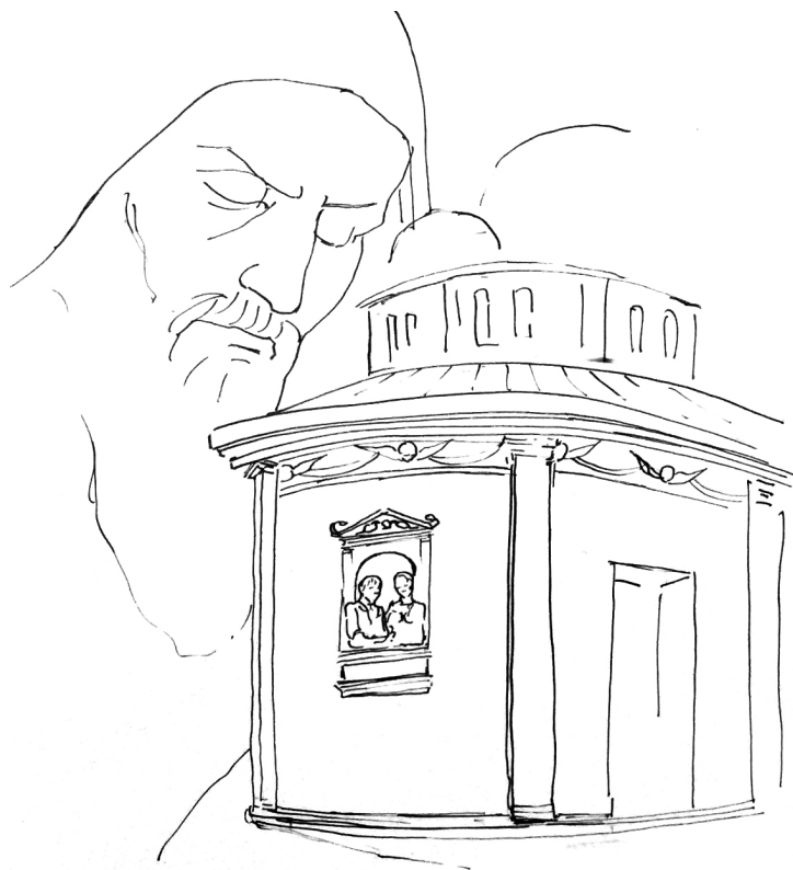
Fig. 1. Rilievo al tratto del particolare dell'opera conservata alla Accademia di Venezia.

Recentemente (18) è stata richiamata l'attenzione sul gusto antiquario del Bellini in relazione ad alcuni rilievi, collocati sulle balaustre poste dietro alla figura del Cristo nel Sangue del Redentore oggi custodito presso la National Gallery di Londra (Fig. 2) rilevandone la possibile relazione che intercorre tra elementi di questo dipinto ed un disegno, o meglio, direi un centone di disegni a carattere mitologico e antiquario, conservato al Louvre (inv. RF 524) e attribuito ora a Jacopo Bellini (19), ora al figlio Giovan-