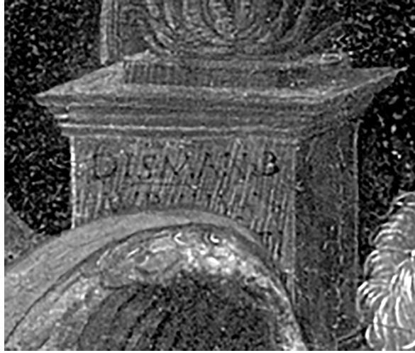
Fig. 2. G. BELLINI, The Blood of the Redeemer , Egg on poplar, 47×34,3 cm, 1460-65 (particolare) © The National Gallery, London.

ni. A favore di una attribuzione se non a Giovanni perlomeno alla sua cerchia si è detto recentemente lo Eisler (20). Effettivamente è da rilevarsi una visibile discrepanza stilistica tra il disegno del Louvre ed il celebre quaderno di disegni, sempre conservato al Louvre, certamente attribuibile a Jacopo Bellini.