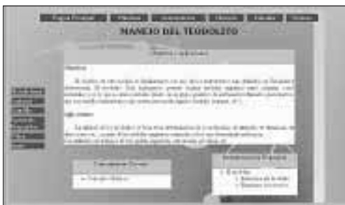
Figura 3. Presentación de una práctica experimental