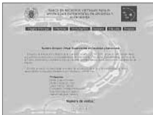
Figura 1. Primera página del portal NAVEGA

El resultado final del proyecto que presentamos ha sido la elaboración de un portal ( http://www.mat.ucm.es/~grc/astrologia_-