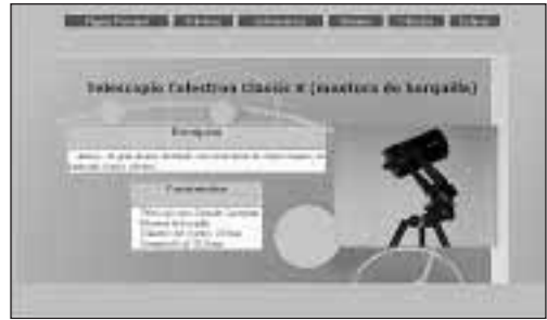
Figura 4. Ejemplo de presentación de la instrumentación astronómica