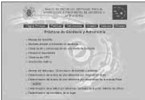
Figura 2. Página de las prácticas experimentales de Geodesia y Astronomía

A través de NAVEGA, el alumno puede encontrar un conjunto de prácticas experimentales de Geodesia y Astronomía para las que se explican detalladamente: los objetivos de la práctica, los conocimientos previos necesarios, el proceso de realización de la práctica, el desarrollo del procesado de los datos y la presentación de los resultados. Asimismo para cada una de ellas se incluye: información digi-