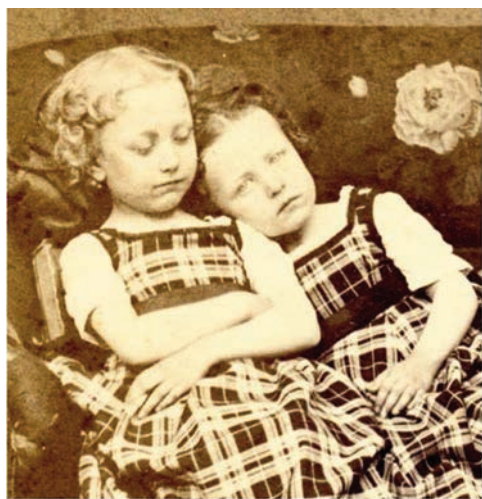
F1 Dos niñas

¿Cuál es la verdad de las dos niñas de la imagen? ¿Cuál de las dos yace ausente? La mirada de una de ellas se clava en los ojos del espectador exigiendo su verdad. O su ausencia (F1). La fotografía aprisiona sus almas y crea la esperanza de que las pequeñas parecen realmente presentes, permitiendo la ilusión de una relación “como si estuvieran ahí”. Hay algo de escenificación simbólica en esta fotografía ante la que, el observador intruso, no es capaz de precisar cuál de ellas es el cuerpo-recipiente. La mirada vaga de una a otra, se detiene en la composición, en la colocación en oblicuo de las niñas, en como una deja reposar su cabeza sobre el hombro de la otra, recostada sobre un libro, posiblemente el que estaba leyendo antes de posar junto a su hermana muerta. Ella es la viva, borrosa ante el enviste del enfoque fotográfico, la otra es la muerta, nítida al foco del objetivo, no se mueve. Y, sin embargo, la escenifica-