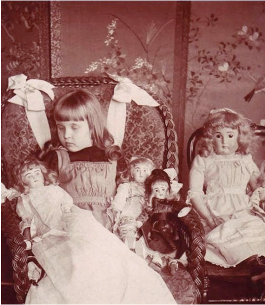
F5 Una niña con sus muñecas

tener ningún significado oculto, sino simplemente una incorporación de aquellos objetos más habituales en la vida del niño. Hay que destacar que el niño difunto suele estar representado bajo la tipología de “como vivo” y posiblemente el hecho de incluir estos elementos tenga mucho que ver con la idea de simular su vida diaria” (Cruz, 2010:108).