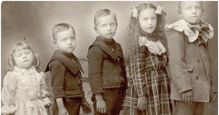
F2 Tres niños, dos niñas

Hay una paradoja inexcusable en la fotografía de difuntos: intentar conservar la imagen viva del muerto a través del registro del fallecido. La foto ya no habla de "quien fue" en el conjunto de la familia, sino de "quien ya nunca será" miembro de ese grupo familiar (F2). La niña vestida de blanco "es" durante la toma, representa la presencia-ausencia, y dejará de "ser" una vez tomada la fotografía.