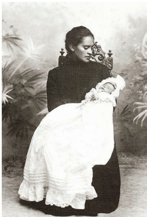
F4 Una madre con su bebé

Este tipo de fotografías representan la finalización de la relación doliente-muerto (madre-hijo) siendo imágenes concluyentes, sin titubeo; son imágenes que obligan al doliente primero, a enfrentarse a la realidad de la muerte y después, a transitar la ascensión de la pérdida. La fotografía trasciende lo puramente visual y transforma al muerto (cuerpo-recipiente) en no vivo (espíritu-ausente) dándonos un lugar (la propia imagen) donde depositar nuestro dolor y donde iniciar nuestro proceso privado de duelo, llorando la pérdida y preparando nuestra memoria para un ejercicio de recuerdo que se relaja con el tiempo.