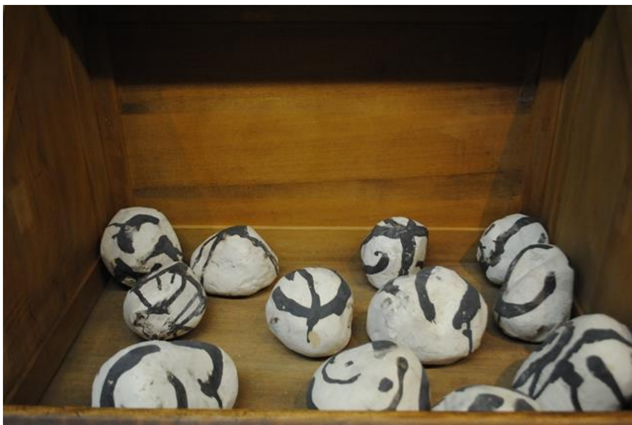
Piedras de cerámica-gres con engobes de porcelana escritas a modo de caligrafía oriental