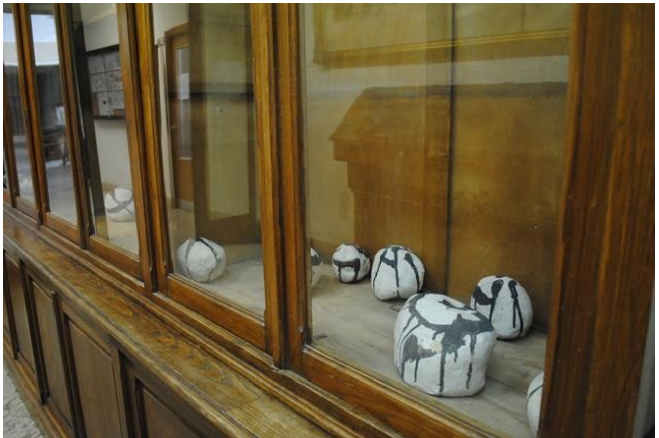
Piedras de cerámica-gres con engobes de porcelana escritas a modo de caligrafía oriental