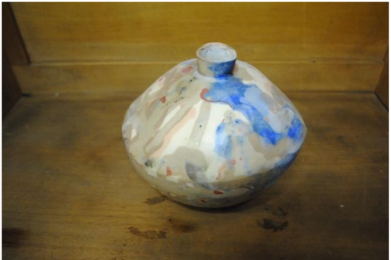
Pieza de cerámica