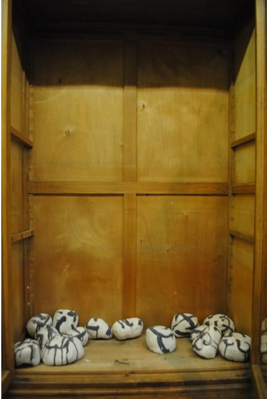
Piedras de cerámica-gres con engobes de porcelana escritas a modo de caligrafía oriental