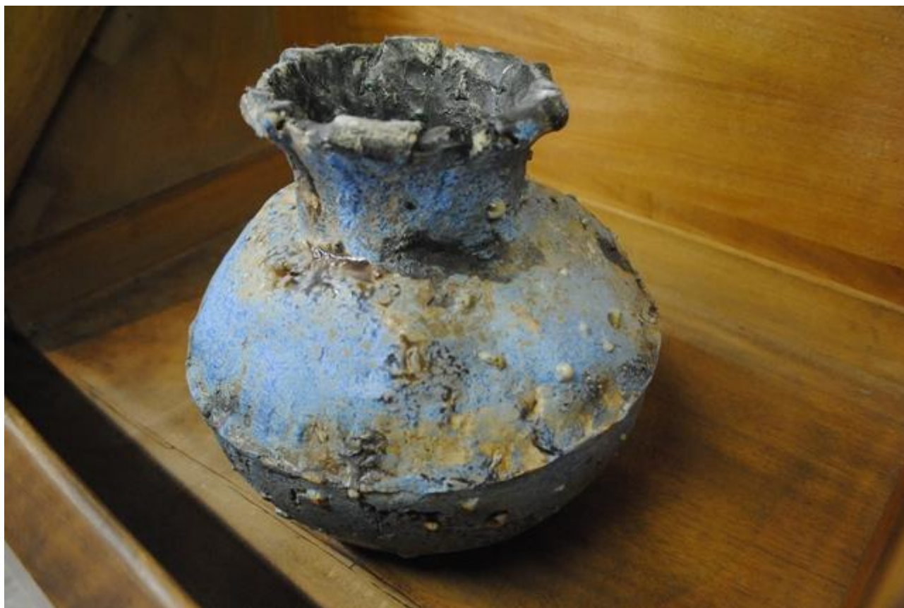
Pieza de cerámica