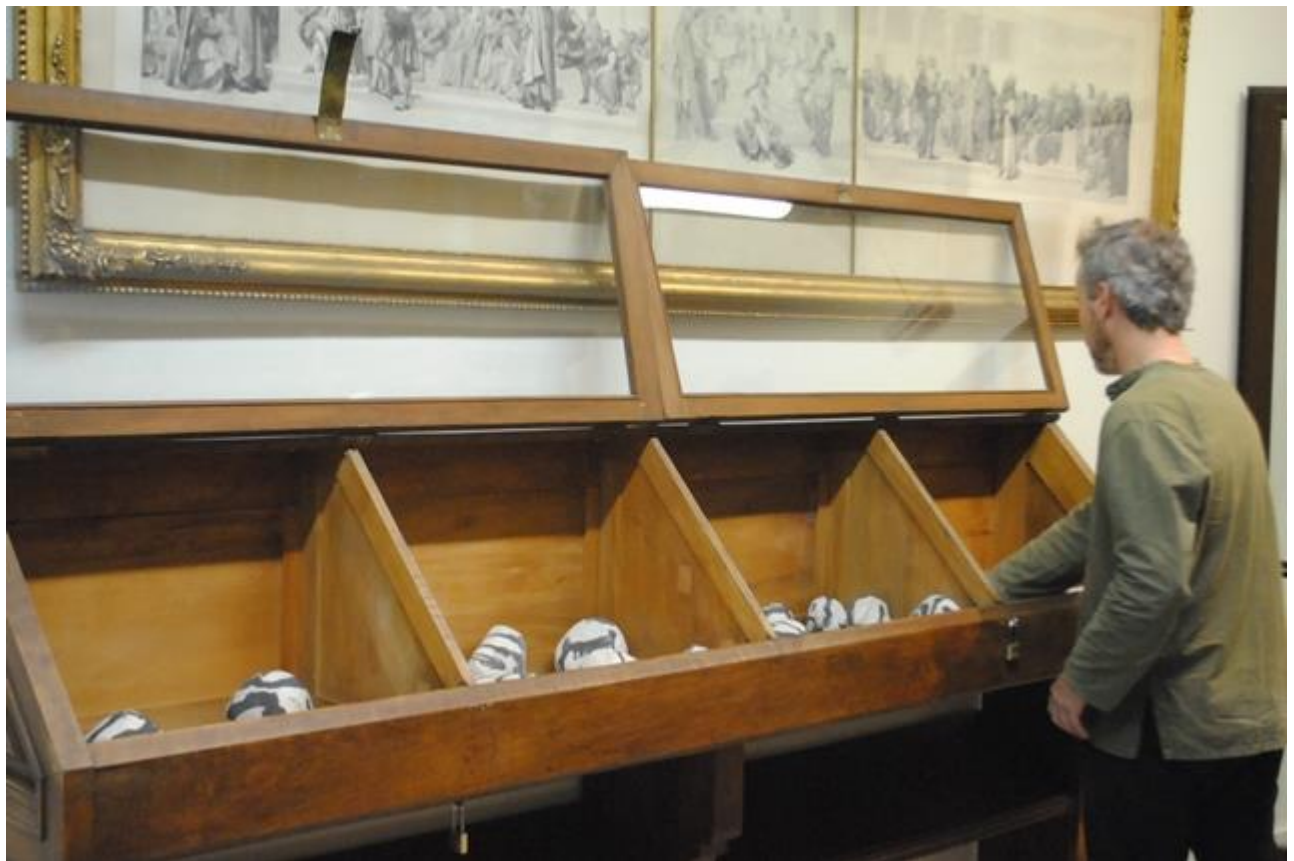
Piedras de cerámica-gres con engobes de porcelana escritas a modo de caligrafía oriental