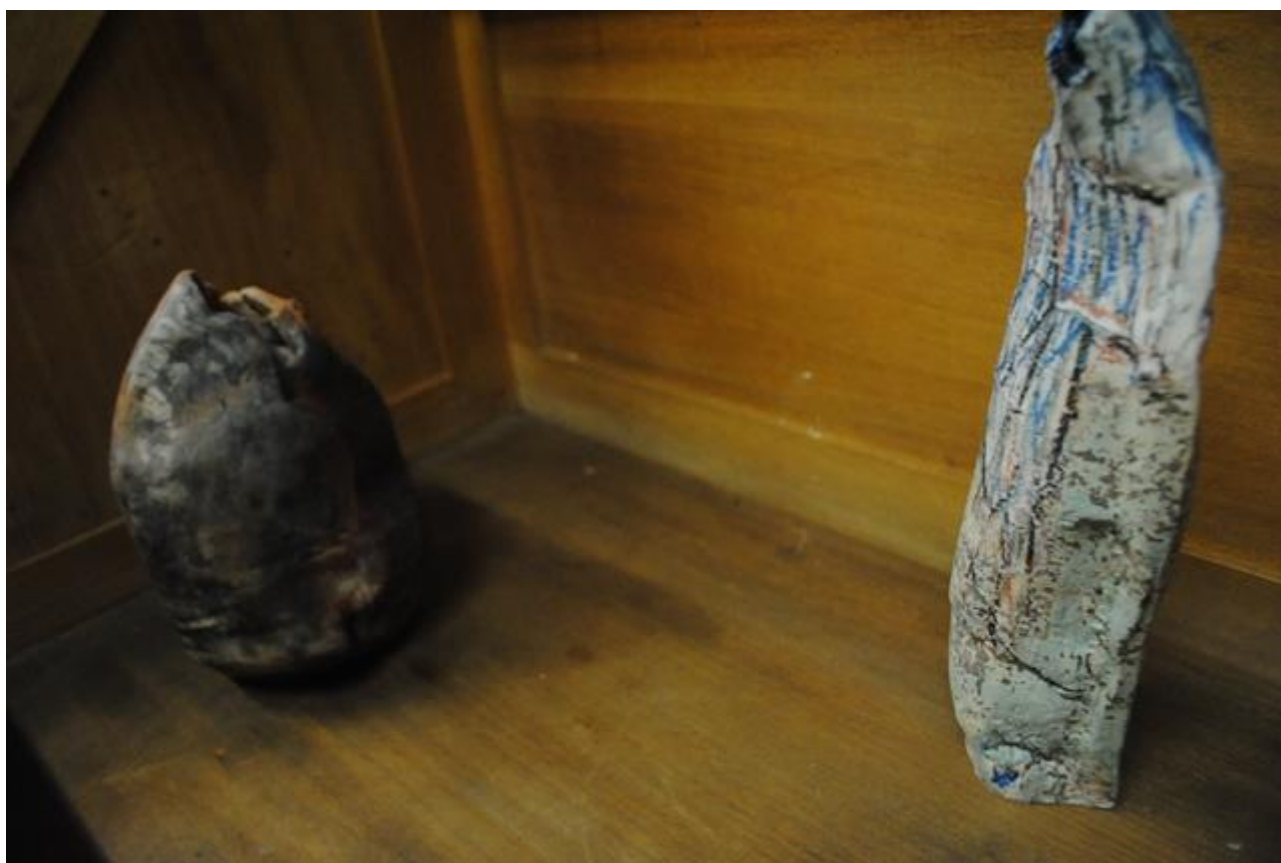
Piezas de cerámica