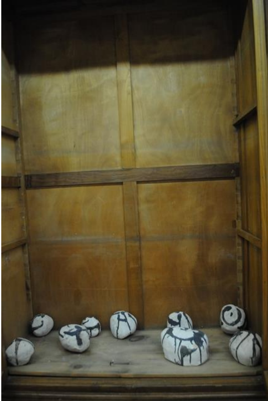
Piedras de cerámica-gres con engobes de porcelana escritas a modo de caligrafía oriental