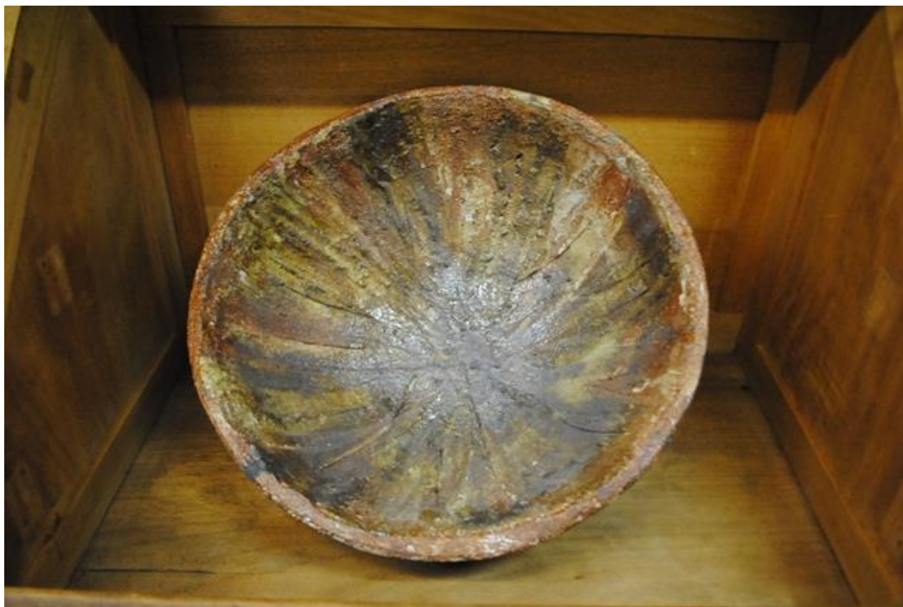
Pieza de cerámica