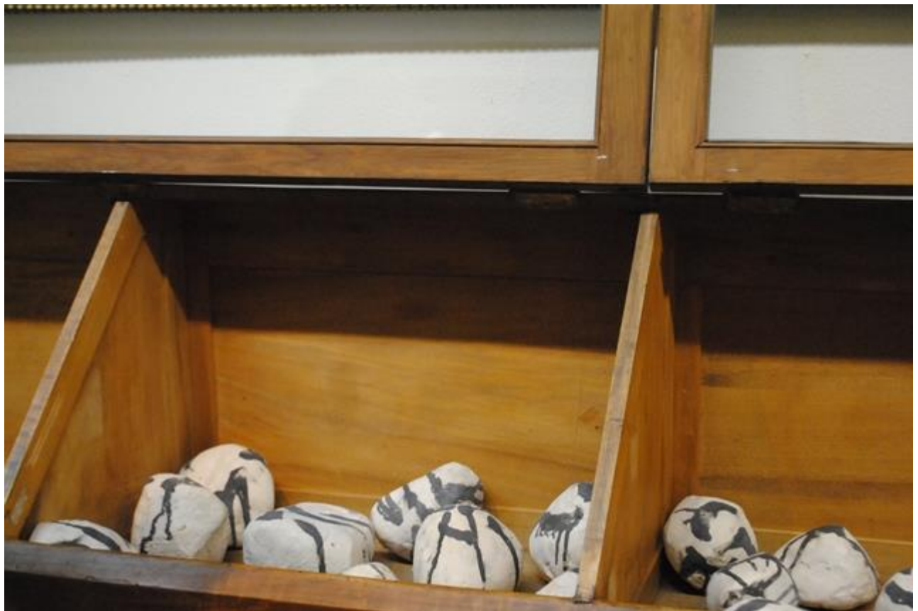
Piedras de cerámica-gres con engobes de porcelana escritas a modo de caligrafía oriental