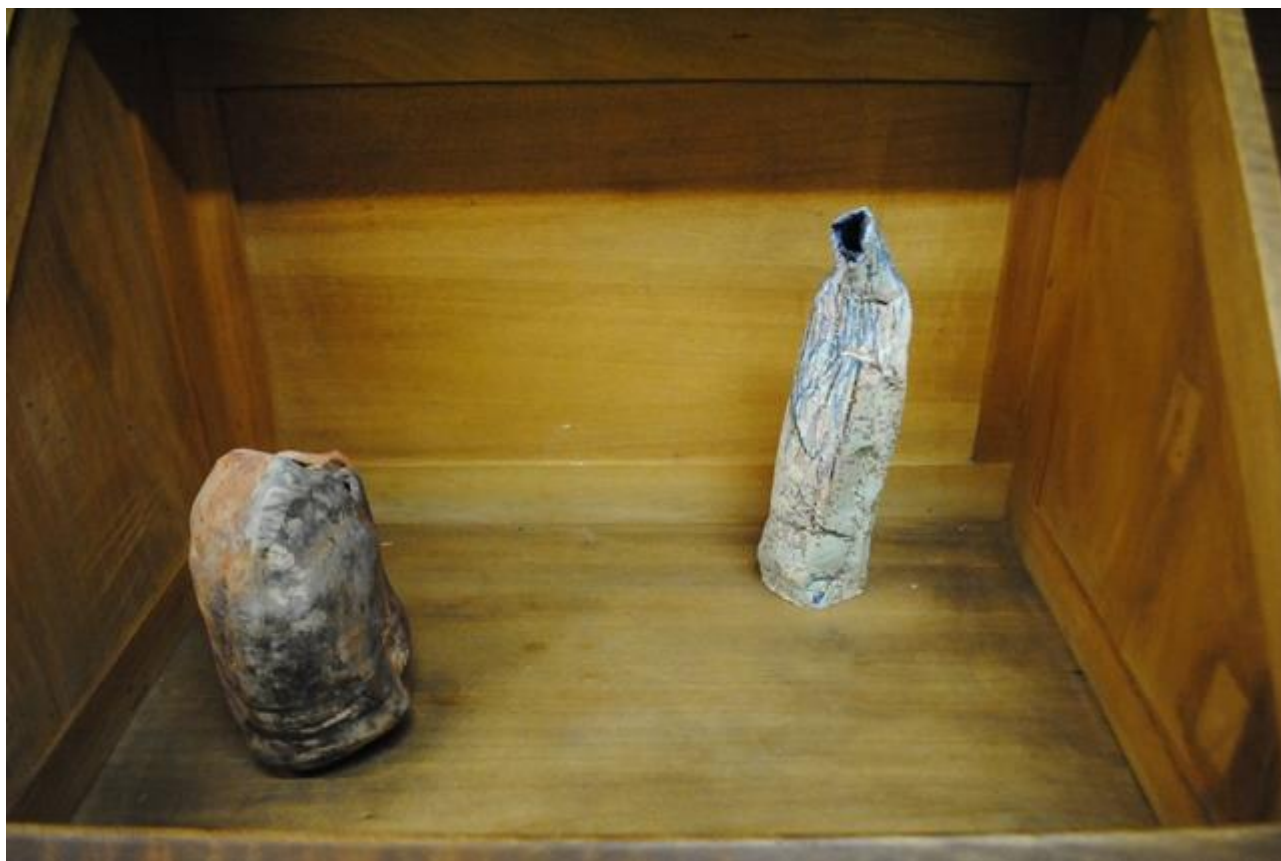
Piezas de cerámica