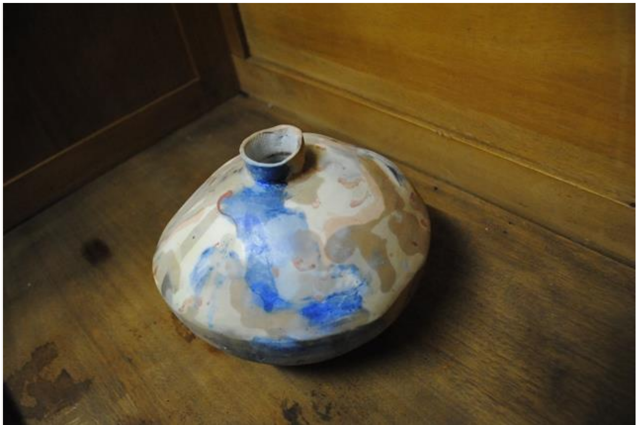
Pieza de cerámica