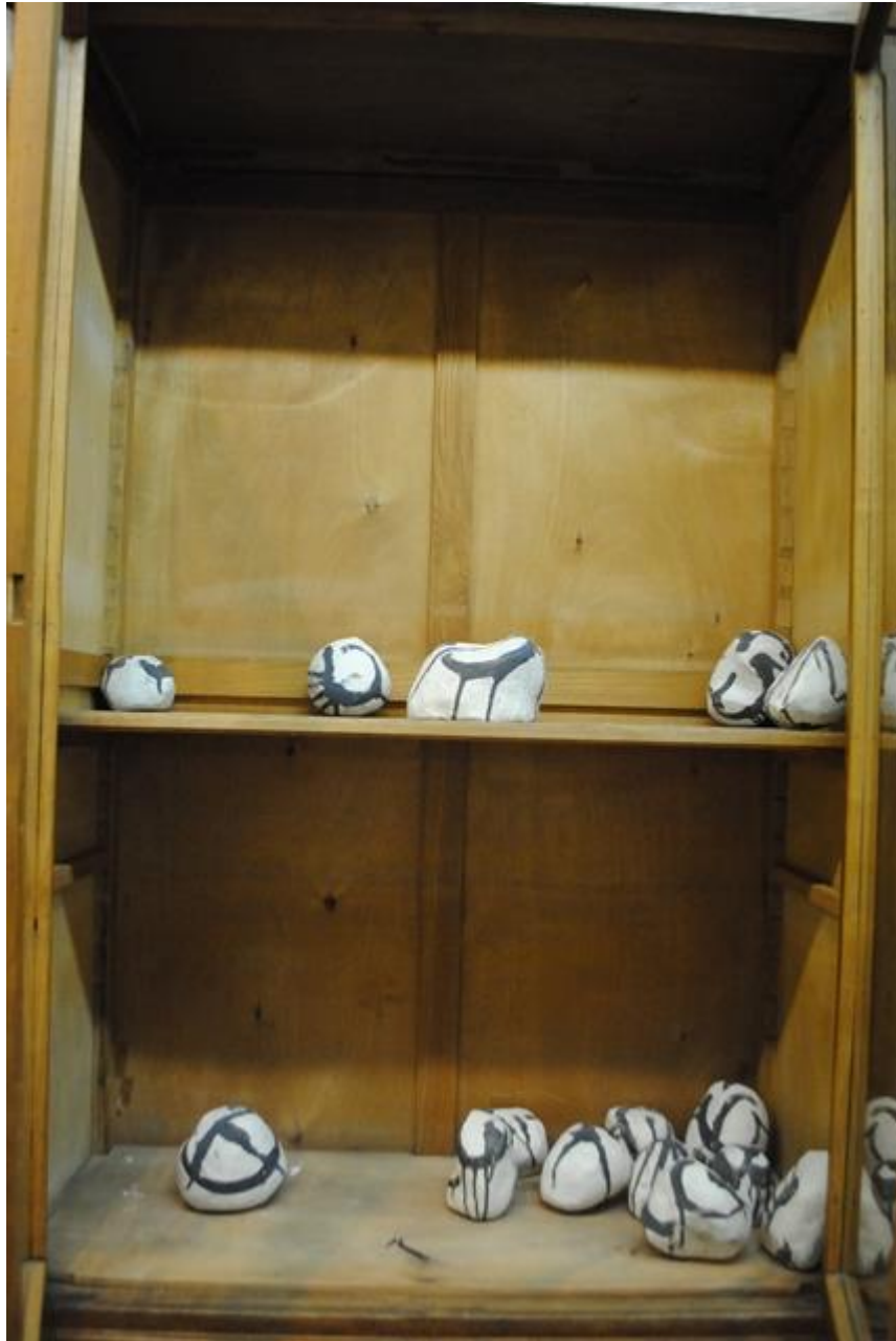
Piedras de cerámica-gres con engobes de porcelana escritas a modo de caligrafía oriental