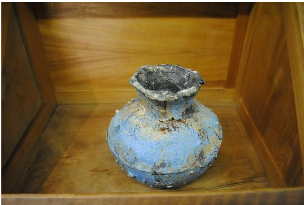
Pieza de cerámica