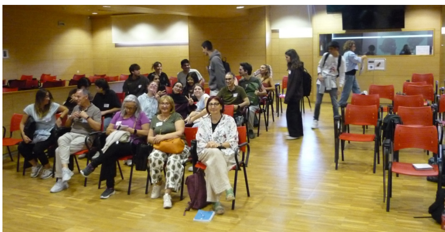
Fig. 6. Algunos de los participantes a la reunión conjunta del 8 de octubre de 2025.

– Reunión entre alumnado, mentores, profesorado y receptores de las asociaciones de Coslada y San Fernando (Fig. 6). Tuvo lugar en el Salón de Actos del Edificio Multiusos de la UCM el 8 de octubre de 2025. Con el objetivo de crear un ambiente relajado y mejorar la cohesión del grupo se hizo uso del ordenador de la sala para reproducir música. Para la realización de las dinámicas alrededor de la presentación de los temas de las visitas guiadas se utilizó cartelería con imágenes de las piezas más representativas del tema de cada equipo, así como etiquetas y marcadores para identificar a todos los participantes y promover una atmósfera de igualdad y colaboración. Desafortunadamente, las dificultades ajenas al proyecto detalladas en el punto 4.2.1 impidieron participar a más miembros de asociaciones.