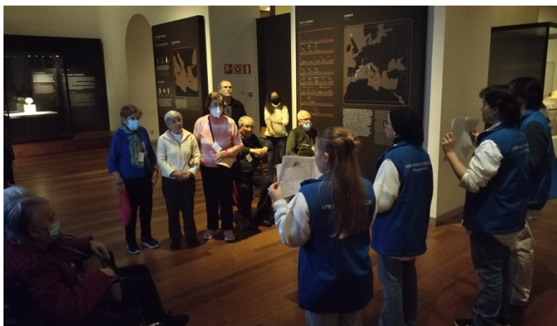
Fig. 2. Imagen de la visita realizada el 16 de dic. 2025 a los residentes de la residencia Bouco. Los alumnos con los chalecos del proyecto.

de sus trabajos a las necesidades de los receptores gracias a lo aprendido en el taller de accesibilidad cognitiva.