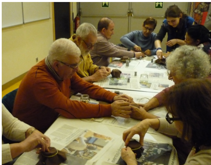
Fig. 3. Imagen de la actividad sobre sellos en Próximo Oriente realizada el 19 de dic. 2025 a uno de los grupos de los Mayores de San Fernando.

algo de la historia antigua de un mundo bastante desconocido», «(h)e aprendido cosas que desconocía de esas culturas».