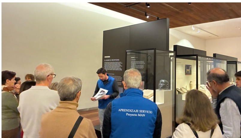
Fig. 1. Imagen de la visita realizada el 16 de dic. 2025 a los miembros del Taller de Historia del Arte. Uno de los miembros de AFA en primer plano, de espaldas, con el chaleco del proyecto.

En todos los casos se trata de personas mayores (Fig. 1) y con diferentes niveles educativos y en los casos particulares de los miembros de AFA Corredor y la residencia de mayores Bouco, también con diversidad funcional y/o cognitiva.