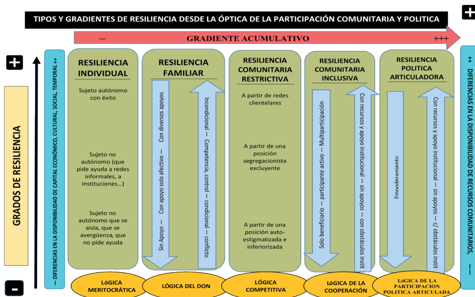
Figura 2. Tipos y gradientes de resiliencia desde la óptica de la participación comunitaria y política

calidad y alcance del capital social (y que vienen, en buena medida condicionados por la posición en la estructura social, así como por la estructura de oportunidades que se localizan en el contexto en el que se desenvuelven). Al mismo tiempo, en los diferentes contextos encontramos diversos grados de desarrollo de los recursos y prácticas que fomentan (o en ocasiones obstaculizan) la participación social, comunitaria y política. A través de este espacio multidimensional, considerado en forma de continuum, también se puede hablar de distintas modalidades de resiliencia que podemos construir como tipos (a modo de tipos ideales ). Una propuesta sintética de dichos tipos de resiliencia la encontramos en la Figura 2.